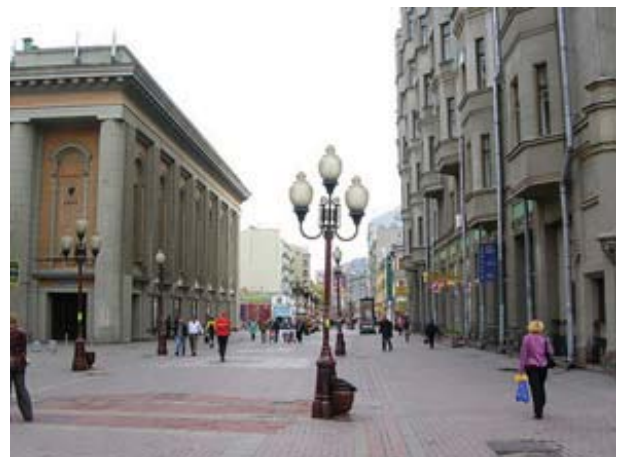
Рис.6. Улица Арбат в г. Москва. Прототип российских пешеходных улиц.

отчужденное совершенство памятников и не абстракции упорядоченности и стиливого единства, а конкретность, неповторимость следов человеческого бытия, связывающих настоящее с пластами прошлого, личное, интимное – с общезначимым» [6]. Необходимо внимательнее относиться к тем «следам», оставленных нам прошлыми поколениями, культивировать их и подчеркивать, заручившись, прежде всего, деликатностью и здравым смыслом.