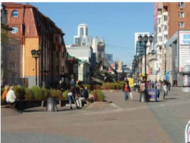
Рис.5. Улица Вайнера в г. Екатеринбург.