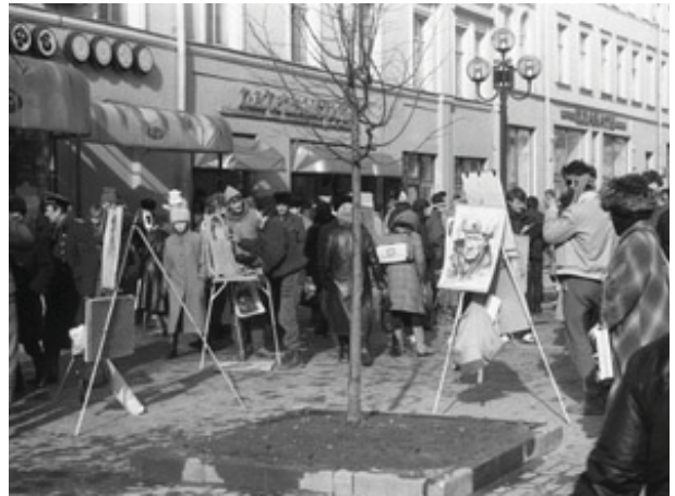
Рис. 2. Улица Арбат в Москве, 1987 г. Концентрация общественного интереса к пешеходному Арбату.

Арбат это не дух и воспоминания, а конкретная процессуальная среда, привела факты, говорящие о большой потребности людей в данном типе пространства: «... если сегодня, благодаря нам, москвичи, восемь миллионов, знают что такое улица, где можно увидеть человеческие лица, ... если. когда люди приходят на улицу и у них меняется походка, выражение лиц, они впервые учатся ходить прямо и свободно, а не ютиться на тротуаре, в шуме, где и поговорить толком друг с другом нельзя, – значит, мы выполнили социальный заказ Арбата» [4] (рис. 1,2).