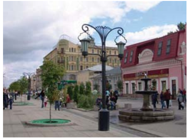
Рис.4. Улица Ленинградская в г. Самара.