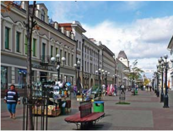
Рис.3. Улица Баумана в г. Казань.