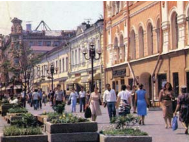
Рис. 1. Улица Арбат в Москве, 1987 г. Парадность обновленного Арбата.