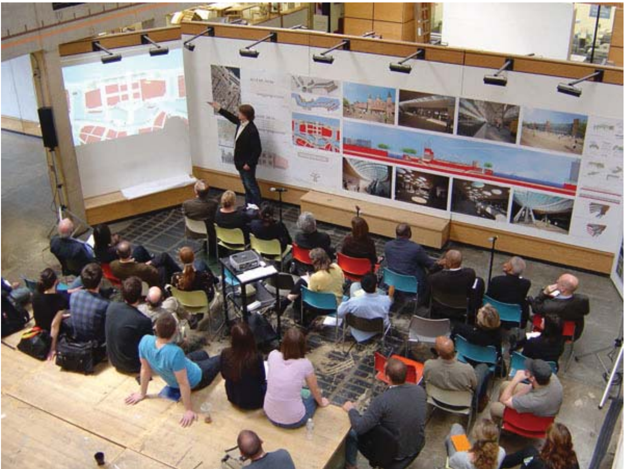
Рис. 2. Презентация дипломного проекта студента университета штата Мериленд, США, 2009 г.

tion techniques» [7, 13]. Репрезентационная техника (representation techniques) – это способы и техники отображения информации об объекте (материализации архитектурного замысла) посредством эскизов, моделей, проекций и изображений, в то время как презентационная техника (presentation skills) – способ донесения информации до адресата. В отечественной литературе термин «репрезентация» используется редко, однако, стоящее за ним понятие – разработка презентационных материалов (графического и объемного представления) – детально исследовано в области проектного поиска и моделирования, в том числе авторами А.В. Степановым, К.В. Кудряшовым, А.Д. Куликовым, Н.Ф. Метленковым. Так, разработка архитектурных макетов относится к области объемного моделирования. Макет рассматривается как «творческий прием и как средство воспроизведения композиции», «средство выражения архитектурного замысла», «предметный носитель образа», а «макетирование как творческий процесс поиска архитектурной композиции». В рамках плоскостного или графического моделирования рассматривается архитектурная графика «как средство выражения проектных замыслов» [2, С. 196-197].