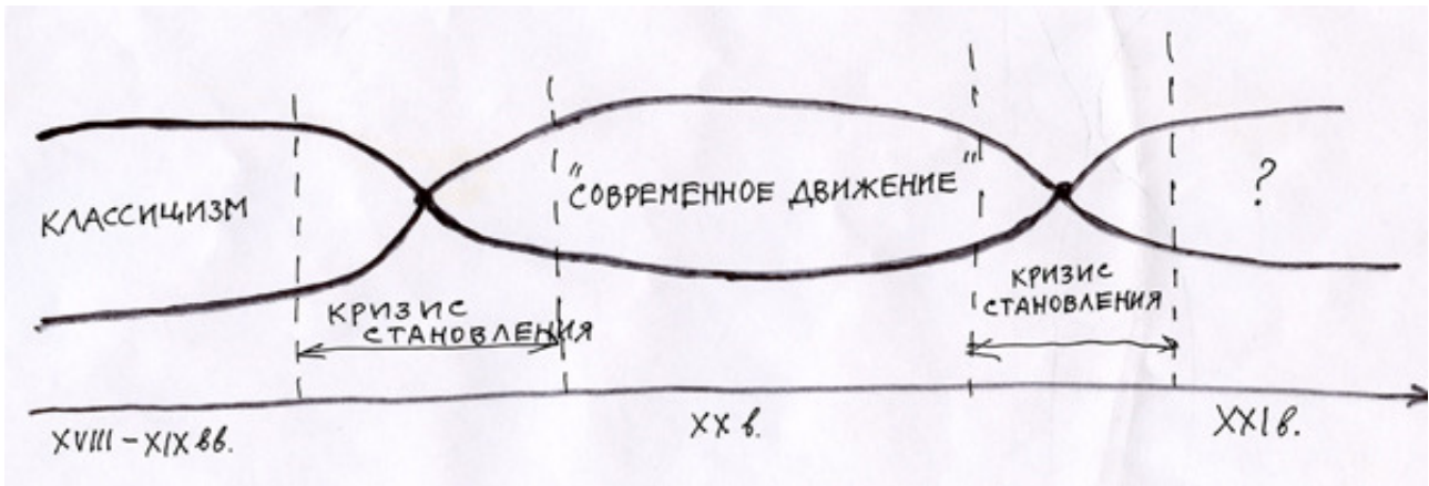
Рис. 3. Смена стилей

периода «кризиса становления». Они показали, как критиковался классицизм (несоответствие формы и содержания, декоративность ради декоративности, а не функциональное подчеркивание структурных элементов формы и пр.), как и почему появляются новые формы (металл в архитектуре), как конструкция стала доминировать над декором, избавляться от него и т.д. Но возникает желание показать, что возникла уже следующая точка бифуркации. Появилась принципиально новая архитектура: адаптивная архитектура – изменяющаяся от прикосновения человека. Появилась «исчезающая» архитектура, которая может закрываться «облаком», менять цвет и фасад методом проецирования на здание соответствующей информации и др. Изменились материалы, изменились требования к объекту (умный дом), изменилась политика (требования экологии, защиты природных объектов), изменились информационные потоки.