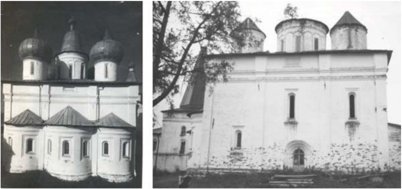
Рис. 1. Троицкий собор в начале XX в. (слева) и после 1920 г. (справа).

Из стен самой обители вышло несколько знаменитых людей. Так, учеником школы книгописания Антониево-Сийского монастыря был выросший в обители Паисий Сийский, бывший в 1677-1694 гг. патриаршим казначеем. Должность казначея давала ему возможность помогать родному монастырю. После кончины он был погребен в каменной усыпальнице Антониево-Сийского монастыря. Архимандрит Никодим, также вышедший из иноков монастыря, увековечил свое имя созданием знаменитого Сийского подлинника – иконописного сборника XVII в. Интересно, что родной дядя М.В. Ломоносова, Иван Дорофеевич, был стряпчим в Антониево-Сийском монастыре [7]. По легенде [8], в декабре 1730 г. он подарил сбежавшему из дома племяннику тулуп, который тот заложил в г. Емецк и благодаря этому смог продолжить свое знаменитое путешествие с обозом.