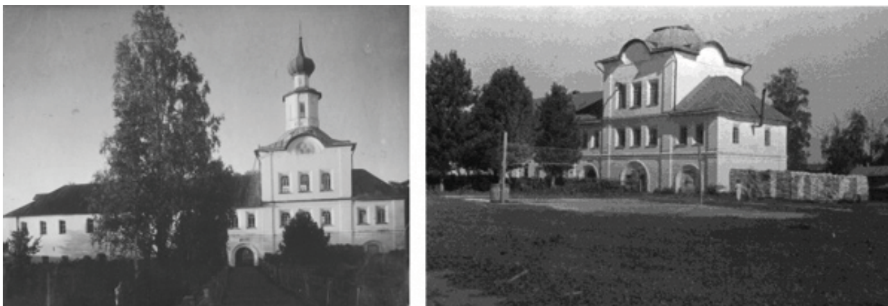
Рис. 3. Надвратная Сергиевская церковь в начале XX в. (слева) и после 1920 г. (справа).

построена в 1644 г., т.е. в то же время, что и Благовещенская церковь, согласно другим [13] – строительные работы закончили к лету 1661 г., только через три года после пожара 1658 г. Внутри колокольни располагалась церковь трех святителей Московских – Петра, Алексия и Ионы, устроенная по грамоте Новгородского митрополита Макария II от 12 марта 1657 г. [12]. Челобитную на имя митрополита Макария II о том, чтобы устроить эту церковь и получить антиминос (плат с вшитой в него частицей мощей православного святого, на котором совершается литургия), подавали келарь Паисий и казначей Гурий [11].