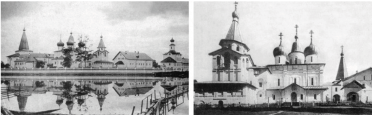
Рис. 8. Панорамы монастырского полуострова с востока и запада в наши дни.

По-видимому, собор играл роль доминанты и в XVI в., когда все церкви монастыря были деревянными, и особенно в XVII в., когда массивный белый кирпичный собор стоял между деревянными церквями. Когда же церковь Благовещения и колокольня были построены в кирпиче, и этот контраст несколько сгладился, композиция из трех церквей стала менее выразительной. Поэтому не случайно, что во время очередного ремонта собора в конце XVI-П в. была изменена форма его центральной главы. Традиционную луковичную центральную главу заменили тогда на не имевшую аналогов в архитектуре XVII в. форму – нечто среднее между главой и шатром (рис. 7, 8). Новая глава имела значительно большую высоту и по своей форме напоминала колокол. В результате значение собора как центра композиции комплекса церквей и монастыря в целом было восстановлено. Такими же соображениями был обусловлен выбор формы главы собора, вновь восстановленной в 2004 г. Из рис. 8 видно,