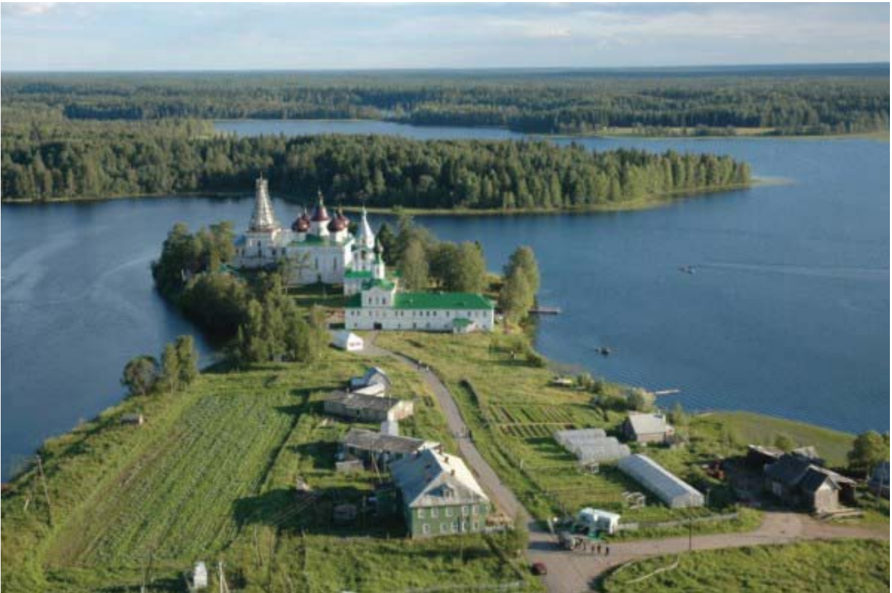
Рис. 5. Панорама монастыря с северной стороны.

постройки надвратной Сергиевской церкви, когда был создан искусственный перешеек от монастыря к ближайшему северному берегу Михайловского озера. При движении по этой дороге первая видовая точка на монастырь находится примерно в 2 км на северо-востоке от него. Благодаря рельефу, понижающемуся по мере приближения к озеру, эта видовая точка расположена выше монастыря. Поэтому двухэтажные здания гостиниц, построенные вдоль дороги перед въездом на территорию монастыря, не перекрывают его панораму. При дальнейшем приближении по этой дороге Сийский монастырь ненадолго скрывается за лесом, а затем, когда дорога поворачивает с северо-востока на север, он становится виден вновь, но уже с севера. При этом все видовые точки от северной границы полуострова до главного входа в монастырь через ворота Сергиевской церкви, располагаются в одном направлении – с севера на юг, а панорамы монастыря отсюда принципиально не различаются (рис. 5). Существующие на полуострове хозяйственные и иные постройки расположены по сторонам от панорамы памятников монастыря, не закрывая их, т.к. дорога идет посередине полуострова, перпендикулярно к стене и к надвратной церкви.