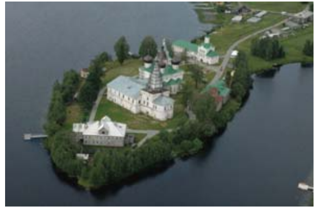
Рис. 8. Панорамы монастырского полуострова с востока и запада в наши дни.

что современные виды на монастырь с восточного и западного берегов Михайловского озера незначительно отличаются от приведенных здесь фотографий XIX в.