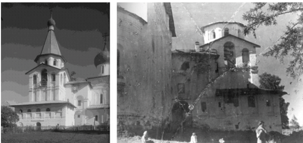
Рис. 4. Храм-колокольня трех московских святителей в начале XX в. (слева) и в 1920-х гг. (справа).

Однако следующий XVIII в. становится веком упадка монастыря. После изъятия церковных земель в ходе екатерининской секуляризационной реформы 1764 г. количество монашествующих сократилось. В XVIII в. не было построено ни одного нового каменного здания, а все строительные работы сводились к ремонту. Однако миссионерская и просветительская деятельность монастыря продолжалась и в XVII-XX вв., вплоть до Октябрьской революции и гражданской войны.