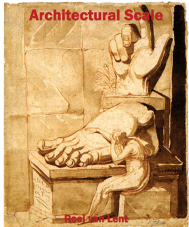
Рис. 2. Обложка книги Р.В. Лента “Архитектурный масштаб”

закономерности жизни, ее упорядоченности, взаимозависимости, цикличности процессов. В этом отношении масштаб становится поэтической сутью профессионального сознания архитектора, генерирующим методом проектного творчества. О таких масштабных связях говорят как о связях более высокого уровня или употребленных в более широком смысле, выходящем из обыденной конкретности.