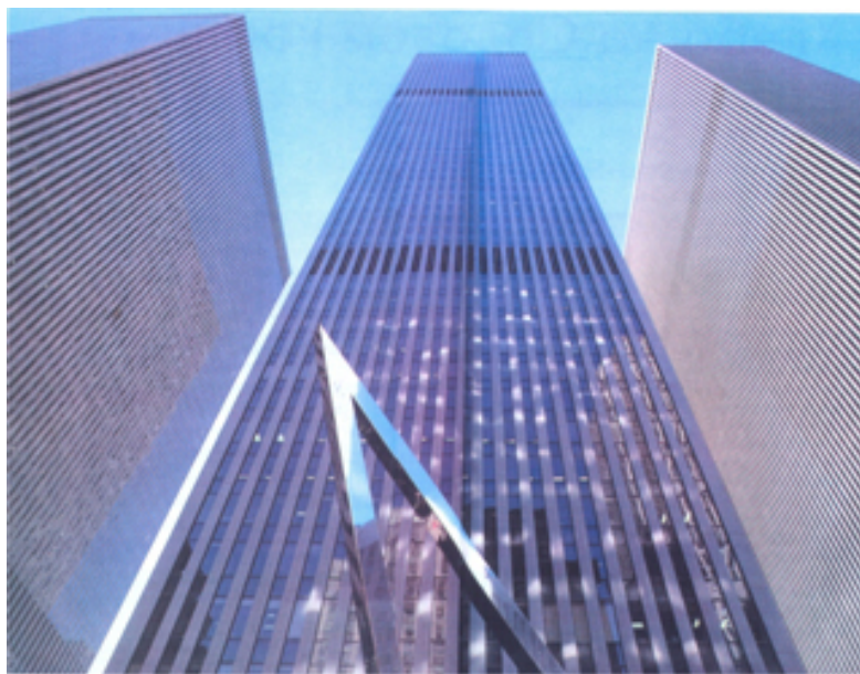
Рис. 4. Типичный образ городской среды с преобладанием небоскребов, утративших масштабную определенность

греко-римской системе рационального человеческого масштаба.