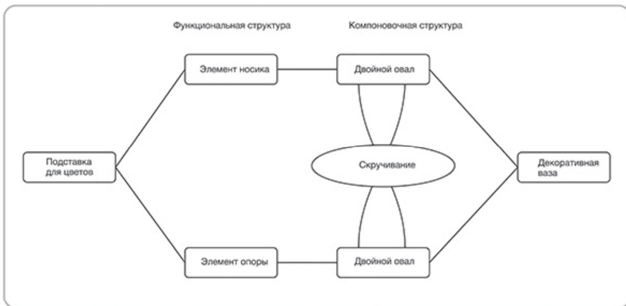
Рис. 5. Пример АП для декоративной вазы. Схема А. Юрина

Еще одной спорной позицией может быть откровенный стайлинг как видоизменение внешней формы в угоду потребителю. С другой стороны, индивидуализированное потребление способствует более рациональному потреблению за счет более вдумчивого выбора продукта, из-за потраченного на индивидуализацию времени и большую эмоциональную взаимосвязь с продуктом ввиду сопричастности к процессу создания.