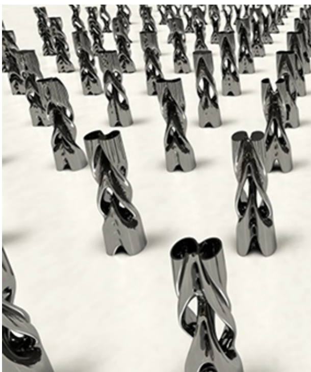
Рис. 4. Декоративные вазы GeMo.

стороны, эстетические предпочтения потребителей гораздо более разнообразны, нежели функциональные [6, с. 4]. Поэтому ориентация на эстетические требования и стилистическое разнообразие является актуальной.