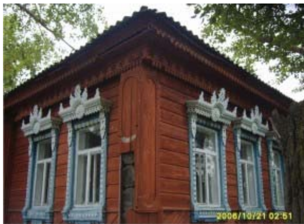
Рис. 14. Юго-западный фасад дома-причта (2010 г.)