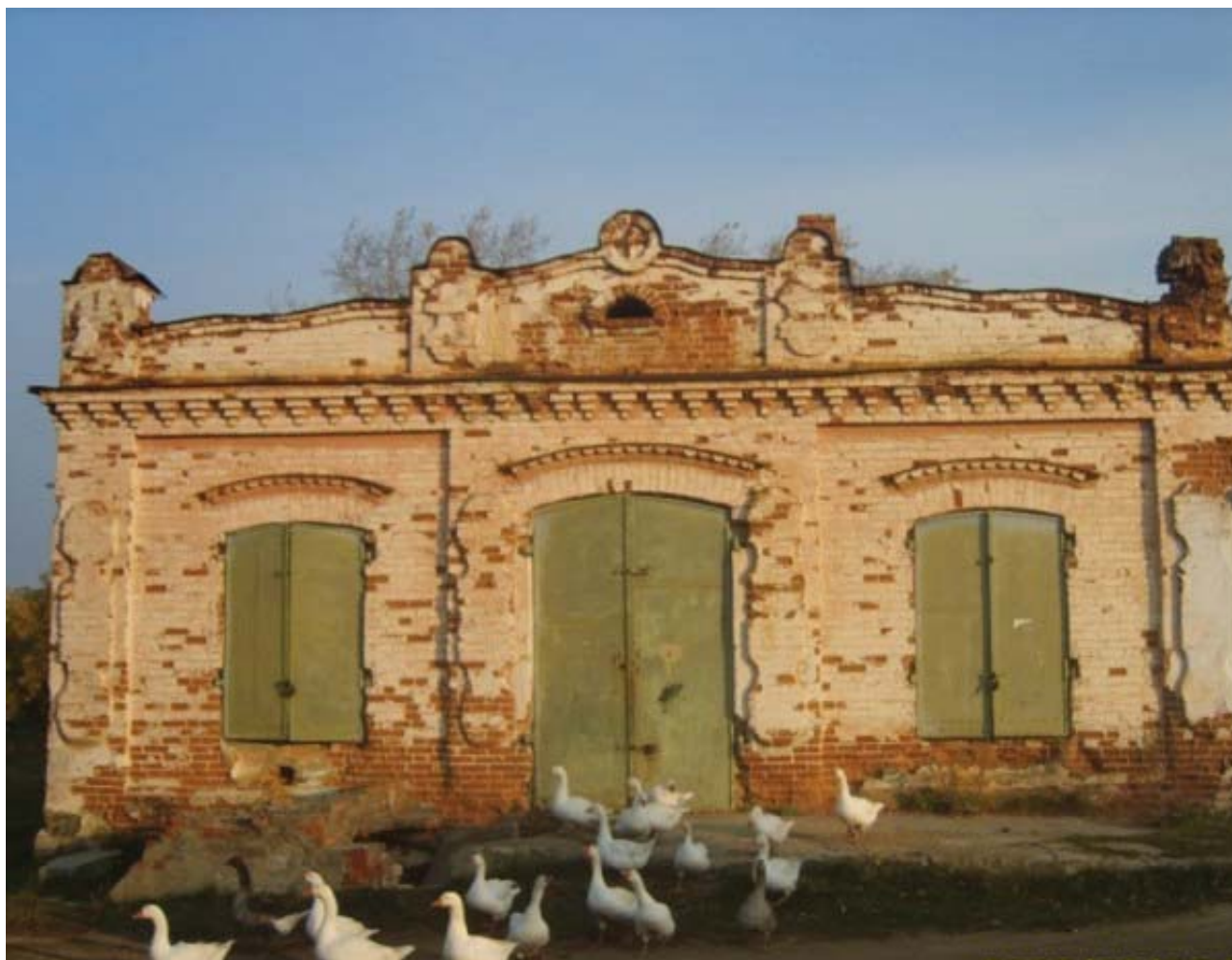
Рис.11. Южный фасад лавки купца Фигусова (2010 г.)

Подобного рода примером является одна из торговых лавок: южный фасад корпуса имеет