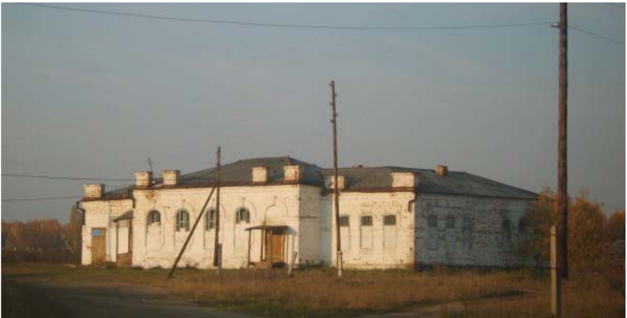
Рис.13. Восточный фасад «Товарищеского банка»

И только профилированный карниз становился объединяющим декоративным элементом, охватывающим все здание по периметру. Подобное разностилье форм и фрагментов породило новую архитектуру в Зырянке – скромно-нарядную и уютную.