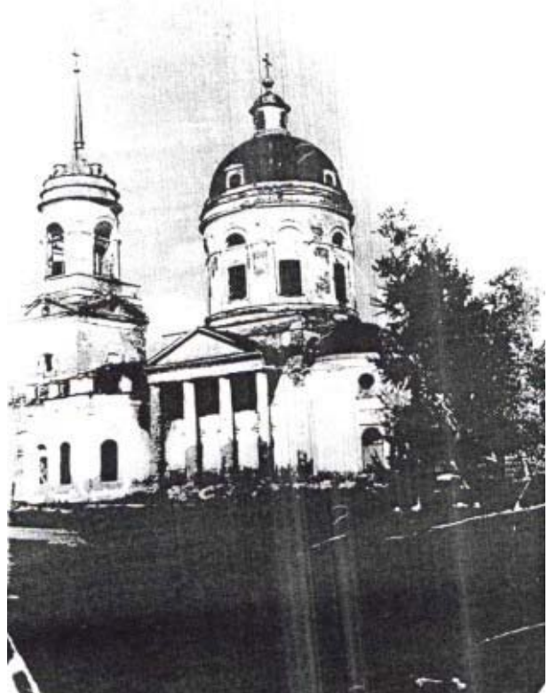
Рис.4. Юго-восточный фасад Богоявленского храма, 80-е годы XX века