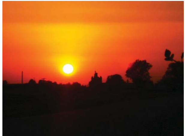
Рис. 3. Силуэт церкви на закате (2011 г.)