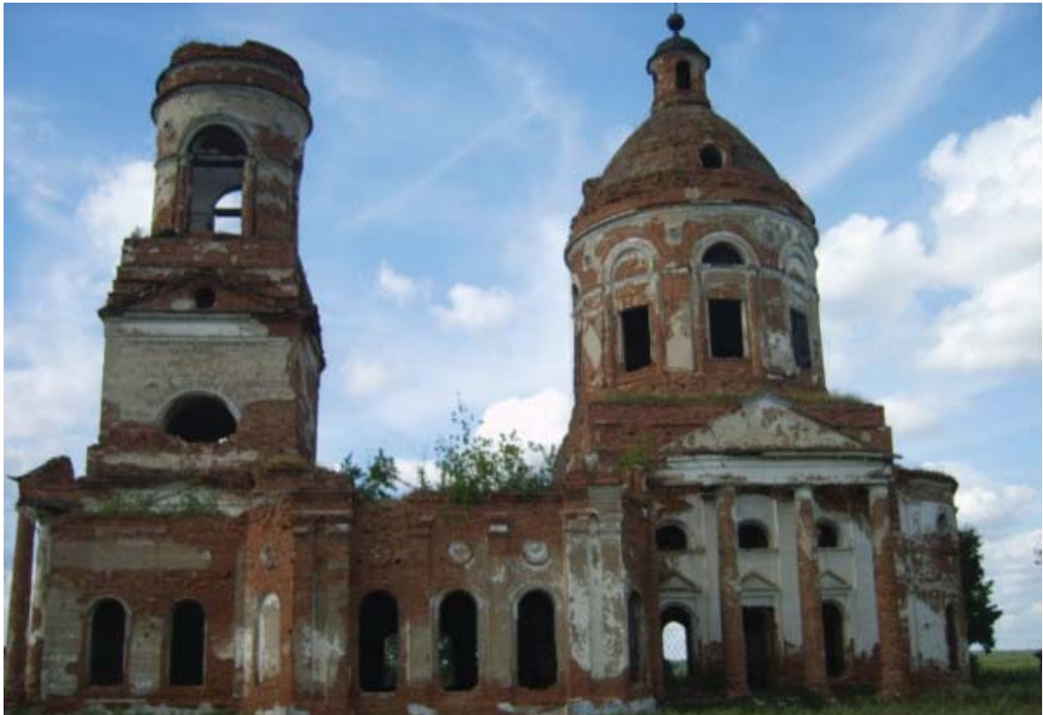
Рис.6. Южный фасад Богоявленской церкви