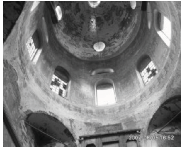
Рис.8. Наружный и внутренний интерьер Богоявленского храма

свет притвору. Цилиндрический столп верхнего звона, прорезанный полуциркульными проемами, опирается на квадратный постамент ступенчатого аттика с фронтонами, в тимпанах которых выполнены сквозные проемы. Колокольным лейтмотивом со стороны главного (западного) портала становится четырехколонный портик с коринфскими капителями, установленный на широкое крыльцо (рис.9).