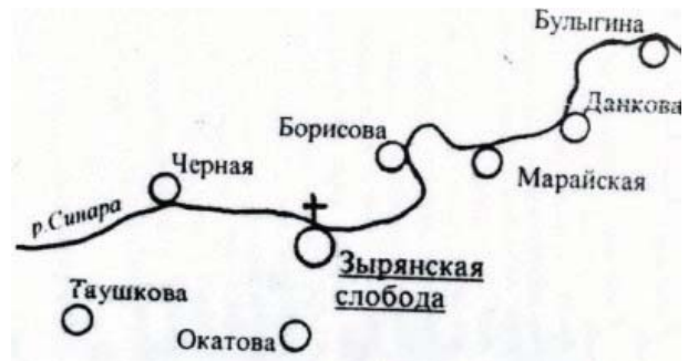
Рис.2. Схема размещения Зырянской слободы на реке Синара [10]

Не выясненным остается вопрос об авторе этого исторического памятника. Можно только предполагать, что при строительстве был использован один из образцовых проектов, близкий по стилистике работам, характерным для церквей, возводимых в этот период в Екатеринбурге, как в крупнейшем центре горной промышленности Урала и Сибири: Свято-Троицкая (Рязанская) единоверческая церковь (1814-1852 гг.) и в ближайшем селе Колчедан, церковь Сретения Господня (1825-1848 гг.), со