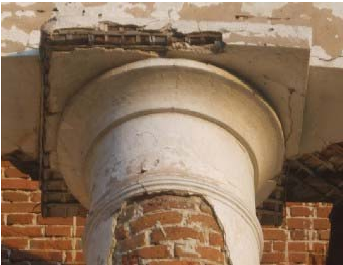
Рис.7. Фрагмент угловых пилястр и дорического ордера, Богоявленская церковь (фото автора, 2010 г.)