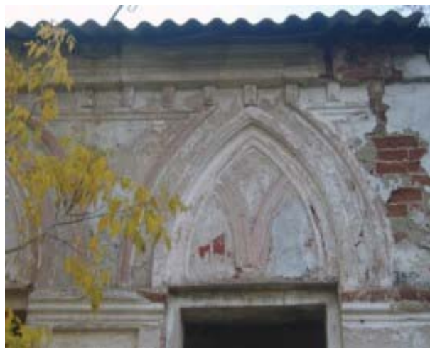
Рис.11. Восточный фасад церковно-приходской школы с фрагментом декора (фото автора, 2010 г.)

[16, С. 254-255]. Богоявленская церковь, закрепив композиционную основу застройки села, отражала не только духовные, но и культурные стороны развития края.