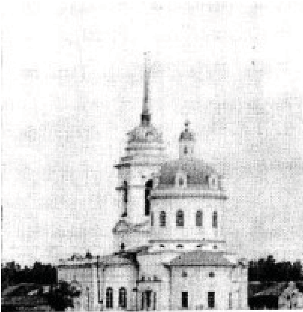
Рис.5. Церкви Свято-Троицкая (Рязановская), 1814-1852 гг. и Сретения Господня, 1825-1848 гг., с. Колчедан.

ними. Сверху их дополняют полуциркульные проемы с выкружкой по контуру. Под каждую колоннаду портиков подведено трехступенчатое мраморное крыльцо. В убранстве фасадов храма преобладают формы барокко, видоизмененные и упрощенные под воздействием классицизма, что выражается в строгой регулярности членений и плоскостной суховатой трактовке декоративных композиций.