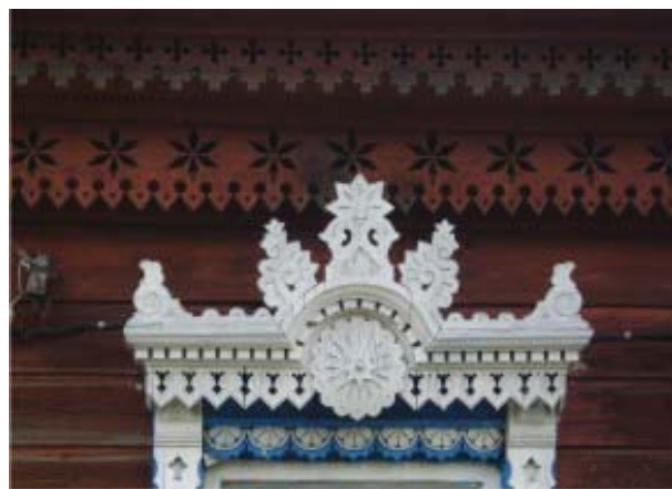
Рис.15. Подкарнизный фриз и оконные наличники

основе, при удачном создании новой гармонии на основе многообразного и свободного выбора.