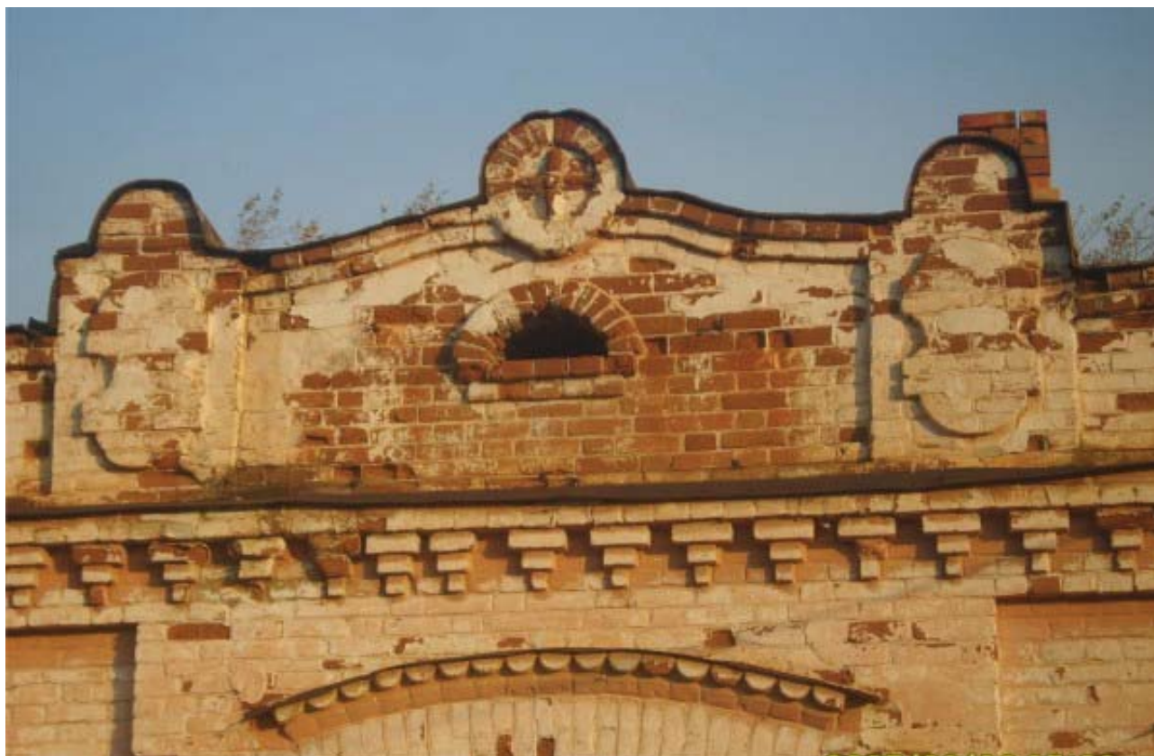
Рис.12. Фрагмент аттика торговой лавки села Зырянка (фото автора, 2006 г.)

Центральная ось его отмечена выступом – ризалитом (классицизм), венчающиеся угловые парапетные столбики с металлическими решетками – это барокко (рис.12). Применение графических архитектурных форм из разных стилей здесь налицо – полуциркульные проемы с замковым камнем в ритмическом ряду на общей форме здания и лучковые окна с надоконными нишами боковых крыльев – это стилизация.