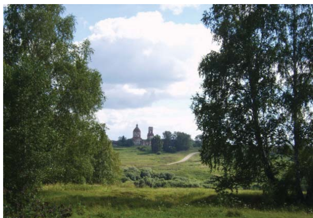
Рис.1. Панорама с. Зырянского в долине реки Синара