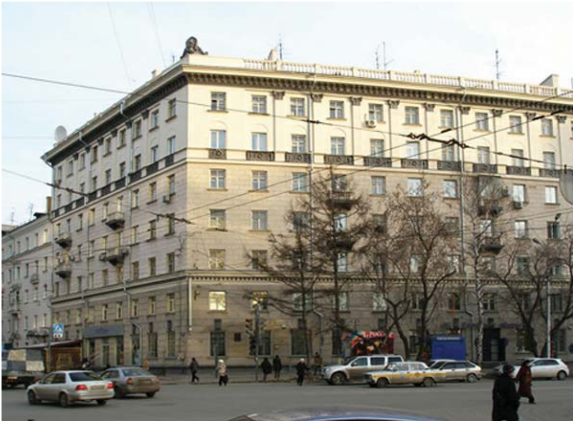
Рис. 8. Жилой дом с административными помещениями. Ул. Советская, 20. Арх К.И.Митин. Начало 1950-х гг.

этого дома не является исключением. Неизвестно, описывал ли К.И.Митин в своем отчете 1953 года уже построенное или еще только строящееся здание, а может быть повторял основные положения разработанного им проекта, но они удивительно точно во всех деталях подходят к семиэтажному зданию, стоящему на ул.Советская, 20.