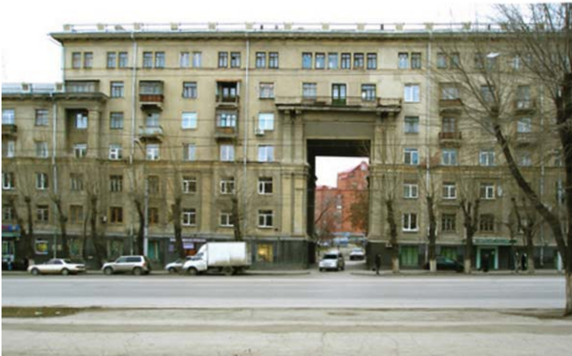
Рис.1. Жилой дом. Ул.Станиславского, 3. 1941 г.

советской архитектуры, насколько ее стилистика может резко меняться.