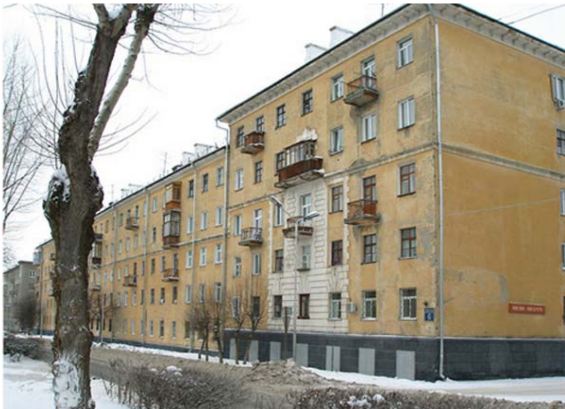
Рис. 3. Жилой дом. Ул.Пархоменко, 6. Фото автора. Середина XX в. (Фото автора)

В целом в архитектуре кварталов №1 и №2 отразились все основные тенденции стилистических