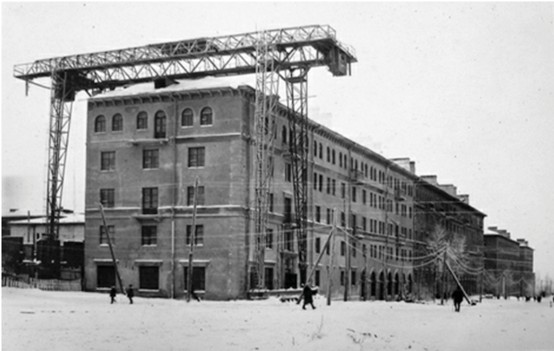
Рис.4. Здание дома №13/14. Архитекторы Л.Дермаш, И.Соколов, А.Щусев. (Фото из архива НГА. 1948 г.)

изменений этого времени, поэтому периметральная застройка каждой улицы имеет свое архитектурное оформление.