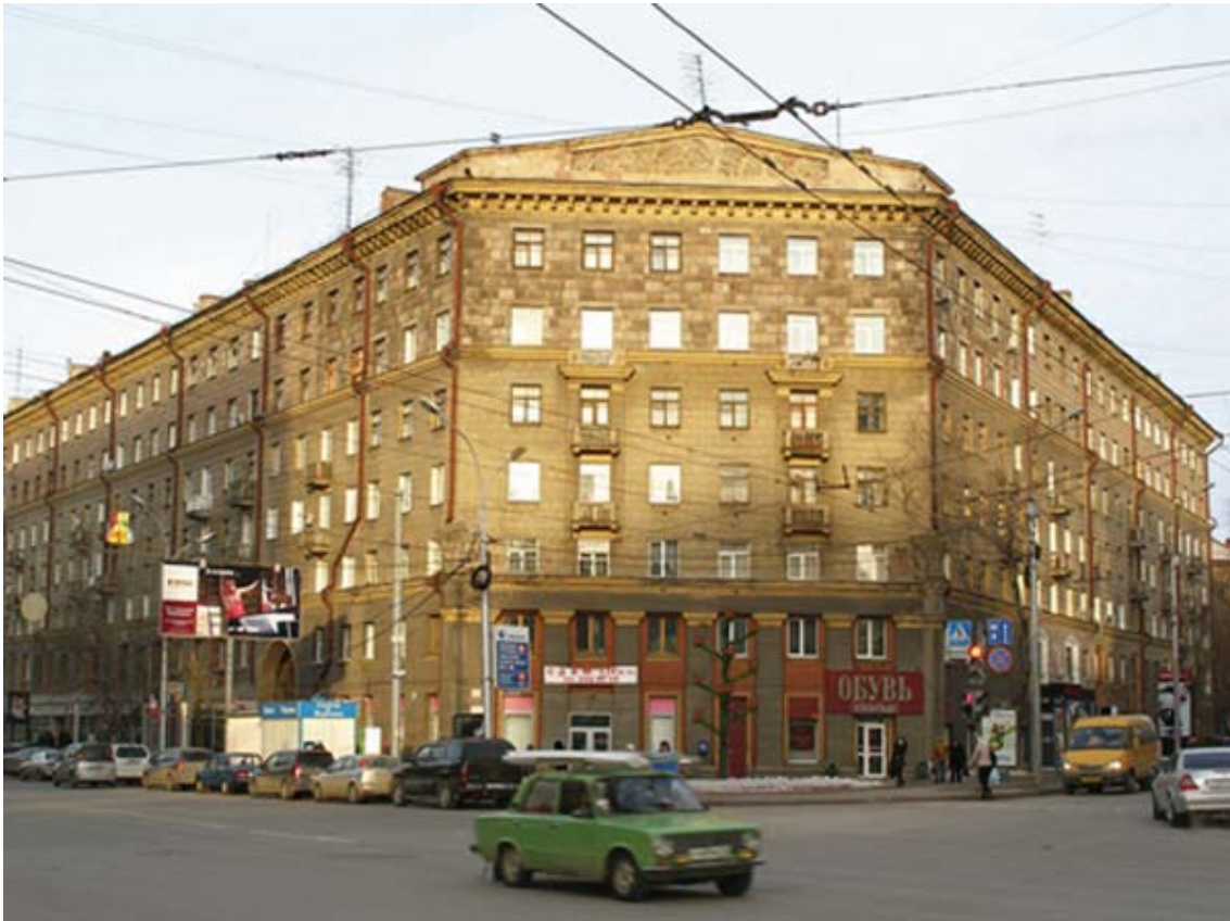
Рис. 9. Жилой дом. Ул.Советская, 49. Конец 1950-х гг.

оказались единственными зданиями, имеющими неоклассическое оформление по всей линии магистрали.