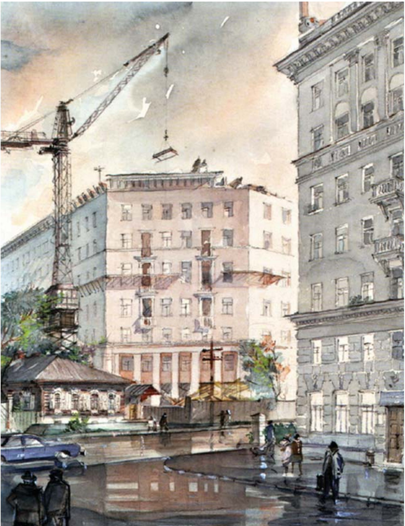
Рис. 10. Застройка ул.Советской на пересечении с Вокзальной магистралью.

учитывались объемно-пространственные задачи, работал бы ордерный метод, сочеталось малоэтажное и многоэтажное строительство (наряду с хорошим качеством строительства), существовала развитая инфраструктура, жилая застройка была сомасштабна человеку, а пластическое убранство подчиняло бы объемы принципу трёх масштабов: к природному подиуму, к человеку, деталей к целому.