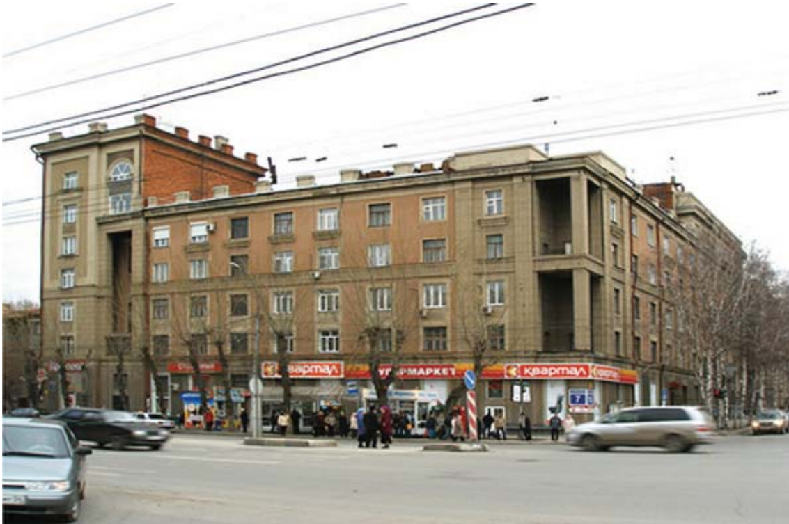
Рис. 2. Жилой дом. Ул.Станиславского, 7. Арх. В.М.Тейтель. 1940 г.

выглядит достаточно невыразительно. Отрезок улицы застроен по периметру шестью пятиэтажными жилыми домами, выходящими своими фасадами на север, что делает архитектурные элементы малозаметными и неубедительными.