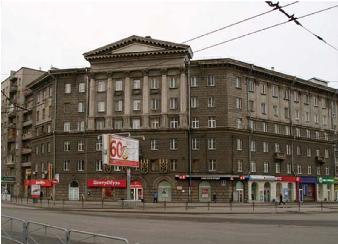
Рис. 5. Жилой дом с административными помещениями. Ул. Вокзальная магистраль, 2. Арх. К.И.Митин. 1953 г.

как и архитектор В.К.Петровский, отметит, что ансамбль Вокзальной площади никем до этого не решался: «...Если на площади им. Сталина мы имеем десятки набросков, то по Вокзальной площади, которая является парадным вестибюлем нашего города, таких подготовительных работ не было. Мы пришли от сложного к простому (много первоначальных решений были пышными, с беспокойным силуэтом, с большим количеством ударных мест). На этот жилой дом притягивалась даже башня, но все эти решения отпали после значительного анализа схем и набросков по обстройке площади. Почему мы остановились на этом решении? Дело в том, что Вокзальная площадь должна быть выразительной и мощной, имеющей образ большого города, она должна быть художественной, яркой, надолго запоминающейся, но в тоже время сдержанной, простой и ясной. Пассажир, приехавший и вышедший на Вокзальную площадь, должен почувствовать, что он находится в большом красивом, промышленном социалистическом городе, в котором нет трущоб, нет запущенных и грязных кварталов, оставшихся нам от капиталистического прошлого. Далее пассажир должен увидеть главные направления к центру города»[11].