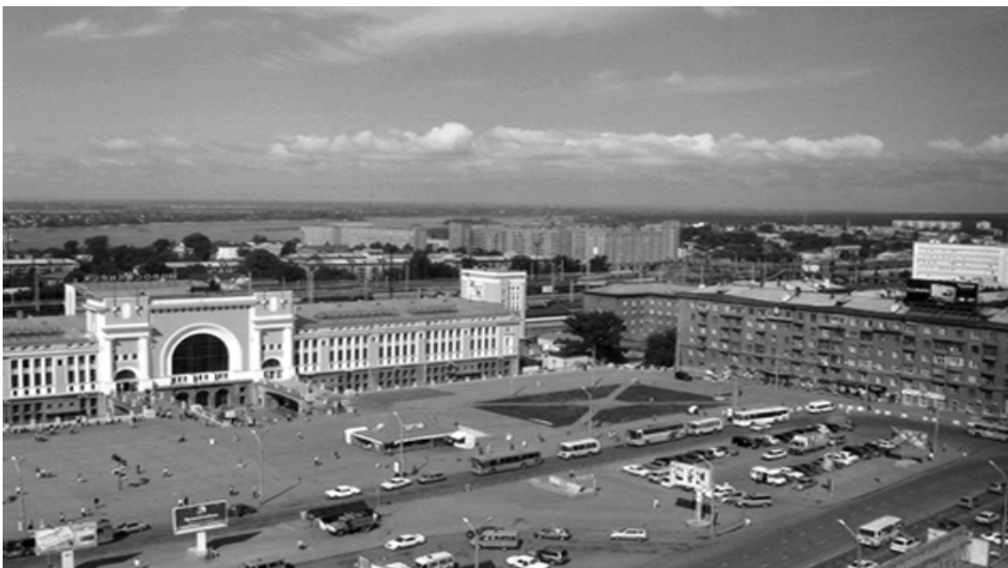
Рис. 7. Площадь им. Гарина-Михайловского. (Фото 2009 г.)

У многих проектов отсутствуют изобразительные материалы эскизных вариантов, и проект