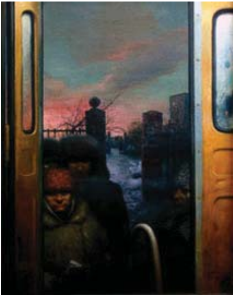
Рис.9. Г.П. Кичигин «Контроль на маршруте» (1987 г., х., м., 100х80).