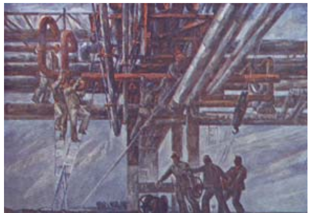
Рис.7. М.С. Омбыш-Кузнецов «Артерия Нефтехима» (1975 г., х., темп., 110x140).