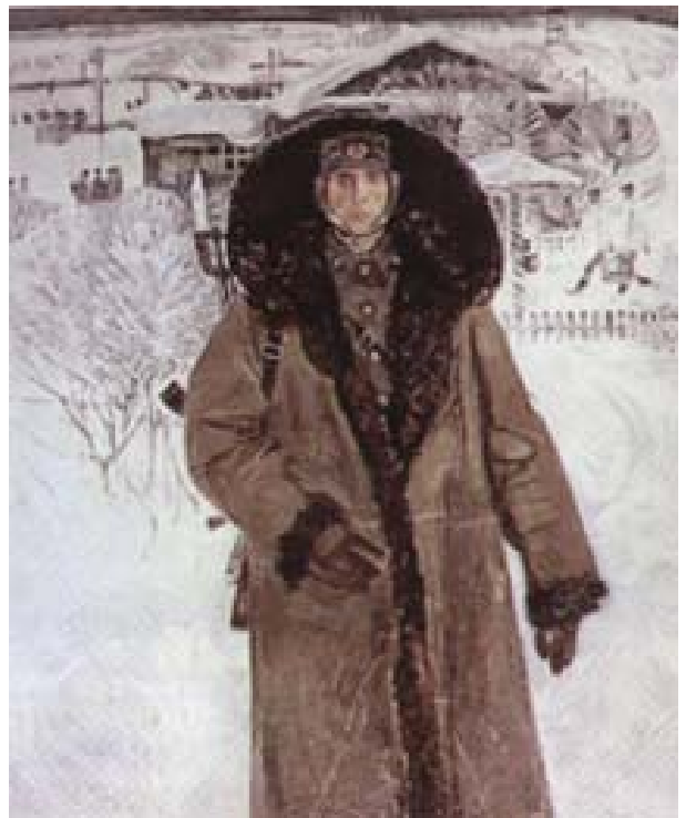
Рис.2. А.М. Знак «Часовой погранзаставы» (1974 г., х., м., 100x80)