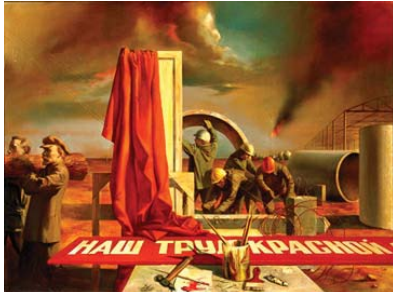
Рис.10. Г.П. Кичигин «Субботник» (1987 г., х., м., 112х150).

казаться возможным обновление жизни государства и граждан при условии возвращения к чистоте идей первых лет советской власти. Красивая легенда о бескорыстности «истинных ленинцев», уничтоженных затем «вождем народов», послужила темой для картины омского мастера. Работа пронизана пафосом надежды, что все еще будет в СССР хорошо, страна очистится от скверны сталинско-брежневских времен и будет двигаться вперед к победе коммунизма с ленинскими идеалами. Доминантой в картине является красный цвет, тема красного/красной подчеркнута даже надписью в лозунге, лежащем на первом плане, и в кумачовой драпировке, свисающей с холстов. По стилистике и лаконизму языка картина напоминает агитационный плакат: все построено на сопоставлении идиоматических выражений, широко известных иконических изображений. Ленин с бревном, группа рабочих в касках, небо с бурными облаками, огонь горящего газа/нефти, много красиво драпируемого кумача, железная производственная конструкция – все эти идиомы живут каждая сама по себе, не связываясь сюжетно, а располагаясь по закону ассоциативного ряда в клипе или в теле сюжете/клипе.