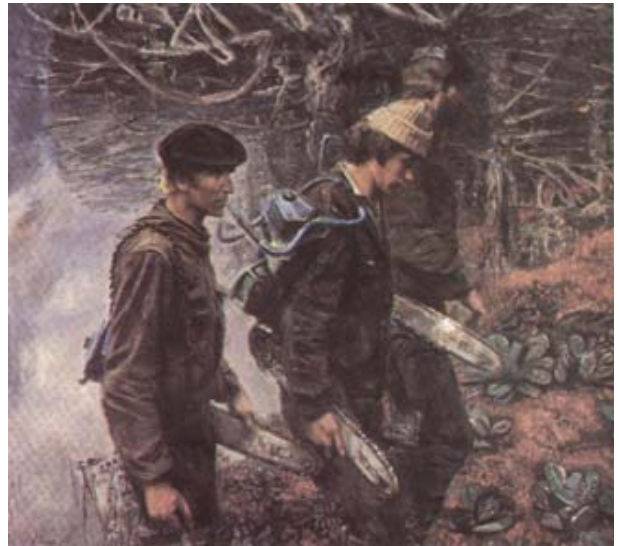
Рис.5 А.М. Знак «Парни из «Кунермы» (1979г., х., м., 100x110).

В полотне «Субботник» Георгием Кичигиным передан наивный азарт его современников, охвативший общество в перестроечные времена, когда вдруг стало