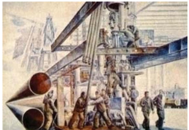
Рис.8. М.С. Омбыш-Кузнецов (совместно с В.С.Бухаровым) «Нефть Сибири» (1976 г., х., темп., 100x140). Источник: http://www.nro-shr.ru/node/56