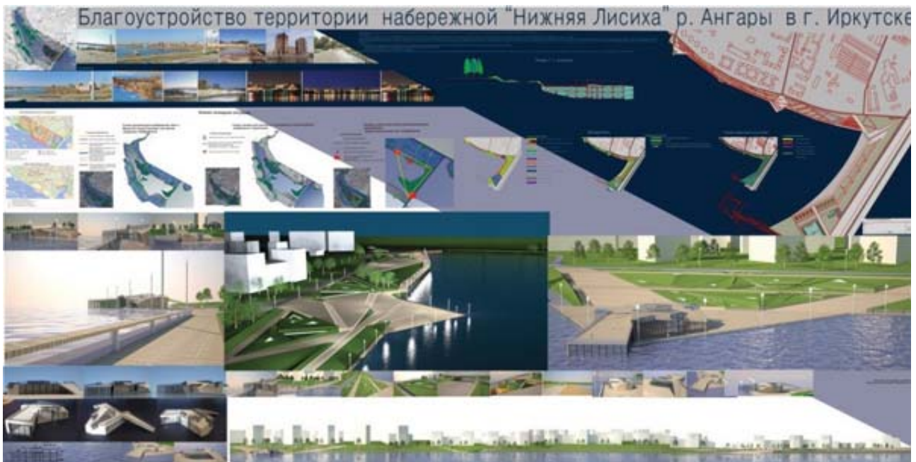
Рис. 3. Проект благоустройства территории набережной «Нижняя Лисиха» р. Ангары в Иркутске. Авт. – студ. каф. дизайна ИргТУ В. Кузьменко; рук.– доц. М.Г. Захарчук, доц. С.В. Мурашова