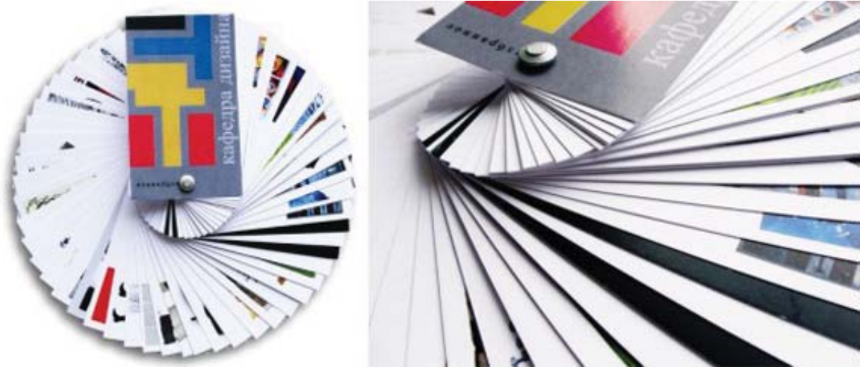
Рис. 1. Фирменный стиль кафедры дизайна факультета изобразительных искусств ИрГТУ: Каталог лучших студенческих работ кафедры дизайна. Авт. – студ. каф. дизайна ИрГТУ А. Ануфриева; рук. – проф. О.Е. Железняк, доц. А.А. Дурасов, конс. В.В. Дейкун

деятельность, при которой за счет интеграции средств дизайна и эргономики создаются эстетически и эргономически полноценные объекты и предметно-пространственная среда [1]. При этом дизайн и эргономика остаются взаимосвязанными дисциплинами, необходимость одновременного использования которых и обеспечивает эргодизайн. Специфика эргодизайна как комплексной науки состоит в системном охвате изучаемых объектов. Следует отметить, что эргодизайнерское проектирование обладает правом на индивидуальную неповторимость и своеобразие применяемых методов и создаваемого творческого продукта. Эргодизайн имеет отношение к тому, с чем взаимодействуют люди и что их окружает в городе и сельской местности, дома и на работе, в административных помещениях и средствах транспорта, на отдыхе и при занятиях спортом, в ресторанах и кафе, в процессе учебы и лечения, в театрах и музеях [3]. При таком определении эргодизайна речь идет обо всей окружающей человека предметной среде.