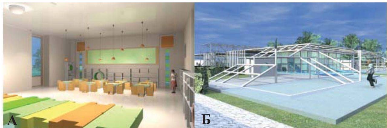
Рис. 5. Проект реконструкции детского сада №70 по ул.Безбокого в Иркутске: а – игровое пространство внутренней предметно-пространственной среды; б – игровое оборудование. Авт. – студ. каф. дизайна ИргТУ Т. Сарапулова; рук.– доц. М.Г. Захарчук, доц. А.Ю. Ладейщиков