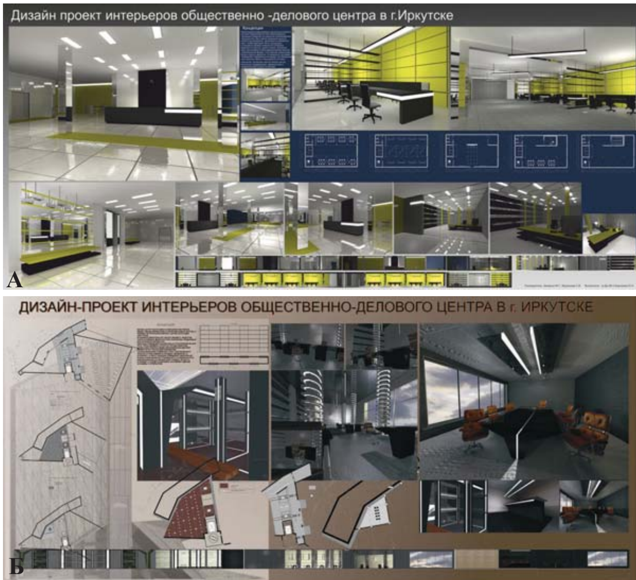
Рис. 2. Дизайн-проект интерьеров общественно-делового центра в Иркутске. Авт.: а – студ. каф. дизайна ИргТУ Ю. Киргизова; б – студ. каф. дизайна ИргТУ В. Кузьменко; рук. – доц. М.Г. Захарчук, доц. С.В. Мурашова

их восстановления и развития. Идеально, чтобы любой дизайн был эргономичным, а мерой эргономичности стала мера соответствия эстетическим, психофизиологическим возможностям и потребностям будущего пользователя данного дизайна.