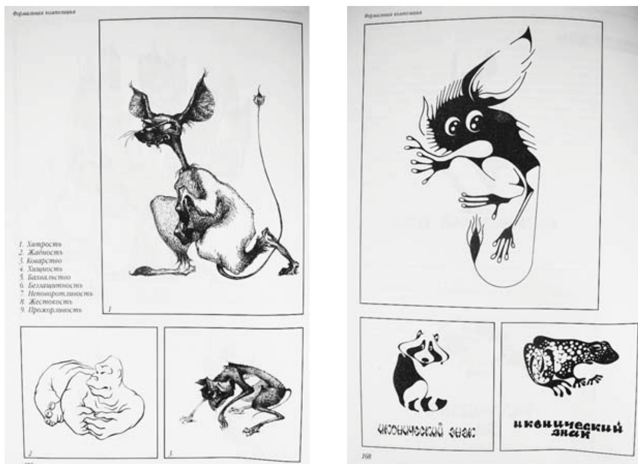
Рис. 1, 2. Студенческие работы Белорусской академии искусств [11]

свойству (придание животным качеств хитрости, жадности, коварства, пугливости) (рис. 1, 2). Однако ассоциативность лежит в основе таких психических процессов, как восприятие, память, мышление, воображение и других; в художественную способность, необходимую для художественного творчества, ее превращает лишь высокая степень развития, проявляющаяся в художественном продукте или в его восприятии реципиентом [2]. Эти внехудожественные способности можно отнести и к общетворческим способностям, показывающим уровень развития креативности личности в целом.