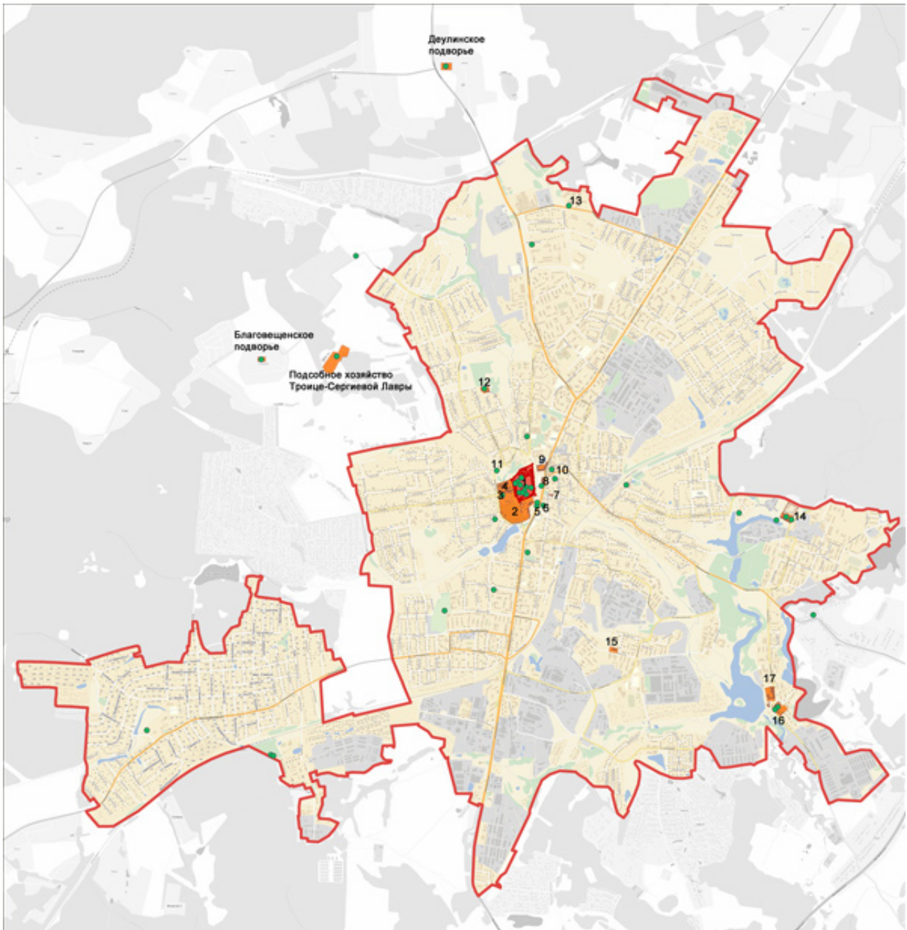
Рис. 8. План Сергиева Посада нач. XXI века Условные обозначения: