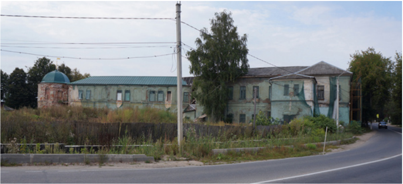
Рис. 4. Комплекс Спасо-Вифанской семинарии. 2013