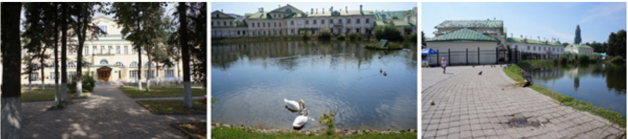
Рис. 5. Комплекс Старой монастырской гостиницы. 2013

центр, финансово-правовой центр, миссионерский центр, молодежный православный центр, издательско-полиграфический центр, центр дополнительного образования, информационно-аналитический центр, библиотека, пансионат, спорткомплекс, медицинский кабинет, яхт-клуб и трапезная. Общая численность обучающихся, преподавательского состава и технического персонала составит около 1000 человек [7].