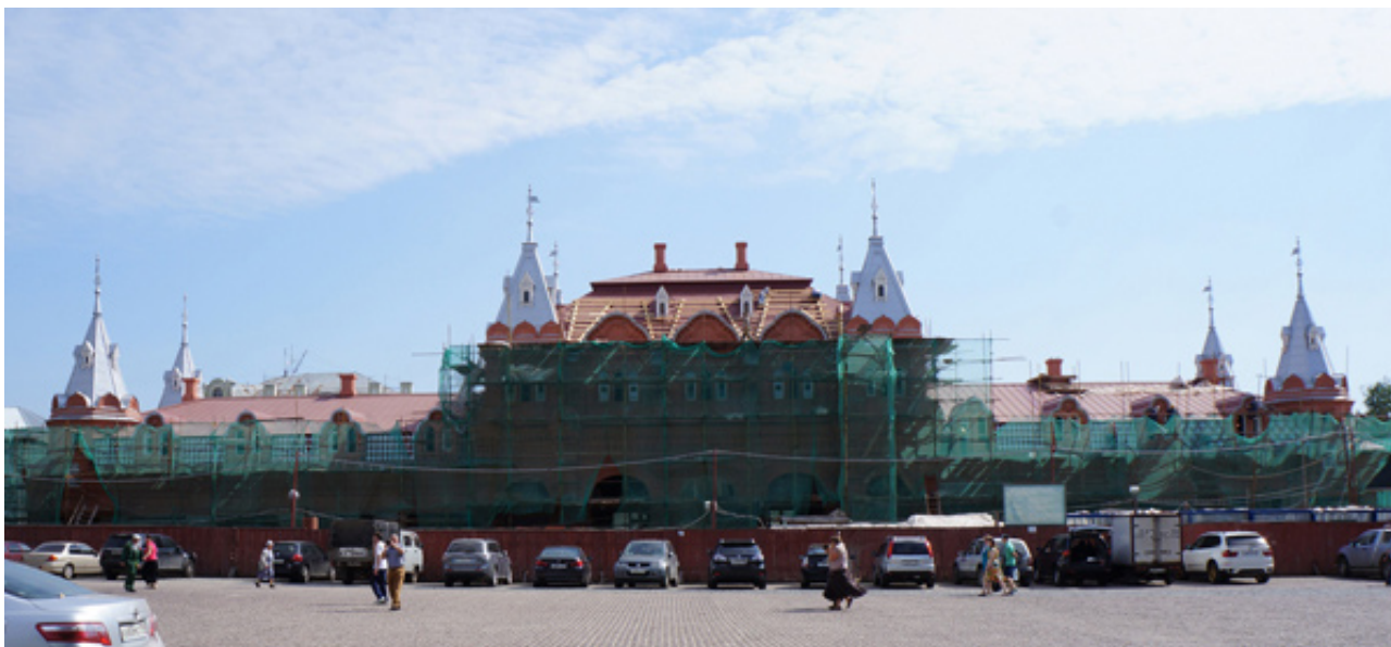
Рис. 2. Духовно-просветительский центр Троице-Сергиевой Лавры. 2013

нужд на Красногорской площади, напротив главного входа в монастырь с 2010 года. ведется реставрация бывших торговых рядов (зданию возвращают дореволюционный вид) (рис. 2).