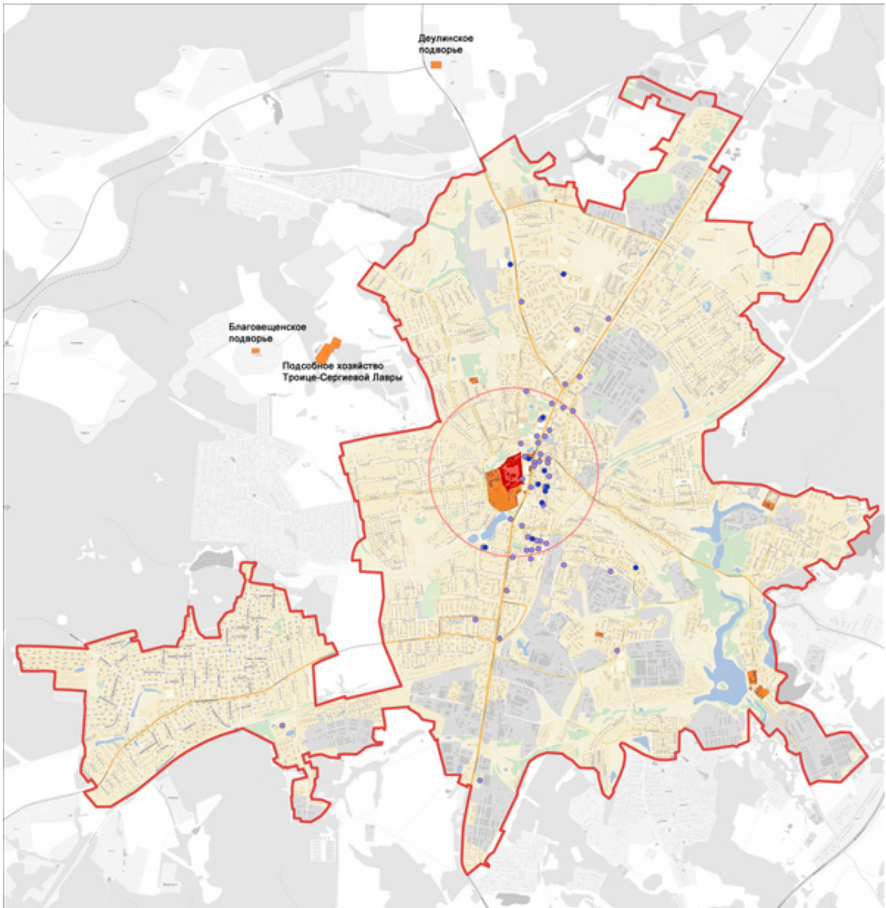
Рис. 10. План Сергиева Посада нач. XXI в. Гостеприимная инфраструктура. Условные обозначения: