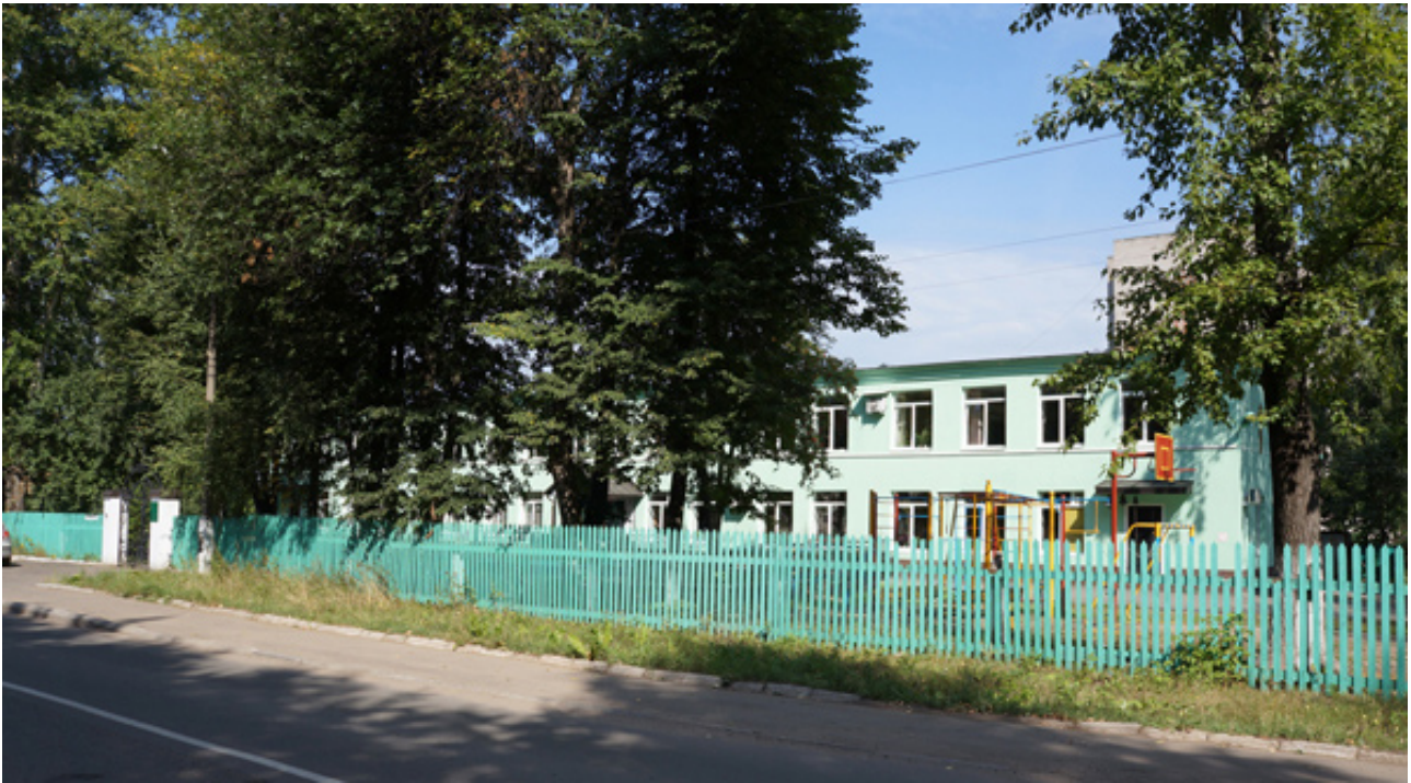
Рис. 3. Православная гимназия имени Преп. Сергия Радонежского.

подростков «Надежда» (45 чел), «Отделение сестринского ухода» для одиноких и инвалидов Сергиево-Посадского района (35 чел.), Сергиево-Посадская специальная (коррекционная) общеобразовательная школа № 7 (205 чел.), Православная гимназия-интернат «Воскресение» (г. Верея Московской обл.). Силами студентов и выпускников Московской Духовной академии на территории Сергиево-Посадского детского дома слепоглухих был создан храм (он имеет статус подворья Лавры), в котором регулярно проводятся богослужения, с детьми проводится социально-адаптационная и катехизаторская работа. Фонд собирает средства для строительства храма в Хотьковской школе-интернате. Троице-Сергиева Лавра является учредителем школы-интерната для мальчиков имени Преподобного Сергия, расположенной в д. Торопово в 20 км от монастыря. На территории комплекса находятся 16 жилых и учебных корпусов и храм. В школе-интернате воспитываются дети-сироты и дети, оставшиеся без попечения родителей, им прививаются основы православия. Воспитанники школы-интерната получают дошкольное и среднее образование, помимо этого в школе работают различные кружки и мастерские [6].