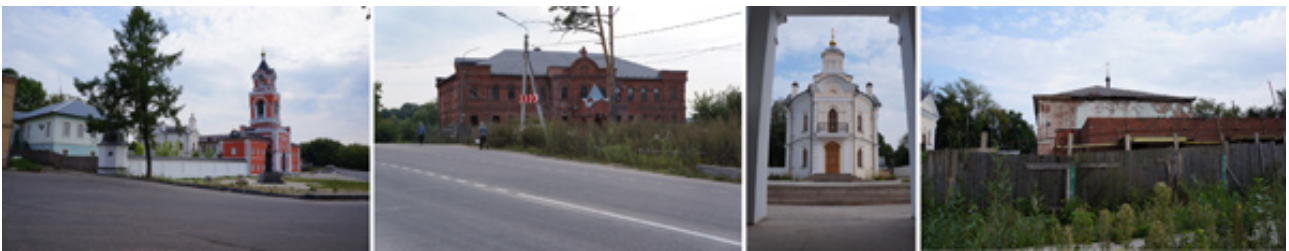
а) б) в) г) Рис. 7. Спасо-Вифанский монастырь. 2013: а) ворота и надвратная колокольня, б) гостиница, в) церковь Преображения Господня, г) храм Сошествия Святого Духа

Территорию бывшего Гефсиманского скита занимает Центральный физико-технический институт МО РФ, большая часть дореволюционных построек снесена. В 1998 году часть построек Спасо-Вифанского монастыря (рис.7) передана РПЦ, с 2002 года числится как подворье Троице-Сергиевой Лавры; с 2007 года там ведутся восстановительные работы: полностью воссоздана Церковь Преображения Господня (снесена в 1951 г.), ограда и надвратная колокольня (разобрана в 1930-х гг.), отреставрирован казначейский корпус, монастырская гостиница. В настоящее время ремонтно-восстановительные работы в Вифанском монастыре приостановлены (здания бывшей семинарии и собор Сошествия Святого Духа в ужасном состоянии), основные силы сосредоточены на реставрации комплекса Лавры (рис. 8).