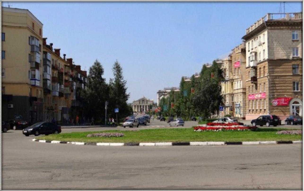
Рис. 7. Вид на Театральную площадь с перекрестка пр. Строителей и Мира.

значительность проспекта Строителей в композиции города.