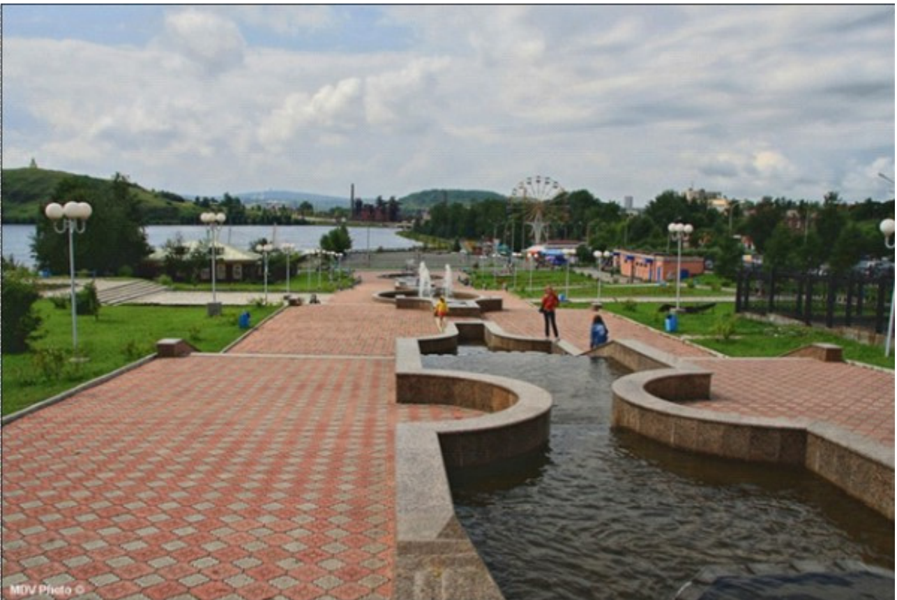
Рис. 8. Спуск к Набережной Нижнетагильского пруда.

В 1940–1950-е годы вследствие активного развития промышленности Нижний Тагил