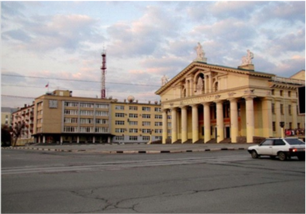
Рис. 2. Вид Театральной площади в сторону здания администрации Нижнего Тагила.

собирались жители в праздничные дни. Все это вместе послужило функциональной основой, определившей характерные черты застройки центра поселения и размещения важнейших административных сооружений вокруг главной площади Нижнего Тагила.