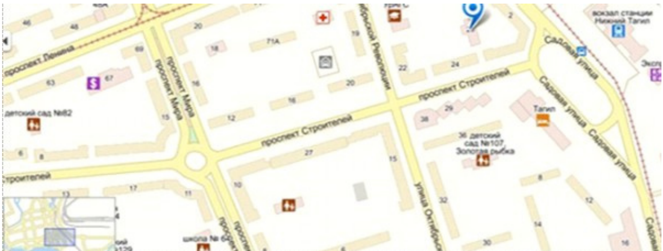
Рис. 6. Нижний Тагил. План перекрестка проспектов Строителей и Мира

Восточная сторона Театральной площади ограничена проспектами Ленина и Строителей. Их угловые объемы спарены: пр. Ленина, 57 и 57/2 с пр. Строителей, 2. Они выделяются архитектурой фасадов: по сторонам, обращенным к Театральной площади, здания имеют своеобразные выступающие объемы – ризалиты. Здание на пр. Строителей, 1 и 1а имеет такие же ризалиты. Однако здание на пр. Ленина, 40, также обращенное к Театральной площади, имеет плоский торец без проемов и пластического оформления. Оно, имея протяженный объем вдоль пр. Ленина, «глухим» западным фасадом снижает свою роль в композиции площади, хотя позже его украсили цветным символическим изображением советского времени. Однако это изображение не поддерживает архитектурную пластику, заданную ризалитами западных фасадов зданий на проспектах Ленина и Строителей. Их выразительная пластика задает доминирующую тему архитектурных форм на восточной стороне Театральной площади, придавая законченность ансамблю площади и усиливая