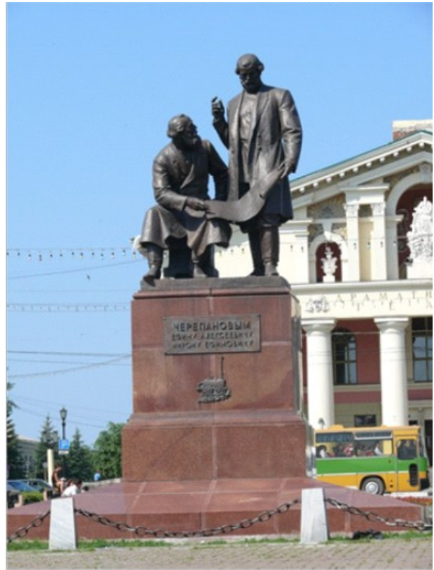
Рис. 4. Памятник изобретателям Черепановым. Скульптор А.С. Кондратьев, 1956.

Театральная площадь Нижнего Тагила как главная в городском пространстве закреплена в официальных документах города. На уникальность этой площади как художественного явления в России, указала Л. Е. Добрейцина [4]. Она подчеркнула, что Театральная площадь – редкое явление в архитектуре середины XX столетия, когда главные площади советских городов были связаны преимущественно с именами и образами вождя революции. Действительно,