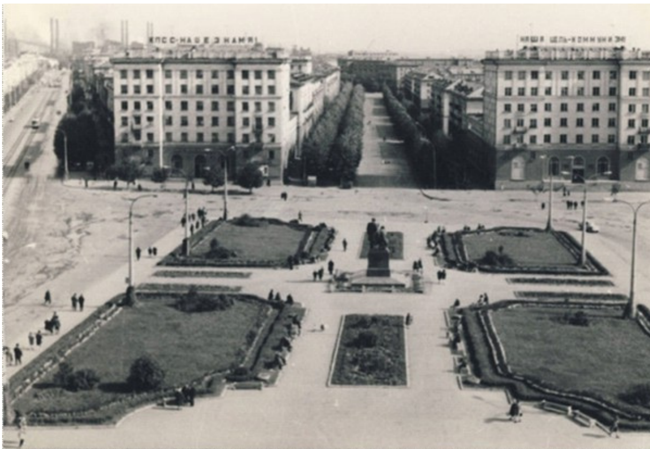
Рис. 3. Вид Театральной площади на пр. Ленина и пр. Строителей Нижнего Тагила с открытия 2-й пол. XX в.

архитектуры города, связанную с развитием конструктивизма. Вторая мировая война и послевоенные годы открыли новую страницу в истории городской архитектуры. На протяжении второй половины XX столетия проходило формирование нового главного центра Нижнего Тагила как архитектурного ансамбля, названного Театральной площадью. Как показала А. Шемякина, окончательное решение проекта застройки центральной площади города было принято в 1954 году, но в ходе реализации в него были внесены изменения [2].