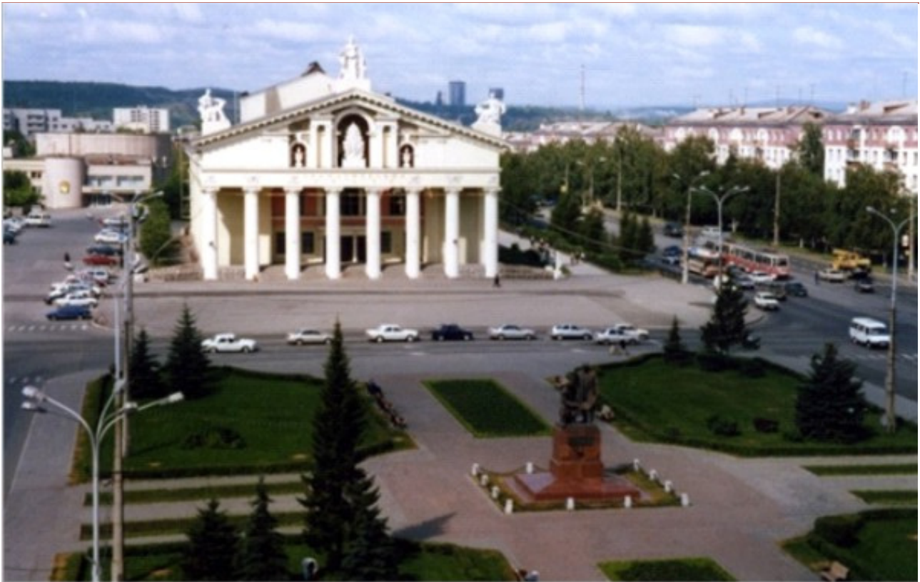
Рис. 9. Вид на Театральную площадь Нижнего Тагила с востока.

становится богатым и благоустроенным городом. Велось масштабное строительство, в процессе которого новые каменные дома сменили застройку прошлого. Объемно-пространственные композиционные акценты выявили широкие прямые улицы и проспекты (Ленина, Строителей, Мира и др.). Вместе с ними вблизи главной площади появились новые сооружения. В результате градостроительная структура центральной части Нижнего Тагила сместилась на восток, новое окружение центральной площади постепенно менялось.