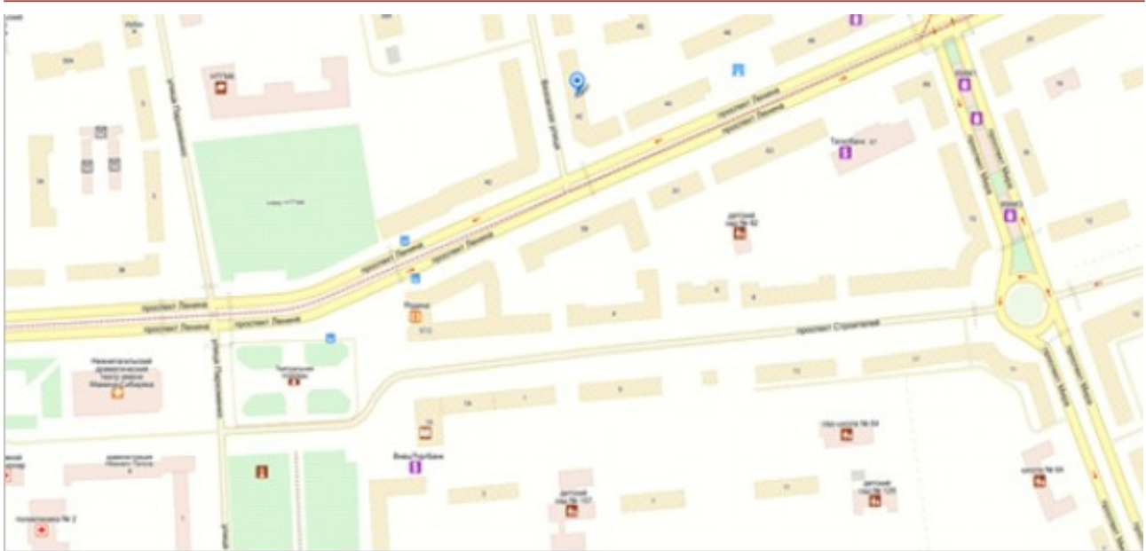
Рис. 1. Фрагмент карты Нижнего Тагила. Театральная площадь

дорогой, за которой в XX веке разместился Нижнетагильский металлургический комбинат (НТМК).