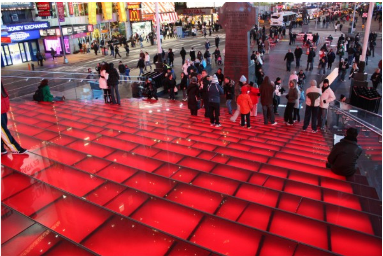
Рис. 7. Лестница в «никуда» на Таймс-сквер, Нью-Йорк, США. Мобильный элемент городского оборудования является одновременно и временной сценой, и источником освещения, и городской скульптурой – объектом современного искусства.

полноценного общения и социальных взаимодействий в пределах «психологической зоны комфорта» в сознании человека (рис. 6).