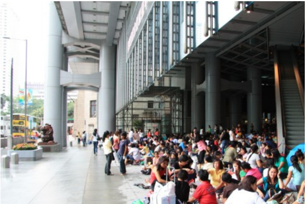
Рис. 3. Филиппинские домохозяйки в Гонконге в воскресный день занимают большинство «малых» публичных пространств города (скверы, террасы общественных зданий) и проводят время за трапезой и общением.

Таким образом, имеются некоторые статические характеристики пространства – свойства комфорта пребывания в нем (например, геометрия и ее влияние на масштабность; пластика и образные характеристики «оболочки» пространства), и есть социально динамические характеристики, зависящие как от популяции, социальных условий, так и от физического и эстетического изменения качества пространства. При