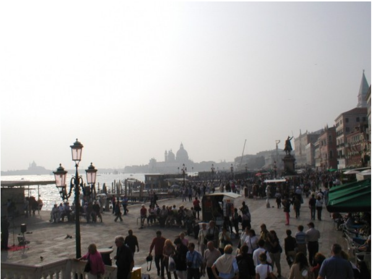
Рис. 10. Набережная в Венеции. Лагуна в Венеции – транспортная магистраль, и вода связывает все публичные пространства в единую систему, выстраивая также «воздушную» перспективу пейзажа.

разными социальными группами и отдельными людьми. Чем больше возможностей реализации различных стратегий поведения – от «самоизоляции» до максимальной включенности в социальные взаимодействия предлагает пространство, тем большим потенциалом развития оно обладает.