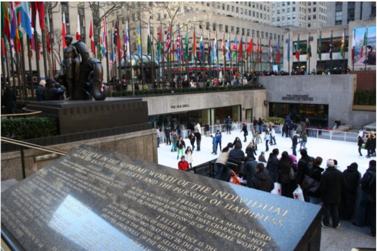
Рис. 8. Рокфеллер плаза в Нью Йорке, США. Рождественский общественный каток перед зданием Рокфеллер-центра. Зрителей вокруг не меньше, чем катящихся. Одно из самых популярных мест в зимнем Манхэттене.