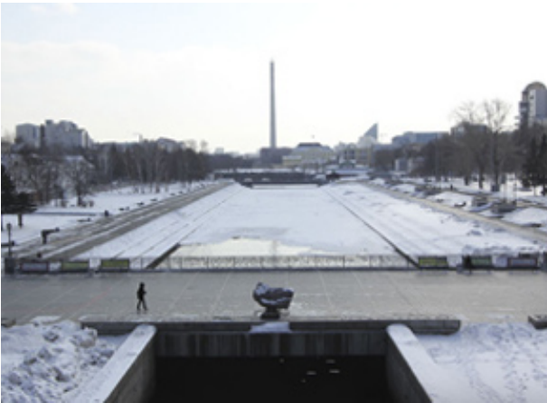
а – Исторический сквер зимой.