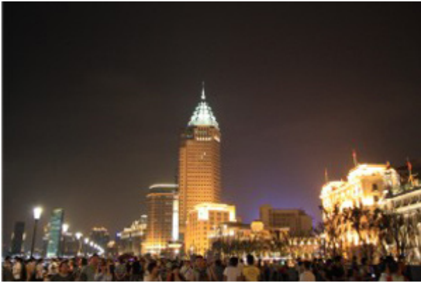
а – Набережная центра Шанхая, КНР.