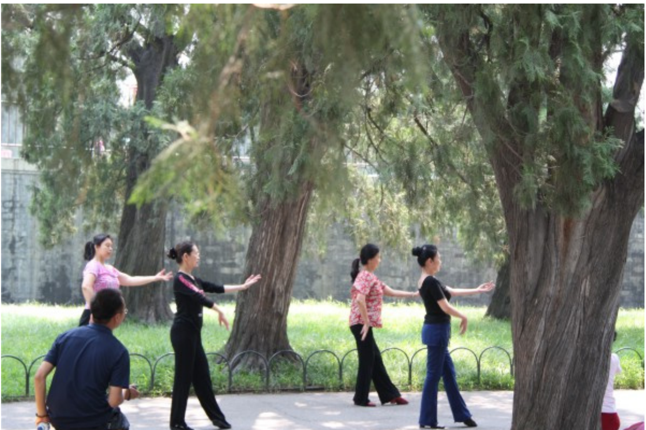
Рис. 9. Парк комплекса Императорского дворца в Пекине. Местные жители на отдыхе.