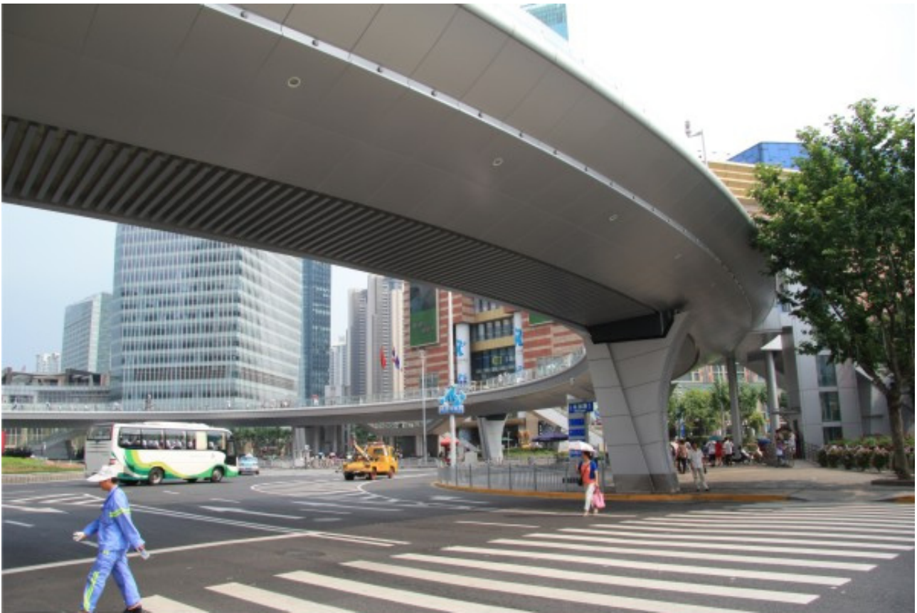
Рис. 5. Пешеходный переход над транспортной магистралью, Шанхай, КНР. Пешеходное кольцо в сверхплотном деловом центре рядом с телебашней стало не только утилитарным объектом, но и местом паломничества туристов.

Так, для определения необходимых интервенций в общественное пространство города наряду с изучением морфологии существующей городской ткани, ее функциональных, конструктивных и эстетических критериев, необходимо подробно фиксировать саму городскую жизнь, социальные процессы в неотрывном контакте с архитектурной оболочкой.