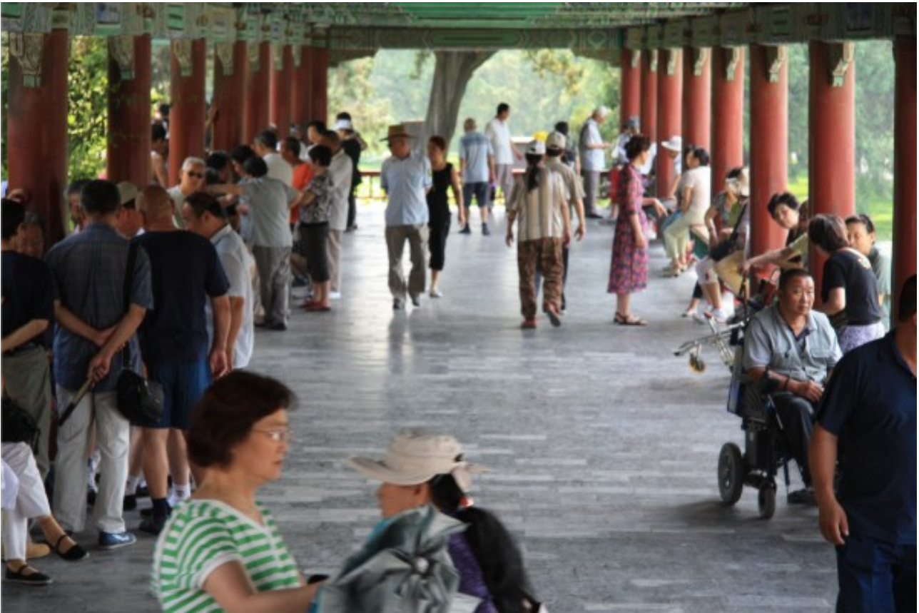
Рис. 1. Парк комплекса Императорского дворца в Пекине. Пешеходная галерея в воскресный день.

В то же время можно сказать, что не существует неких абстрактных качеств метрики пространства, не связанных одновременно с эпохой, типом, функцией. Для выяснения вектора развития общественного пространства важнее определить общее направление развития потенциалов городских пространств и создавать связанные между собой пространства в ткани города с разным функциональным и эстетическим потенциалом (рис. 2). Гармонизация существующего городского общественного пространства возможна путем разработки форм, включенных в поведение городских «актеров» (участников «театра городской жизни»), что подразумевает не только разнообразие форм и типов пространств, но и их благоустройство в соответствии с запросами различных субкультур и городских сообществ.