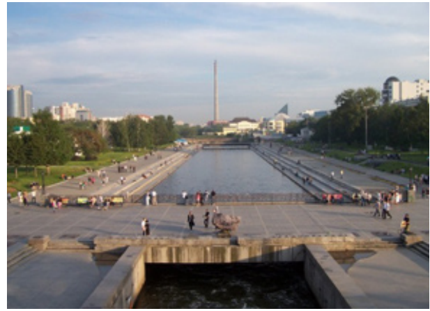
б – Исторический сквер летом.

Рис. 4. Екатеринбург в различное время года