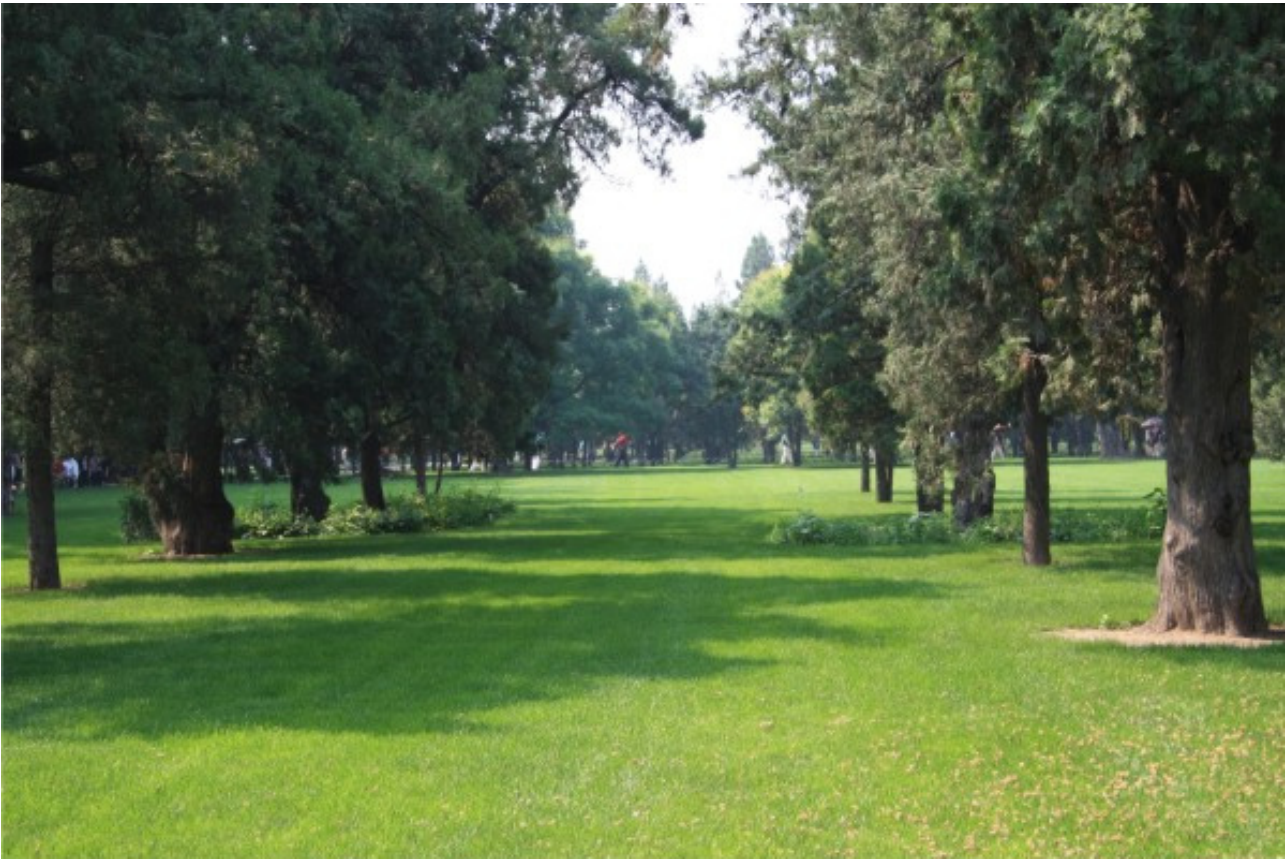
Рис. 6. Партер в парке Пекина, КНР. Идеальное травяное покрытие окружено аллеями, на которых идет активная социальная жизнь, поддерживаемая масштабами и умиротворяющим влиянием открытых пространств.

Но впоследствии сами «актеры» создают новые модели поведения в пространстве, т. е. перестраивают функциональное и типологическое значение данного пространства, меняют его значение в структуре города. Таким образом, на территории города и в его ткани появляются некие фокусные зоны – общественные пространства, привлекающие самое большое количество городских «актеров». Эти пространства составляют основной каркас социальной жизни города как в центральных районах, так и на периферии.