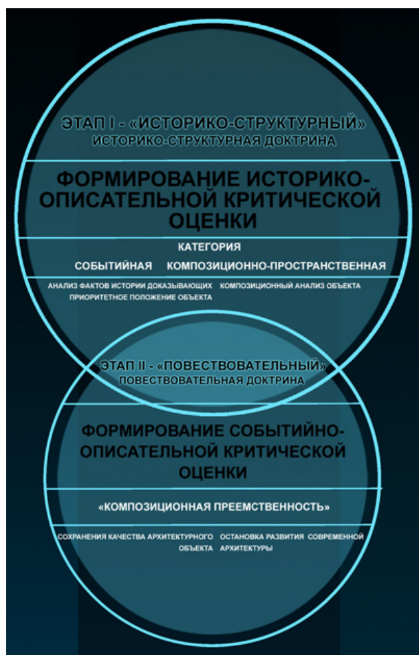
Схема 6. Графическая интерпретация метода доктринальной критики: историко-периодического подхода

и метод сравнительного анализа композиции архитектурных объектов предполагают поэтапное доказательное исследование и оценку степени включенности объекта в сложившуюся среду, каждый метод при этом использует индивидуальный инструментарий анализа. Так, историко-доктринальный подход использует: сравнительный анализ, графическое представление результатов исследования и словесное описание. В методе Ю.Н. Герасимова используются: сравнительный анализ и графическое представление основных результатов исследования.