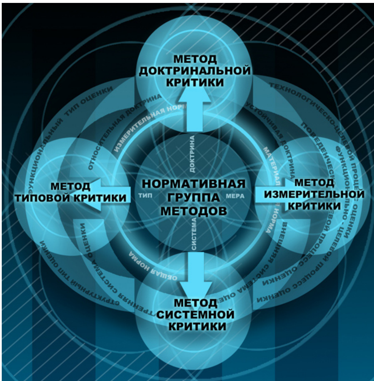
Схема 2. Графическая интерпретация нормативной группы методов: метод доктринальной критики, метод системной критики, метод измерительной критик, метод типовой критики

объективной оценки» [1], что говорит об условности, абстрактности прямого определения «доктрина» в рамках архитектурной критики. Подменяя суть понятия, У. Аттоэ утверждает, что доктрина в архитектурной критике есть «заявление общего неколичественного принципа» [1], откуда следует, что в рамках метода доктринальной критики доктрина – это основополагающий принцип, относительно которого формируется не только цель критического анализа, но и характер критической оценки.