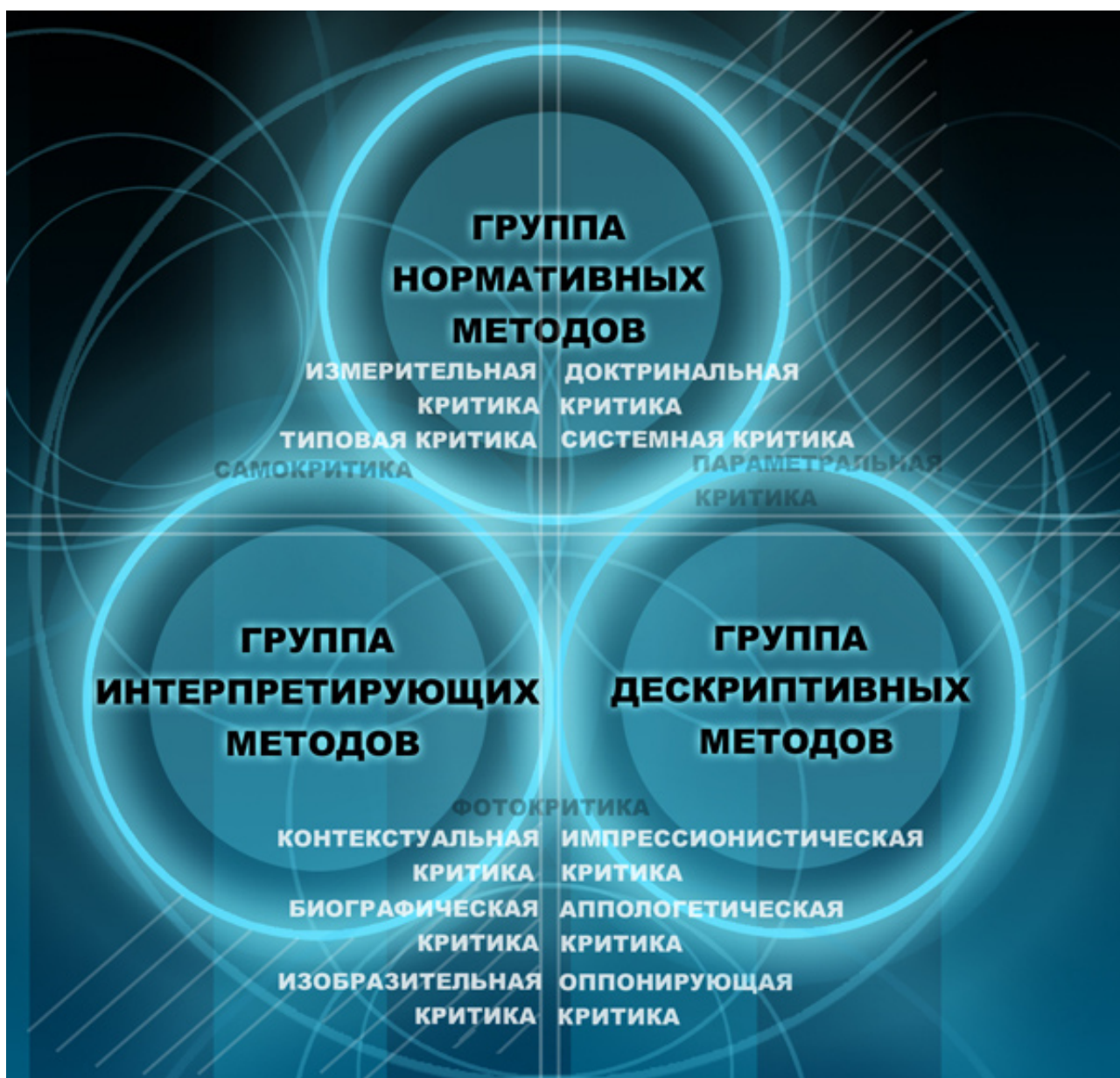
Схема 1. Графическая интерпретация трех основных групп методов архитектурной критики: группа нормативных методов, группа интерпретирующих методов, группа дескриптивных методов (по У. Аттоэ)

В ходе изучения метода доктринальной критики неизбежно возникают вопросы относительно положения доктрины в архитектурной критике: что такое доктрина в архитектурной критике? Как доктрина может стать основанием для формирования критической оценки? Каков характер выносимых суждений в описанных условиях? Поиск ответов на сформулированные вопросы заставляет нас обратиться к прямому понятию «доктрина», которое звучит следующим образом: «Доктрина (лат. docere – учить, doctrina – учение) – авторитетное учение; совокупность принципов; система теоретических положений о какой-либо области явлений; система воззрений какого-либо ученого или мыслителя» [8]. В прямом понимании «доктрина» – это выявленное основание, факт, устойчивый ориентир в какой-либо области явлений. В отечественной архитектурной науке с понятием «доктрина» можно связать лишь устойчивые позиции из истории архитектуры, например идейные и эстетические идеалы, влияющие на формирование архитектуры эпох, которые фиксируют относительно устойчивое положение архитектуры в контексте времени.