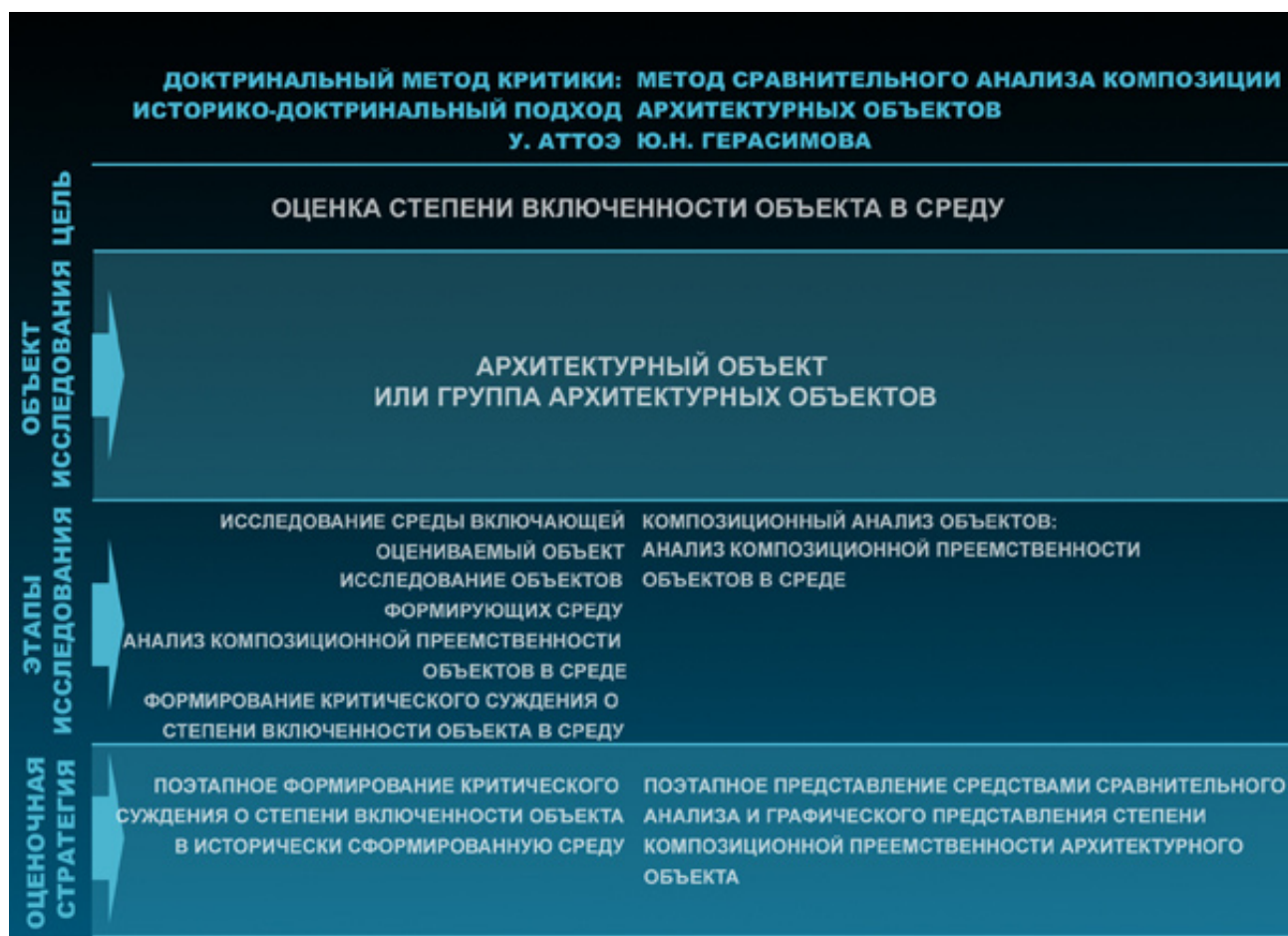
Схема 5. Сравнение метода доктринальной критики: историко-доктринального подхода (У. Аттоэ) с методом сравнительного анализа композиции архитектурных объектов (Ю.Н. Герасимова)

проектных решений в исторически сложившуюся среду.