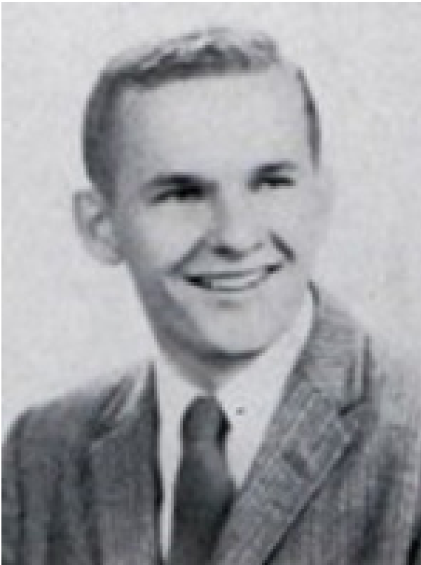
Уэйн Осборн Аттоэ.

критическое воображение» («Architecture and Critical Imagination», 1978), «Американская городская архитектура: Катализаторы в проектировании городов», («American Urban Architecture: Catalysts in the Design of Cities», 1990), «Горизонты понимания и формирование городских силуэтов» («Skylines Understanding and Molding Urban Silhouettes», 1981).