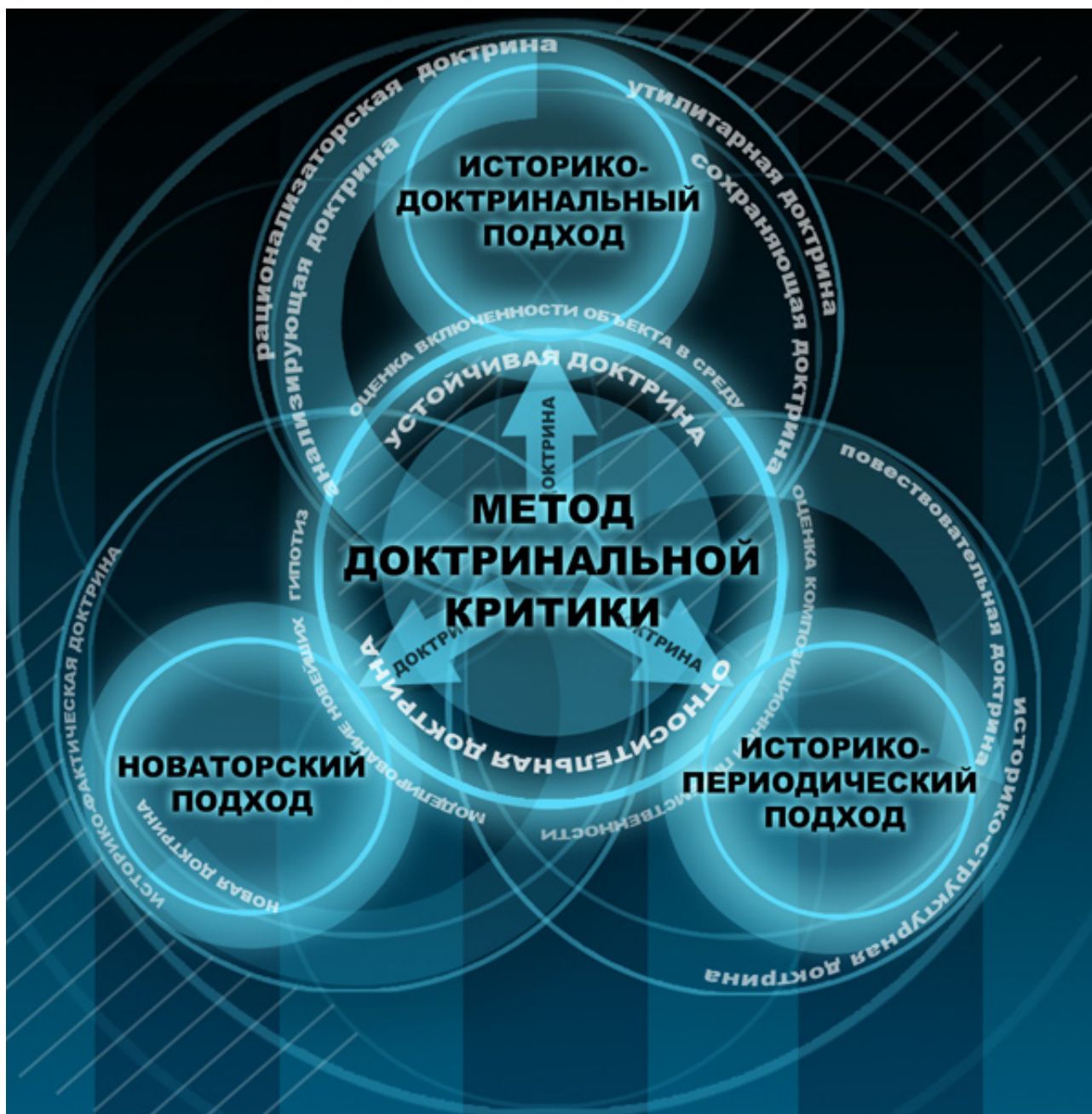
Схема 3. Графическая интерпретация метода доктринальной критики: историко-доктринальный подход, историко-периодический подход, новаторский подход