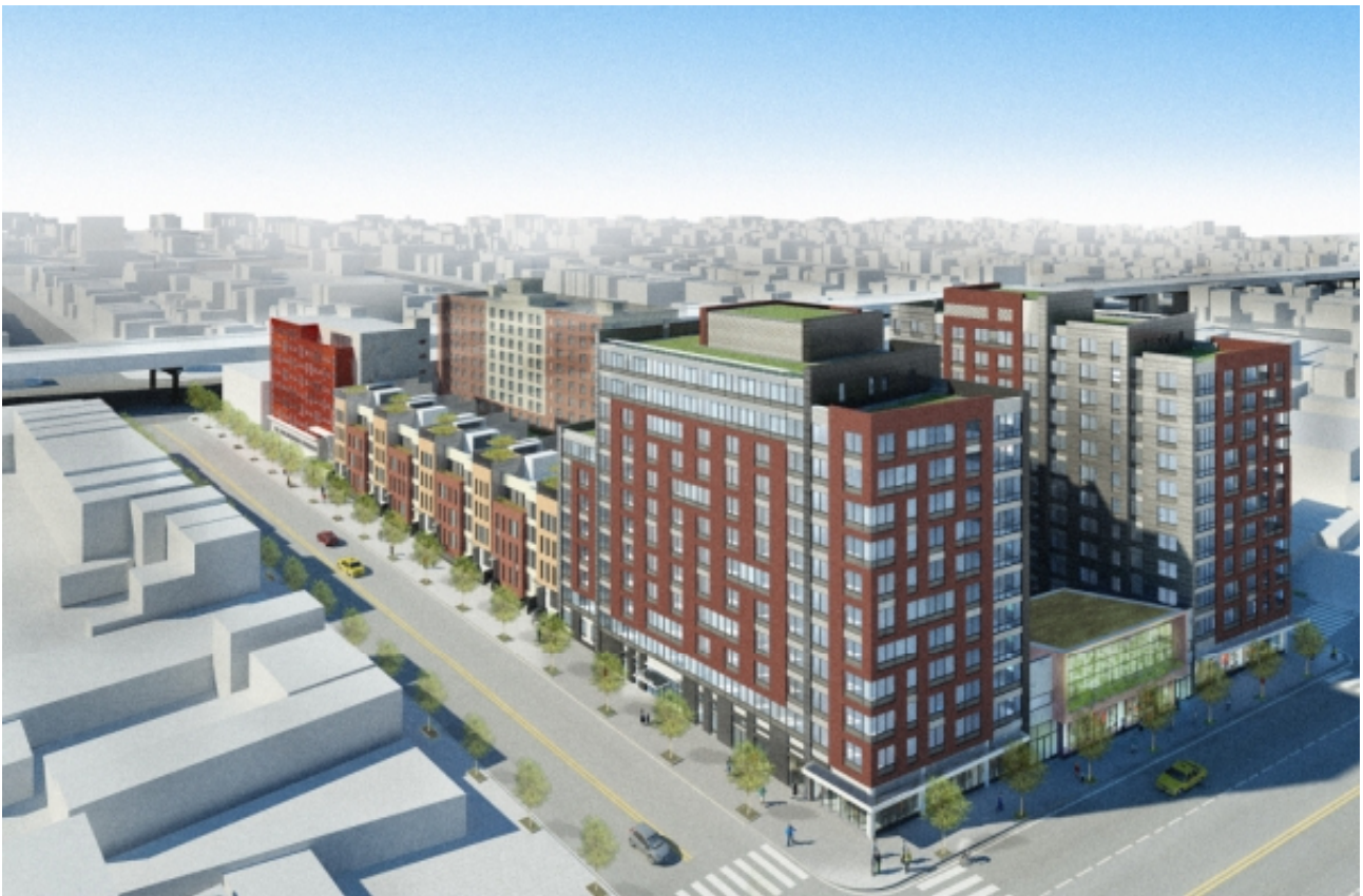
Рис.1а. Социально-интегрированный квартал Navy Green, Нью-Йорк, 2012.