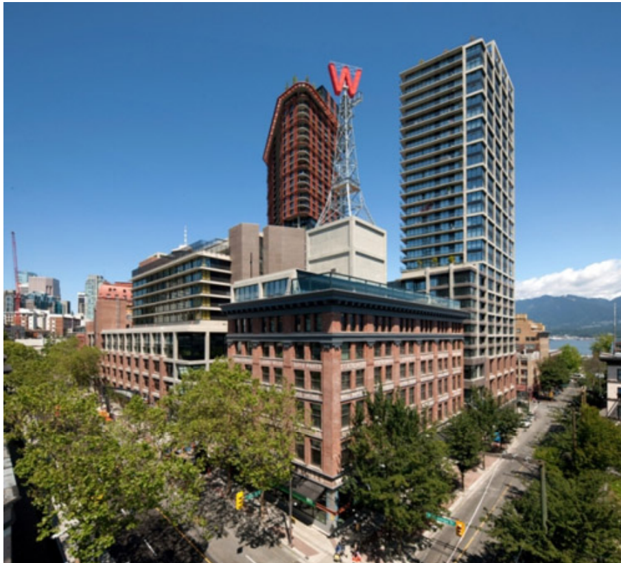
Рис. 2а. Социально-интегрированный комплекс Woodward's, Ванкувер, 2010.