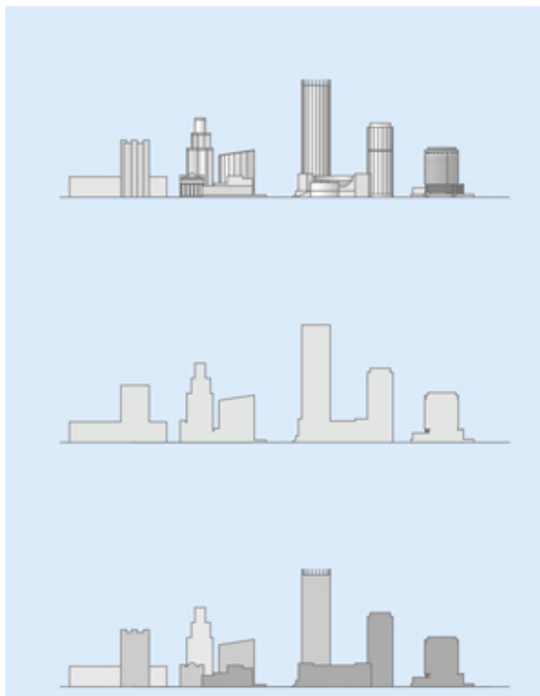
Рис. 4. Анализ силуэта существующего положения Екатеринбург-Сити