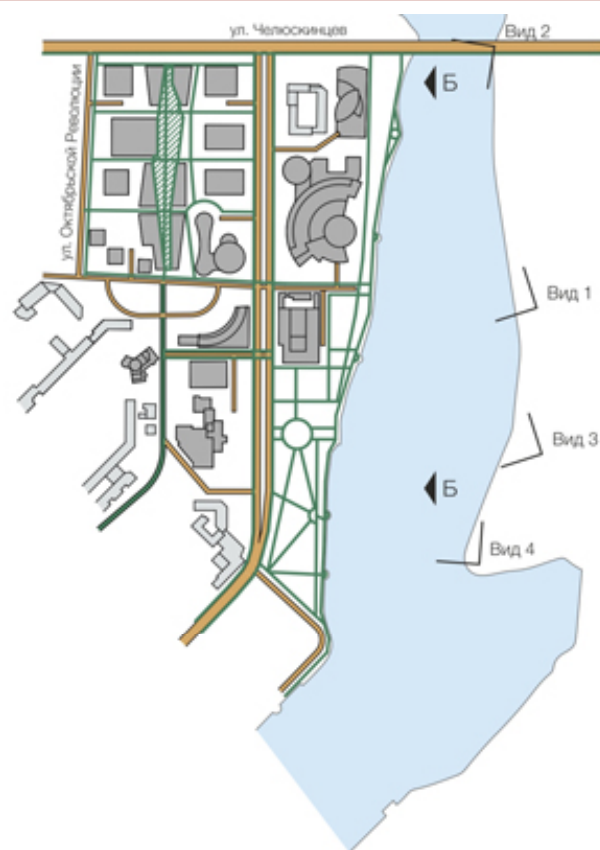
Рис.3. Градостроительный анализ проектного предложения Екатеринбург-Сити

комплекса осуществляется через улицу Б. Ельцина. Пешеходы же могут попасть на его территорию с той же улицы, либо с западной набережной городского пруда. За счет того, что «Президент» стоит на стилобате, у прохожих, прогуливающих по набережной, не возникает желания пройти на территорию бизнес-центра. Это, в свою очередь, создает более комфортные условия для арендаторов.