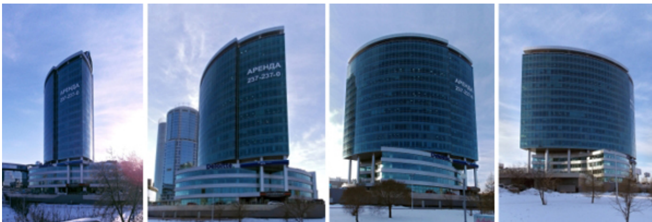
Рис.7. Бизнес-центр «Президент», Екатеринбург.

Сити в Европе и в мире. Однако проблема с большой загруженностью улицы Б. Ельцина в проекте пока остается нерешенной и, вероятно, может усугубиться в будущем, если не будут приняты соответствующие меры. Что касается бизнес-центра «Президент», то его роль «приглашающего объекта» останется за ним и даже усилится. Занимаемое им положение «на отшибе» будет выгодно тем, что он, оставаясь частью комплекса, займет свой «тихий уголок» вдали от прогуливающих горожан и туристов. Это сохранит комфортные условия для арендаторов офисов в бизнес-центре.