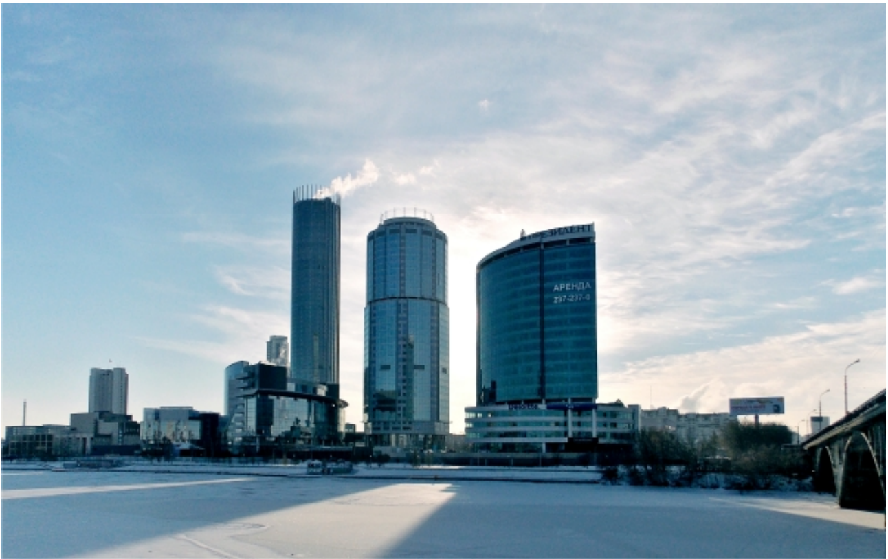
Рис. 6. Екатеринбург-Сити, вид с ул. Челюскинцев.

На ряде видовых кадров (рис. 7) становится видно, что вся красота БЦ «Президент» раскрывается именно в движении по западной набережной. Однако, несмотря на «приглашающий» характер бизнес-центра, он производит впечатление композиционной оторванности от остальных объектов комплекса. Тем не менее, когда за «Президентом» появится множество высотных зданий, которые послужат фоном для него, бизнес-центр перестанет восприниматься одиноким, а его композиционная «встречающая» функция усилится, благодаря близкому расположению высотных объектов, трудно воспринимающихся с близкого расстояния.