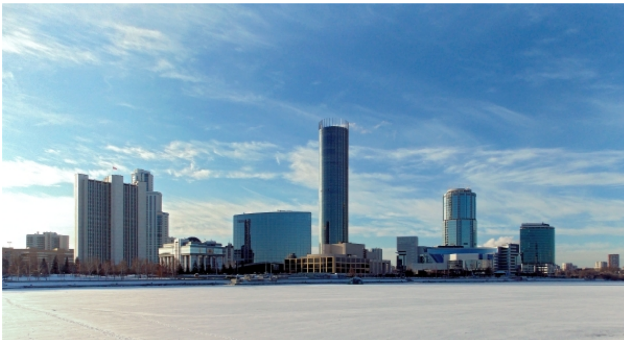
Рис.1. «Екатеринбург-Сити».

ответы на вопросы: какая роль досталась данному объекту в комплексе, в чем особенности его архитектурно-композиционного решения, а также какое будущее может ждать «Екатеринбург-Сити» и БЦ «Президент»?