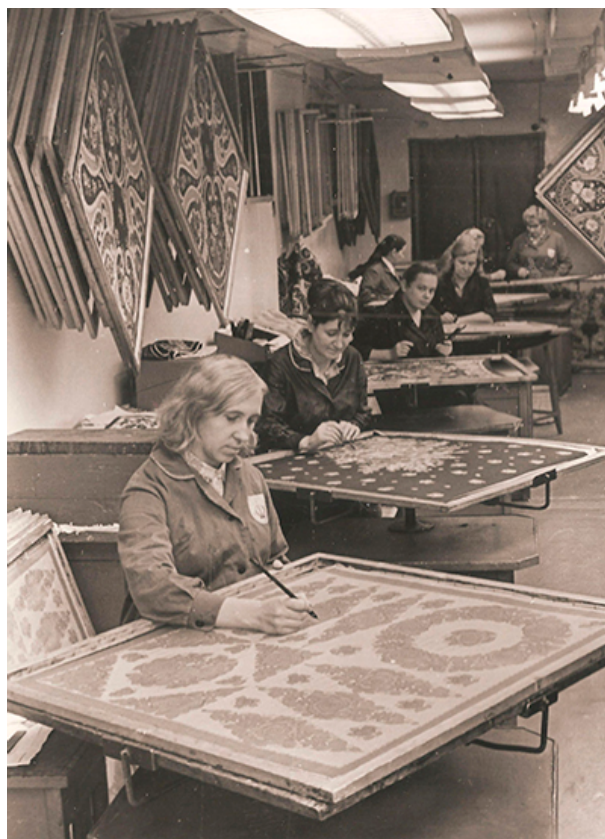
Рис. 7. Ленинградское производственное объединение «Новость», 1973 г. Участок художественной росписи тканей

Техника фотофильмпечати была не единственным возможным способом производства. На фабрике уже в 1960-х гг. часть ассортимента все еще производилась вручную или комбинированным способом (в таком случае линейный рисунок по заранее утвержденному шаблону наносился способом печати, а заливка цветом осуществлялась вручную) (рис. 5). Оценить, насколько широко применялась работа разрисовщиков, мы можем благодаря архивным материалам, запечатлевшим «участки разрисовки тканей». В одном помещении могли работать от пяти до десяти человек, при этом все работали над изделиями с