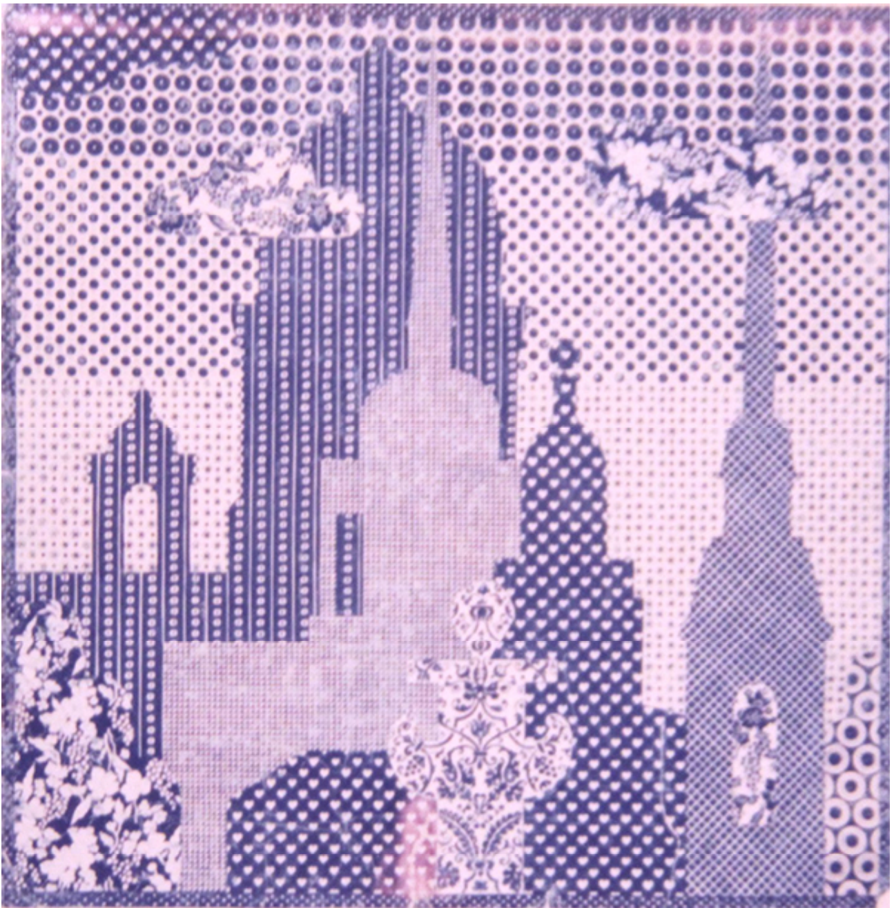
Рис. 2. Проект платка «Ситцевый Петербург». Автор Ф. Лейбович. Ленинградское производственное объединение «Новость», 1970-е гг.

Техника художественной росписи являлась одной из самых распространенных в производстве сувениров, она занимала третью часть общего объема выпуска изделий народных художественных промыслов. Широкое распространение художественной росписи можно объяснить гибкостью этого производства, возможностью быстро менять тематическую линию и орнаментальный строй изделий (рис. 1).