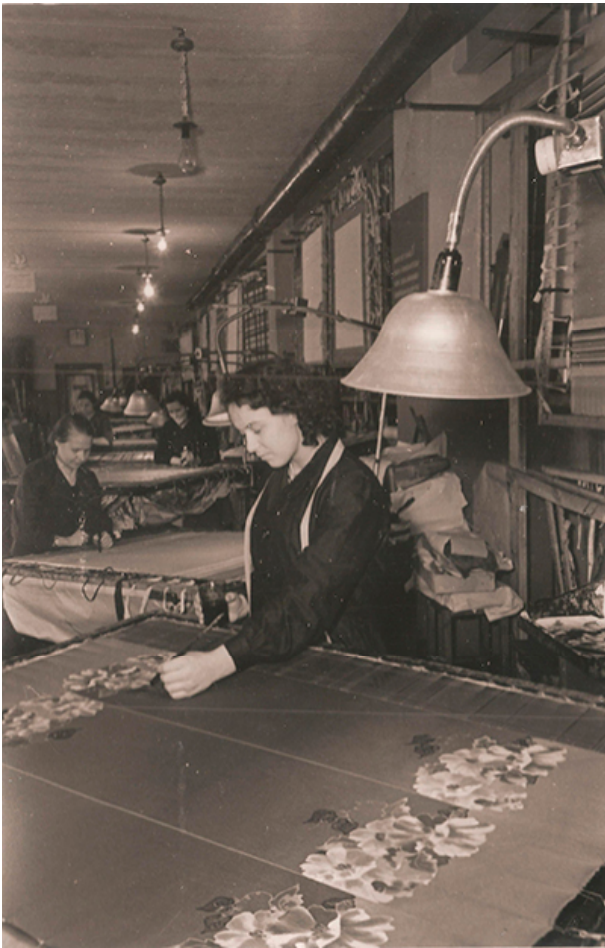
Рис. 8. Участок разрисовки тканей. Фабрика художественной росписи тканей управления местной промышленности. Ленинград, 1958.