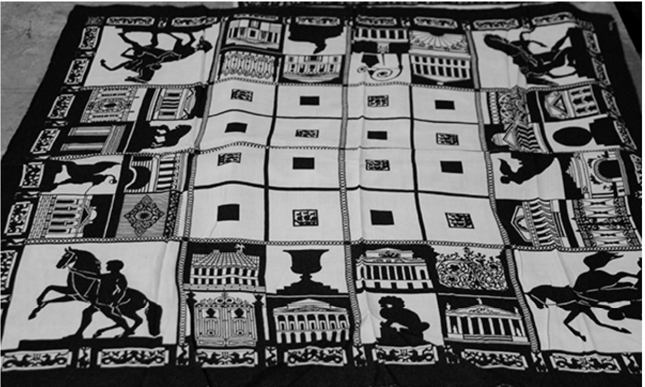
Рис. 3. Платок с символикой Санкт-Петербурга. Автор проекта Ю. Сиротина. Ленинградское производственное объединение «Новость», 1970-е гг.