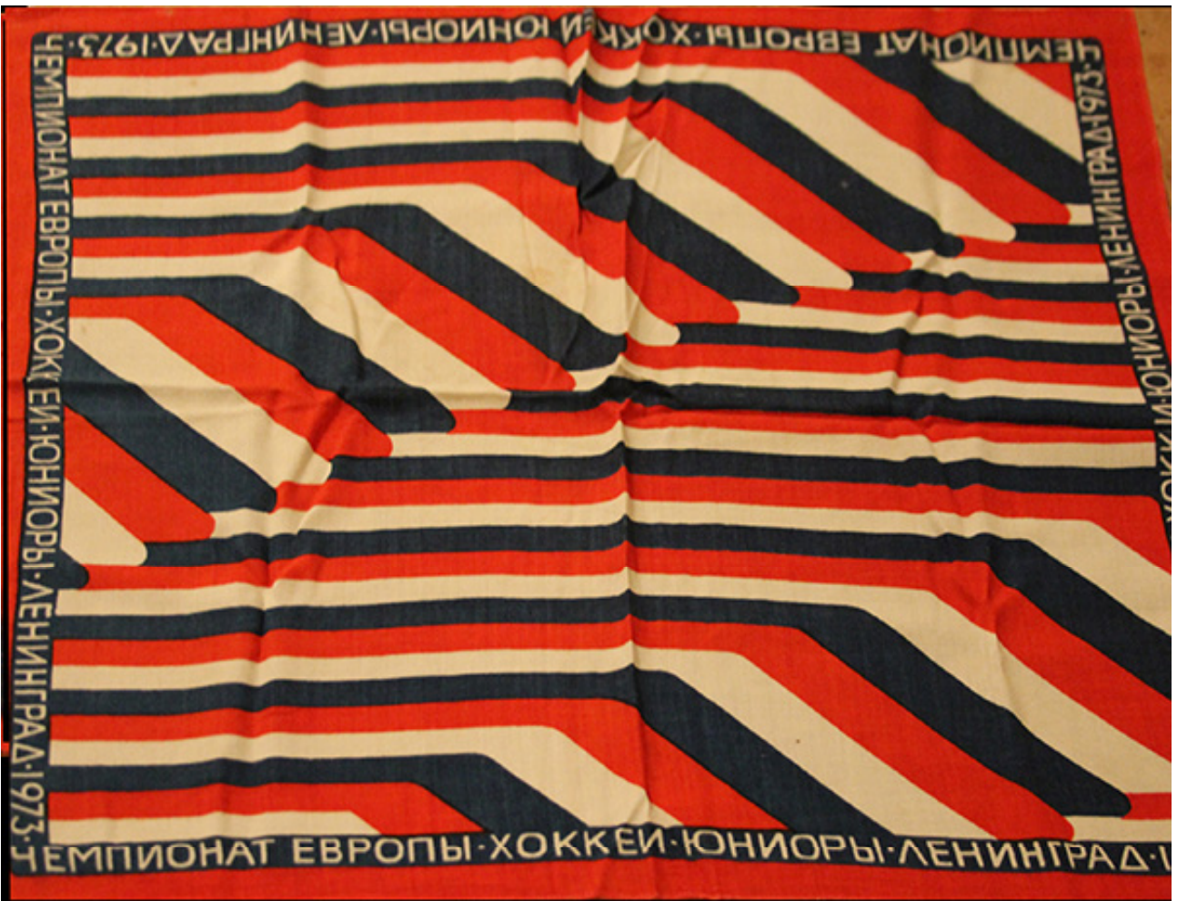
Рис. 4. Сувенирный платок. Автор проекта Ф. И. Лейбович. Ленинградское производственное объединение «Новость», 1973 г.