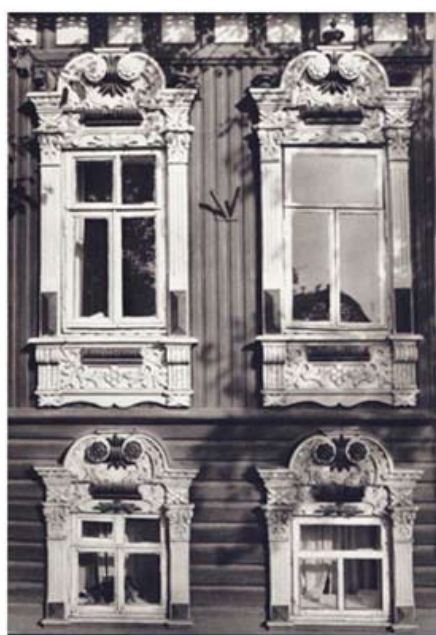
Рис. 10. Наличники жилого дома в г. Тюмени.

Исследуя развитие орнамента, в том числе стилей и направлений в деревянном зодчестве XVII – начала XX в., можно прийти к некоторым выводам, разделив развитие направлений на этапы. Первоначальный этап – крестьянская архитектура с древнерусским, дохристианским орнаментом (до середины XVIII в.) Одновременно, начиная с XVIII в., на деревянную архитектуру Сибири начинает влиять стиль барокко. Со второй половины XVIII в., с введением «типового» и «повторного» строительства наравне с каменной архитектурой происходит развитие классических форм, которые связаны с конструктивными особенностями зданий этого периода, что видно по этажности, оконным проемам, строгости фасадов и простоты наличников.