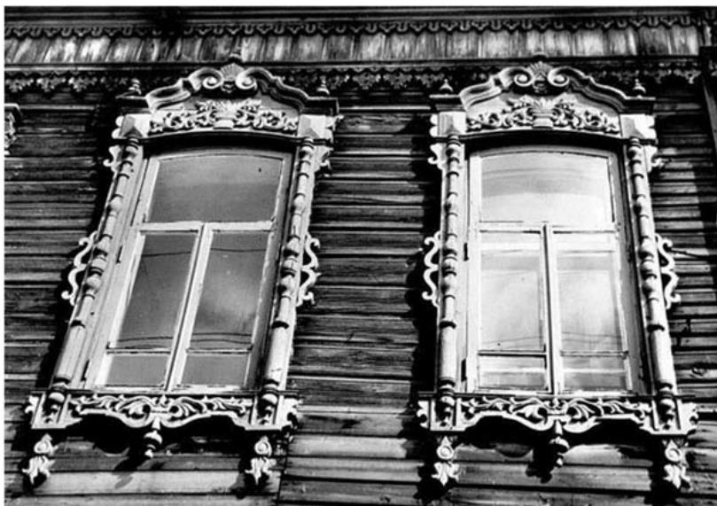
Рис. 14. Фрагмент второго этажа дома на ул. Октябрьской (Воскресенской), 60. Томск, сер. XIX в. 1975

культурного типа, оно в своем стадийном развитии претерпело радикальные изменения. Крестьянское зодчество средневекового типа как целостное жизнеспособное явление ушло в прошлое. Цикл его развития закончился. Стадийно народная архитектура деревни стала вровень с уровнем стилиевой архитектуры...» [3, с. 15].