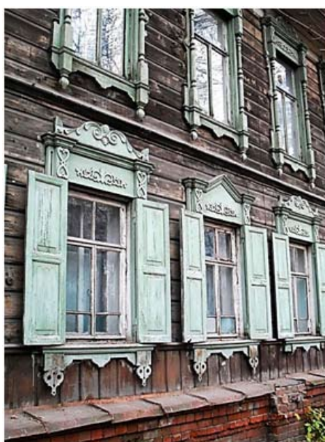
Рис. 11. Дом на пр. Кирова (ул. Бульварной), 33. Томск, 2-я пол. XIX в. 200