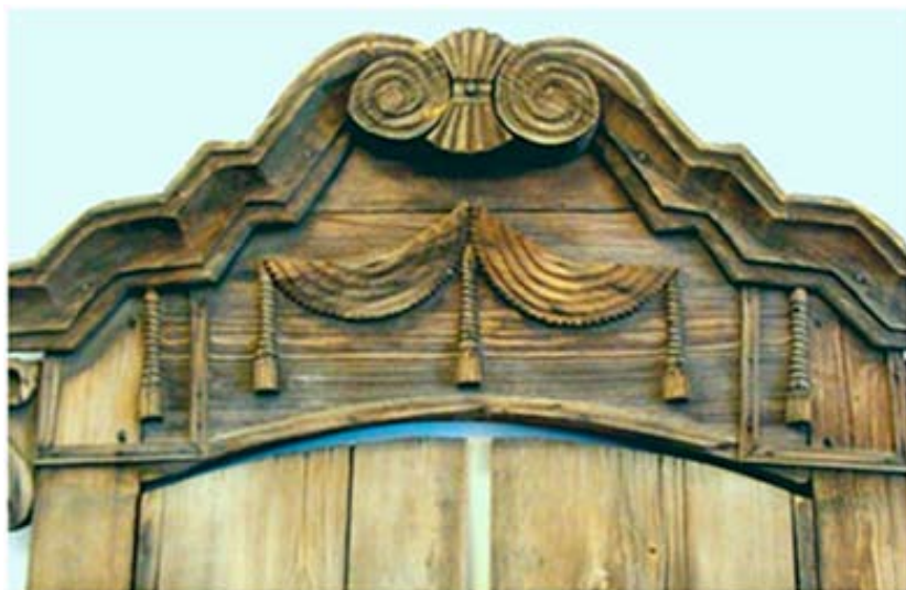
Рис. 12. Томская область. Фрагмент наличника середины XIX в. Музей деревянного зодчества. Фото автора. 2008

В это время появляются и некоторые элементы орнамента, в большей степени связанные с народными традициями. Деревянные дома в этот период подвержены стилистическому влиянию как барокко, так и классицизма. «В провинциальной архитектуре до середины XVIII в. барочные аппликативные наличники обычно накладываются на безупречную поверхность стены. Во второй половине XVIII столетия классицизм часто теснила привычка к барочным формам, которые не были неразрывно связаны со свойственным барокко пластическим единством стены и декора, ... классицизм был скромнее в декоративных формах, возмещая сдержанность глубоко продуманным пропорциональным членением стены на уступы плоскостей, незначительно приподнимающихся одна над другой. Этот прием, пришедший в зодчество русской провинции в эпоху классицизма, продлил жизнь барочным формам...» [5, с. 121]. В орнаменте деревянных домов в городах Сибири чаще всего встречается именно это сочетание. Барочные формы наличников повсеместно применялись в строительстве как городских, так и сельских зданий (рис. 12–13).