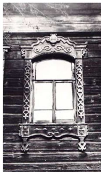
Рис. 3. Наличник дома на ул. Источной, 26. Томск, 1-я пол. XIX в. 1996