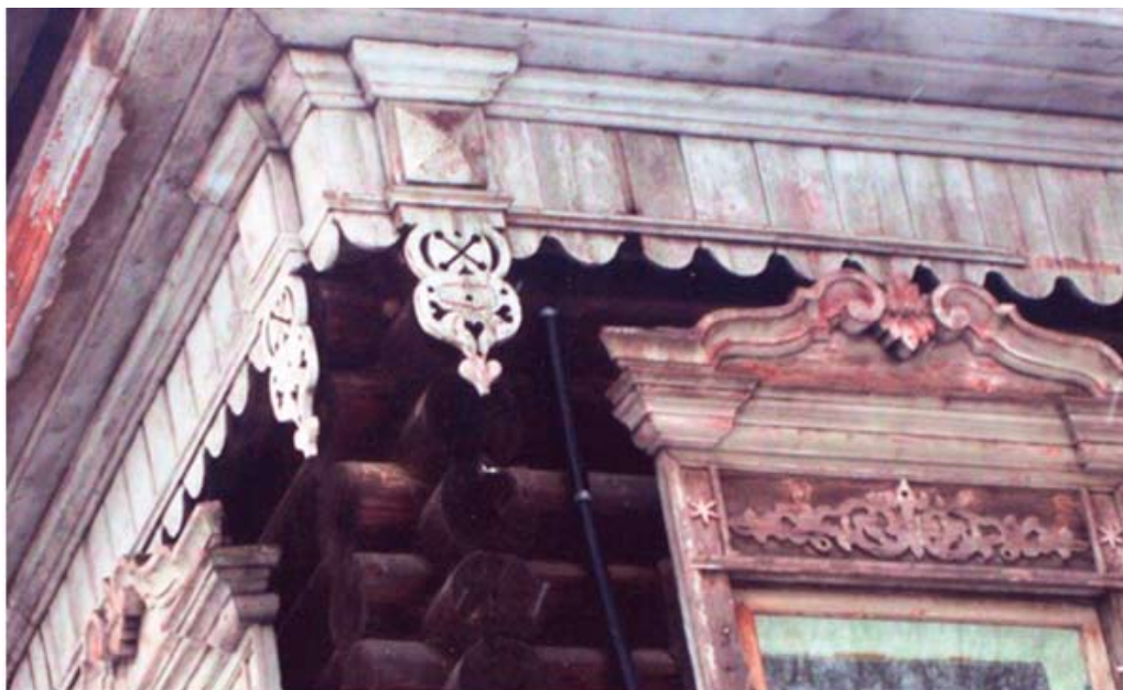
Рис. 7. Декоративные элементы жилого дома на ул. Загорной. Томск, 2-я пол. XIX в. Сочетание барокко с русским орнаментом. В тимпане надоконной доски – орнамент «переплут». 2008

Народные традиции в зодчестве Сибири шли от переселенцев из Устюга, Вологды, Вятки и других городов Русского Севера и Центральной России. В мотивах деревянной резьбы с конца XVIII в. происходит слияние народной и «стилевой» архитектуры. Одновременно появляется новый вид обработки дерева – «пропильная резьба» (рис. 5–7). Дома украшались резными наличниками, тимпаны фронтонов – солярными знаками и т. д. Сочетание народного орнамента с барочными формами можно наблюдать на сохранившихся домах по ул. Октябрьской (Воскресенской) в Томске. Продолжается слияние народной и стилевой архитектуры, усложняются формы орнаментики наличников деревянных домов, волютные завершения которых получили самые многообразные формы во всех регионах Сибири (рис. 8–17). Эти процессы можно проследить по трудам исследователей деревянной архитектуры Е.И. Кириченко, Н.А. Шайхтдиновой, В.Г. Черепанова, Т.М. Степанской, Ю.И. Шепелева, Э.И. Дрейзина и др.