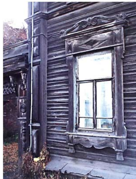
Рис. 15. Наличник жилого дома на ул. Татарской, 1. Томск, 2-я пол. XIX в. 2008

Развитие барочных форм в деревянной архитектуре хорошо просматривается в деревянных доходных и купеческих домах Томска. Купеческий полукаменный дом на ул. Беленца, 3 (пер. Подгорный) (рис. 16), вероятно, был построен в первой половине или в середине XIX в. Датировка затруднена из-за отсутствия архивных документов, поэтому мы можем судить о времени постройки только в сравнении с другими домами. Почти такой же орнамент мы видим на фасаде купеческого дома в пер. Плеханова (пер. Монастырский) и на ул. Бакунина (ул. Ефремовской).