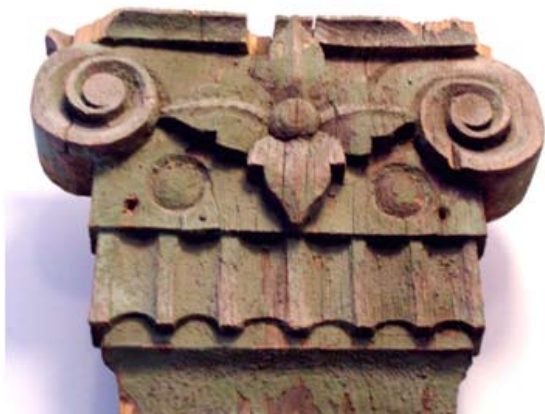
Рис. 9. Фрагмент пилястры, ионическая капитель. Музей деревянного зодчества. Томск. середина XIX в.

Говоря о стилях в архитектуре, нельзя не сказать о таком направлении в каменном культовом зодчестве, как «сибирское барокко», предложенное в 1924 г. иркутским краеведом Д.А. Болдыревым-Казариным. Несомненно, барочные волютные формы – это влияние, прежде всего, западноевропейской архитектуры и архитектуры Санкт-Петербурга. Из истории деревянной архитектуры известно, что волютные наличники повсеместно встречались у вепсов – малочисленного финно-угорского народа Карелии в Ленинградской области. Этот вид наличников можно проследить и в центральной России, в городах Московской, Новгородской областей, республики Татарстан, Урала.