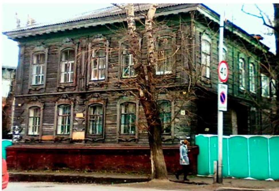
Рис. 8. Жилой дом на ул. Войкова, 25 (пер. Знаменский). Томск, 1-я пол. XIX в. 2008

Народные традиции в зодчестве Сибири шли от переселенцев из Устюга, Вологды, Вятки и других городов Русского Севера и Центральной России. В мотивах деревянной резьбы с конца XVIII в. происходит слияние народной и «стилевой» архитектуры. Одновременно появляется новый вид обработки дерева – «пропильная резьба» (рис. 5–7). Дома украшались резными наличниками, тимпаны фронтонов – солярными знаками и т. д. Сочетание народного орнамента с барочными формами можно наблюдать на сохранившихся домах по ул. Октябрьской (Воскресенской) в Томске. Продолжается слияние народной и стилевой архитектуры, усложняются формы орнаментики наличников деревянных домов, волютные завершения которых получили самые многообразные формы во всех регионах Сибири (рис. 8–17). Эти процессы можно проследить по трудам исследователей деревянной архитектуры Е.И. Кириченко, Н.А. Шайхтдиновой, В.Г. Черепанова, Т.М. Степанской, Ю.И. Шепелева, Э.И. Дрейзина и др.