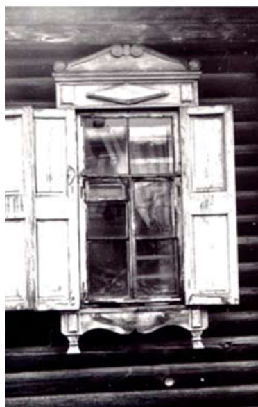
Рис. 2. Наличник дома на ул. Татарской, 5. Сочетание элементов барокко в навершии наличника с русским орнаментом «ромб» (символ «поле») в тимпане надоконной доски. Томск, 1-я пол. XIX в. 1996

Как уже отмечалось, в проектах деревянных домов практически не встречается рисунков и образцов деревянной резьбы. Однако именно орнаментальная пластика фасада определяла стиль того или иного здания. В то же время многообразие деревянной резьбы в сибирских жилых домах, сочетание народной орнаментики с классическими формами очень затрудняет ее классификацию. Временные границы стилей в русской и сибирской архитектуре определены более или менее четко. Известно, например, что термин «русское барокко» возник в конце XVII в. в рамках «нарышкинского стиля». Получив дальнейшее развитие в XVIII в., этот стиль оказал большое влияние не только на каменную, но и на деревянную архитектуру: «Несмотря на общерусскую тенденцию к упрощению барочных форм в третьей четверти XVIII в., кое-где (например, на северо-востоке Европейской части и в Сибири) причудливость наличников возрастает. В этот период по разным дорогам идут безордерная аппликативность, поддерживая народным искусством, и ордерность, которая лежит в основе набирающего силу классицизма...» [2, с. 122] (рис. 2, 3).