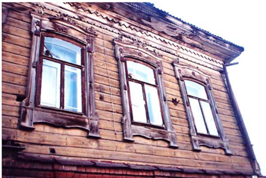
Рис. 16. Купеческий дом на ул. Беленца, 3. Томск, 1-я пол. XIX. 2008

терные для этого периода основные принципы строительства – это постановка сруба за 5–7 дней и декоративное украшение фасадов здания. В доме № 40 на улице Татарской в декоративном оформлении происходят отступления от прежних традиций, появляется растительный орнамент, который получил дальнейшее развитие в домах № 35 и 46 района Заисточья и № 10 и 14 на улице Шишкова (ул. Акимовская). С этого момента возникают первые признаки «второго фольклора» – деревянное узорочье, сыгравшее важную роль не только в формировании отдельного дома, но и всего облика города.