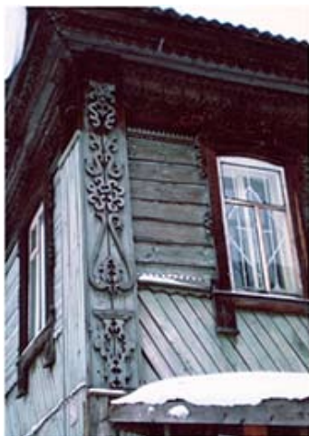
Рис. 5. Дом на ул. Загорной. Томск, 1-я пол. XIX в. 2008

Как известно, деревянное зодчество Сибири развивалось от крепостного (оборонительного) строительства, крестьянских изб и боярских усадеб XVII в. до жилищ усадебного типа XVIII в. Срубная конструкция оставалась неизменной. В орнаментике же, начиная со второй половины XVIII в., развитие шло по двум направлениям: первое – следование народным традициям в украшении жилищ, развитие народной деревянной резьбы, второе – использование в декорациях деревянного дома стилизованных элементов барокко и классицизма (рис. 4).