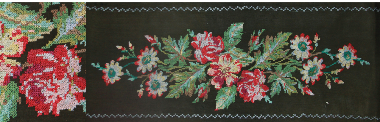
Рис. 2. Декоративная салфетка, хлопок. 1950-е гг. Частное собрание. Новгородская область, г. Старая Русса.

Советские рукодельницы использовали в своем творчестве ткань равномерного переплетения или специальным образом выработанное полотно – канву. Рисунок наносился с помощью иглы и цветных нитей, таких как мулине или других пригодных для вышивания, в том числе шерстяных. Стежки выполнялись в различных техниках: «двойной крест», «полный крест», «по-