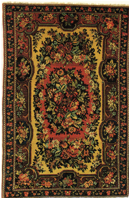
Рис. 3. Бахтиярский ковер Фарадомбе, антикварный экземпляр «обюссонского» ковра [3, с. 78]

Следует обратить внимание еще на один общепризнанный центр ковроткачества – Турцию. Со второй половины XIX в. на всей ее территории распространяется стиль «меджид». Для него