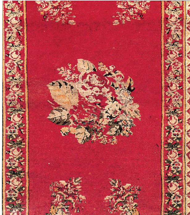
Рис. 4. Фрагмент ковра из Мегри с орнаментом в стиле меджид, начало XIX в. [3, с. 156]

характерно повсеместное употребление орнаментов с изображением букетов роз, расположенных на монохромном, обычно красном фоне ковра (рис. 4).