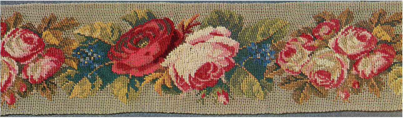
Рис. 1. Вышитая полоса. 1820–1830-е гг. [5, с. 148, ил. 133]

Следует обратить внимание на то, что во второй половине XIX в. традиционная крестьянская вышивка меняется под воздействием городской культуры. Происходит переход от двусторонних и односторонних швов к более быстрой и простой вышивке крестом. Этому во многом способствовало развитие торговли и текстильной промышленности, в результате которого появилось большое количество готовых тканей, ниток, а также печатных рисунков для вышивания крестом. Вышитые композиции отличались от традиционных более свободным размещением мотивов, заимствованием характерных сюжетов с изображением роз из городских орнаментов. Такие узоры встречаются в украшении элементов традиционного костюма, рушников, подзоров и др. [4, с. 56–57]