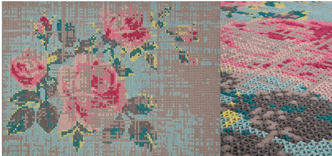
Рис. 7. Шарлотта Лансело. Ковер из коллекции «Canevas» 2012 г.

Рассматривая вопросы интерпретации традиционного искусства и ремесел в современном дизайне, можно отметить творчество художницы Шарлотты Лансело (Charlotte Lancelot). В представленной в 2012 г. коллекции предметов для интерьера «Canevas» (ковры, пуфы, подушки) мотив вышивки крестом с изображением соцветия розы использован в качестве декора войлочного ковра. Классический сюжет представлен в новом прочтении. Дизайнер использует различные текстуры и современные колористические решения. Основными чертами представленного изделия являются его декоративность, нарядность, эстетическая выразительность. Автор добивается необычного эффекта, в том числе за счет масштаба орнамента и его сочетания с окружающим фоном (рис 7).