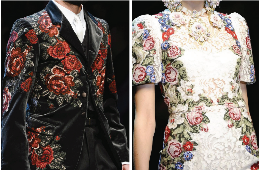
Рис. 5. Изделия из коллекций модного дома Dolce&Gabbana сезонов весна–лето 2015 и осень–зима 2012–2013.

Многие текстильные компании предлагают покупателям традиционные изделия в новой интерпретации. Среди них турецкая компания «Patchwork-Rug», создающая современные ковры, в том числе с мотивами вышитых и вытканых роз (рис. 6). Орнаментированные яркими цветами, такие текстильные изделия имеют не только художественно-эстетическую ценность, но и отражают интерес дизайнеров к традиционному декоративно-прикладному искусству. Ковры из коллекций данной компании, решенные контрастно, призваны служить ярким колористическим акцентом в интерьере, подчеркнуть его неповторимость.