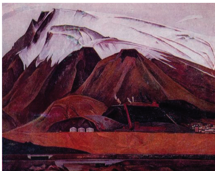
Рис. 3. «У горы Рудной» (1969)

зывает сложный и противоречивый процесс освоения человеком огромных северных регионов нашей страны.» [3, с. 177]. Так, в картине «У горы Рудной» (1969, Пермская художественная галерея) красочный строй имеет сложную структуру: при всей кажущейся монохромности, аскетичности цветовой гаммы она наполнена богатством цветовых нюансов, в данном случае не свойственных художнику, так как имеет символическую окраску. Нужно отметить, что всем его работам присущи определенные особенности композиционного построения: скрытое напряжение, монументальность, неожиданное восприятие пространственных соотношений форм, строгая архитектура. В большинстве картин отсутствует «кулисный» вход, когда пространство распаивается панорамно, даже в форматах относительно небольшого размера. В своих работах, художник использует такой прием, когда задний план становится главным «действующим лицом». Так и здесь гора-титан, закрывающая горизонт своей мощью, подчеркивает величие природы. По рисунку сама гора очень сложная, вздымается практически верти-