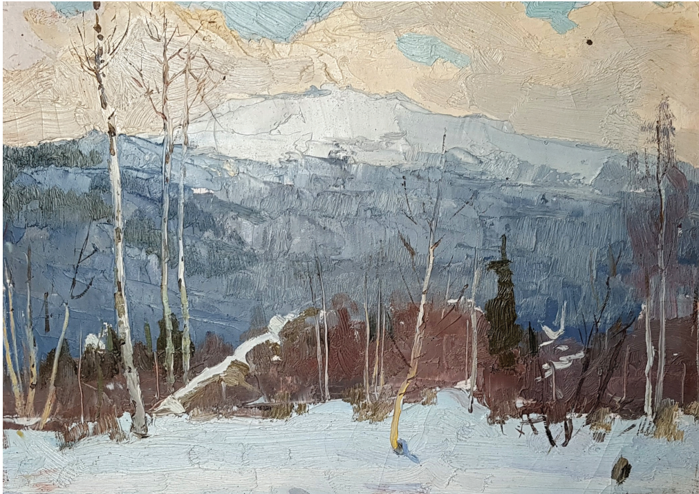
Рис. 1. «Зимний этюд» (1957)

Одну из первых работ, которую можно отнести к картинам, где начинают проявляться черты индивидуальности художника, можно назвать «Первые цветы». Она тоже написана в 1957 г., но разительно отличается от «Зимнего этюда». Здесь активно начинает работать передний план, где изображены цветущие побеги кустарника, общая цветовая гамма выдержана в спокойных буро-коричневых, коричневато-лиловых тонах, которые в дальнейшем использовались художником в большинстве работ. Отличается и манера письма: мазки более крупные, положены мозаично, что отражает поиски своего стиля, который со временем трансформировался в более поздних работах в «суровый» стиль.