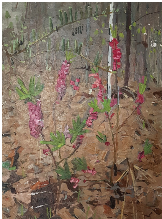
Рис. 2. «Первые цветы» (1957)

Одну из первых работ, которую можно отнести к картинам, где начинают проявляться черты индивидуальности художника, можно назвать «Первые цветы». Она тоже написана в 1957 г., но разительно отличается от «Зимнего этюда». Здесь активно начинает работать передний план, где изображены цветущие побеги кустарника, общая цветовая гамма выдержана в спокойных буро-коричневых, коричневато-лиловых тонах, которые в дальнейшем использовались художником в большинстве работ. Отличается и манера письма: мазки более крупные, положены мозаично, что отражает поиски своего стиля, который со временем трансформировался в более поздних работах в «суровый» стиль.