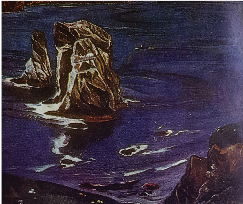
Рис. 3. «Морские шиханы» (1970)

зывает сложный и противоречивый процесс освоения человеком огромных северных регионов нашей страны.» [3, с. 177]. Так, в картине «У горы Рудной» (1969, Пермская художественная галерея) красочный строй имеет сложную структуру: при всей кажущейся монохромности, аскетичности цветовой гаммы она наполнена богатством цветовых нюансов, в данном случае не свойственных художнику, так как имеет символическую окраску. Нужно отметить, что всем его работам присущи определенные особенности композиционного построения: скрытое напряжение, монументальность, неожиданное восприятие пространственных соотношений форм, строгая архитектура. В большинстве картин отсутствует «кулисный» вход, когда пространство распаивается панорамно, даже в форматах относительно небольшого размера. В своих работах, художник использует такой прием, когда задний план становится главным «действующим лицом». Так и здесь гора-титан, закрывающая горизонт своей мощью, подчеркивает величие природы. По рисунку сама гора очень сложная, вздымается практически верти-