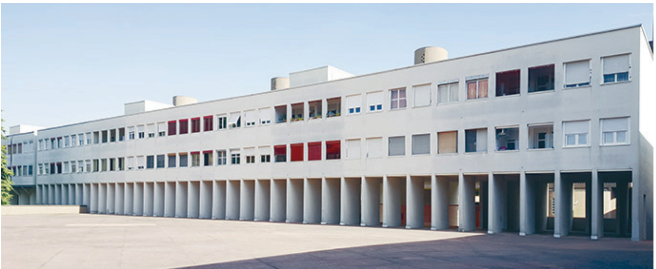
Рис. 2. Жилой дом Gallaratese, Милан, Италия (1967–1974). Источник: Carlo Aymonino, Aldo Rossi. Gallaratese Monte Amiata Complex. Milan. Italy 1967-1974 [Электронный ресурс]. – A+t architecture publishers, 2017. – URL: https://aplust.net/blog/carlo_aymonino_aldo_rossi_gallaratese_monte_amiata_complex_milan_italy/ свободно

Жилой комплекс Gallaratese – часть большого жилого квартала, расположенного в северо-западном пригороде Милана, Италия. Блок является пятым элементом жилого комплекса, спроектированного архитектором Карло Аймонино в партнерстве с Альдо Росси в ответ на жилищный кризис в Милане в 1960–1970-х гг. Росси взял прецеденты из римского храма, чтобы создать абстрактный объект, не обязательно жилой блок. В этом доме публичное пространство