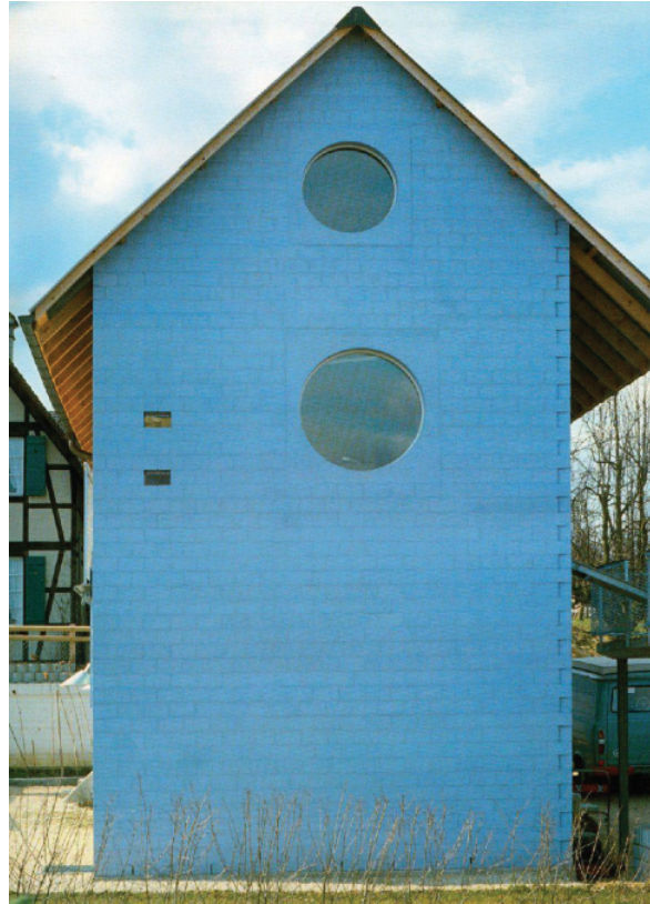
Рис. 5. Голубой дом в Обервиле. Жак Герцог и Пьер де Мерон. 1979–1980 [9, с. 203]

Другой объект, который выявляет преемственность идей Росси в подходах учеников, это Голубой дом в Обервиле, построенный в 1979–1980 гг. (рис. 5). Он является знаком, отсылающим к лаконичному простому языку учителя. Синий цвет, по мнению Акоша Моравански и Джудит Хопфенгартнер, дает дому имя [9]. Это ссылка на идею Ива Кляйна о нематериальности. При этом фасад функционирует не как знак – в смысле ссылки на язык и форму зданий учителя или