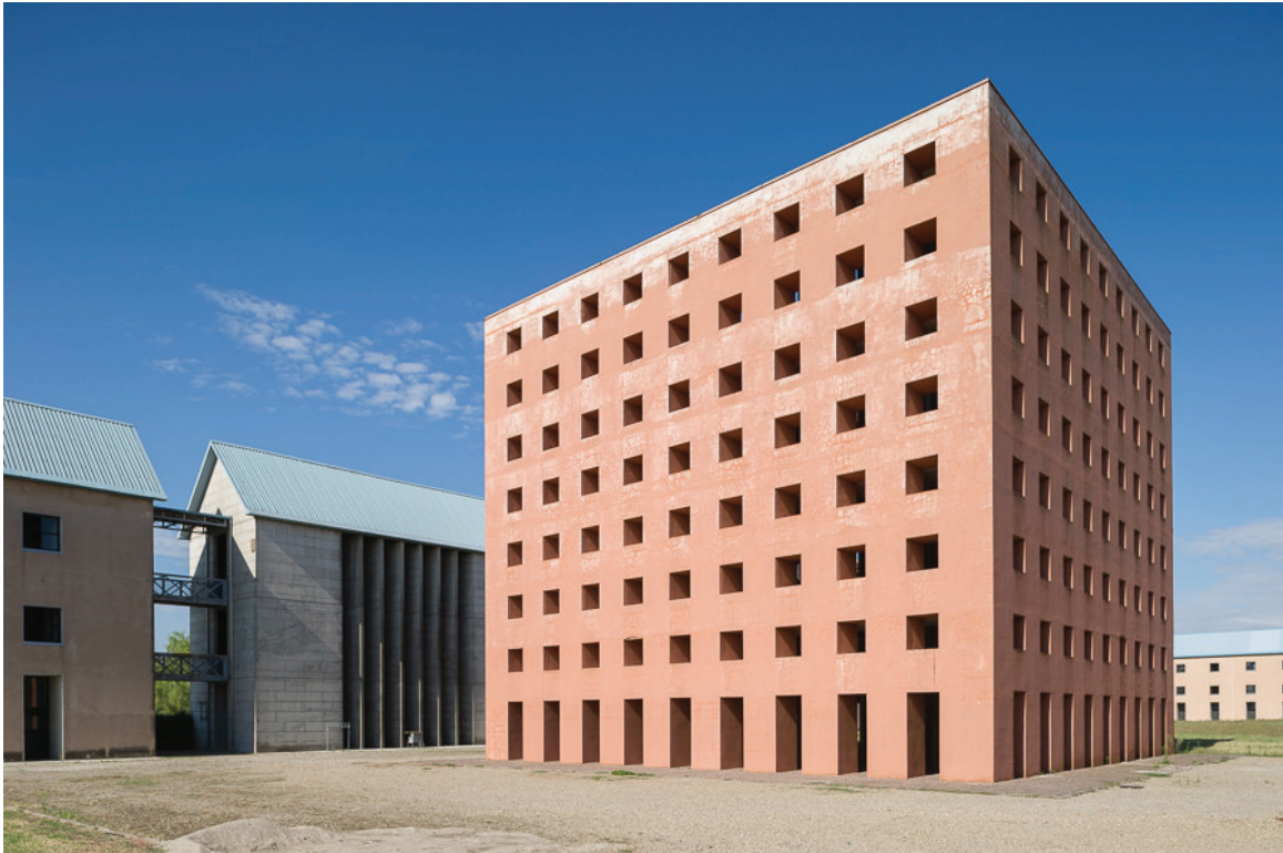
Рис. 3. Кладбище Сан-Катальдо в Модене, Италия (1971–1984). https://hiveminer.com/Tags/cimitero%2Cmodena/Recent свободно

бильной аварии Росси рассматривал структуру скелета человека как серию переломов, которые можно повторно собрать. Сан-Катальдо он идентифицировал как смерть и морфологию сломанного скелета с модификацией плана.