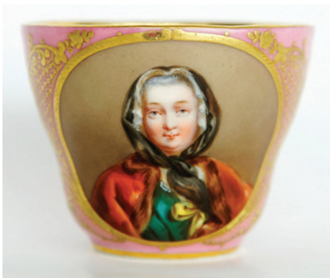
Рис. 9. Чашка с портретом Марии Лещинской, королевы Франции. Неизвестная фарфоровая мануфактура. Франция. 1840-е гг. По гравюре Ф. С. Дельпеша (1778–1825) с живописного оригинала Ж.-М. Наттье (1703–1768). Фарфор; крытье, роспись надглазурная полихромная, золочение, цировка. (Публикуется впервые). Екатеринбургский музей изобразительных искусств

произошла путаница между столь похожими изображениями, что ввело в заблуждение автора росписи. Таким образом, вопрос об источнике создания этой росписи остается открытым.