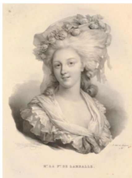
Рис. 16. Греведон, Пьер Луи (1778–1860). Портрет Марии-Терезы-Луизы де Савойя-Кариньян принцессы де Ламбаль из сборника «Иконография современников с 1789 по 1829 год», 2 Том. 1823. Бумага, литография. Инв. № 1872,1012.4034. Британский музей.