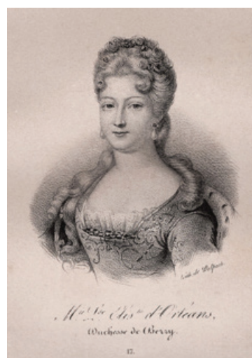
Рис. 6. Дельпеш, Франсуа Серафин (1778–1825). Портрет Марии Луизы Елизаветы Орлеанской, герцогини Беррийской из сборника «Французская иконография». Бумага, литография.