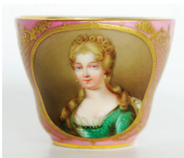
Рис. 5. Чашка с портретом Марии Луизы Елизаветы Орлеанской, герцогини Беррийской. Неизвестная фарфоровая мануфактура. Франция. 1840-е гг. По гравюре Ф. С. Дельпеша (1778–1825) с живописного оригинала П. Гобера (1662–1774). Фарфор; крытье, роспись надглазурная полихромная, золочение, цирровка. (Публикуется впервые). Екатеринбургский музей изобразительных искусств

На тот же оригинал, очевидно, опирался в своей работе Ф. С. Дельпеш: портрет герцогини на странице сборника «Французская иконография» полностью соответствует композиции и деталям исполненного в XVIII в. портрета (рис. 6).