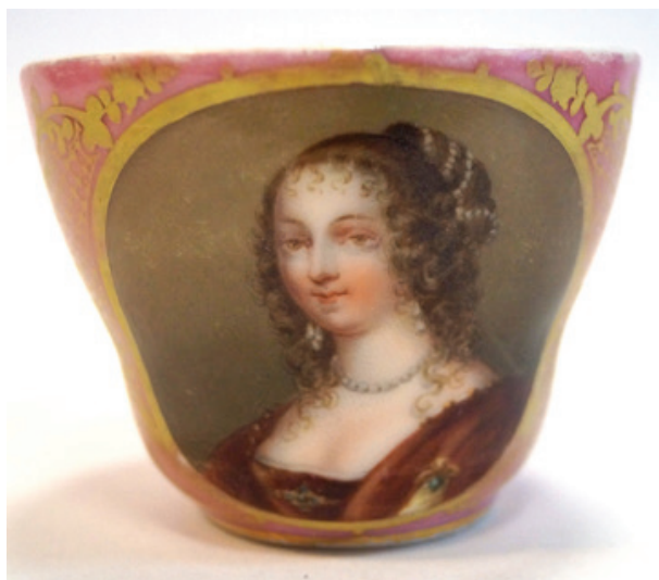
Рис. 3. Чашка с портретом Генриетты-Мари Французской, королевы Англии. Неизвестная фарфоровая мануфактура. Франция. 1840-е гг. По гравюре Ф.С. Дельпеша (1778–1825) с живописного оригинала А. ван Дейка (1599–1638). Фарфор; крытье, роспись надглазурная полихромная, золочение, цирровка. (Публикуется впервые). Екатеринбургский музей изобразительных искусств