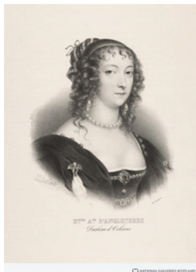
Рис. 4. Дельпеш, Франсуа Серафин (1778–1825) с оригинала А. ван Дейка (1599–1638). Портрет Генриетты-Мари Французской из сборника «Французская иконография». Бумага, литография. Инв. № SP II 47,5. Национальная галерея Шотландии.

На третьей чашке запечатлена еще одна представительница французской королевской фамилии – Мария Луиза Елизавета Орлеанская, герцогиня Беррийская ( Marie-Louise-Elisabeth d'Orléans, duchesse de Berry , 1695–1719) (рис. 5).