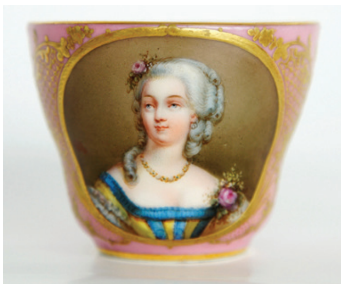
Рис. 11. Чашка с портретом Жанны Бекю, графини Дюбарри. Неизвестная фарфоровая мануфактура. Франция. 1840-е гг. По гравюре Ф. С. Дельпеша (1778–1825). Фарфор; крытье, роспись надглазурная полихромная, золочение, цировка. (Публикуется впервые). Екатеринбургский музей изобразительных искусств

Графическое изображение мадам Дюбарри с ее факсимильной подписью, традиционной для большинства листов Франсуа Серафима Дельпеша также было включено в сборник «Французская иконография» (рис. 12). Необходимо отметить, что в данном случае сходного с графикой и росписью живописного образа графини Дюбарри не было выявлено.