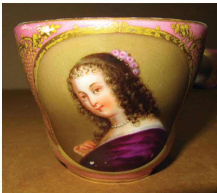
Рис. 1. Чашка с портретом Нинон де Ланкло. Неизвестная фарфоровая мануфактура. Франция. 1840-е гг. По гравюре Ф. С. Дельпеша (1778–1825) с живописного оригинала Ж. Петито (1607–1691). Фарфор; крытье, роспись надглазурная полихромная, золочение, цирровка. (Публикуется впервые). Екатеринбургский музей изобразительных искусств

Этот портрет неоднократно становился объектом интерпретации для граверов и литографов, однако наиболее близким к изображению на чашке (хоть и дающим зеркальное изображение оригинала) представляется работа французского литографа Франсуа Серафина Дельпеша ( François Séraphin Delpech , 1778–1825), предназначенная им для сборника «Французская иконография или выбор из двухсот портретов мужчин и женщин от правления Карла VII до конца правления Людовика XVI» ( Iconographie française ou choix de deux cents portraits d'hommes et de femmes depuis le règne de Charles VII jusqu'à la fin de celui de Louis XVI ) (рис. 2). К личности литографа и его работам мы обратимся далее.