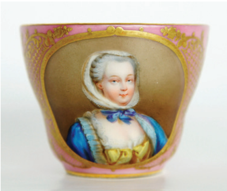
Рис. 7. Чашка с портретом Жанны-Антуанетты Пуассон, маркизы де Помпадур. Неизвестная фарфоровая мануфактура. Франция. 1840-е гг. По гравюре З. Беллиарда (1798–1861) с живописного оригинала Ф.-Ю. Друэ (1727–1775). Фарфор; крытье, роспись надглазурная полихромная, золочение, цировка. (Публикуется впервые). Екатеринбургский музей изобразительных искусств

Аналогичный образ знаменитой фаворитки запечатлен в двух известных портретах Франсуа-Юбера Друэ ( François-Hubert Drouais , 1727–1775) из собраний Музея Конде в Шантильи и Музея изящных искусств в Орлеанеб. С большой вероятностью именно один из этих портретов является источником для гравированного образа мадам де Помпадур, выполненного французским гравером Зефирином Беллиардом ( Zéphirin Belliard , 1798–1861) в 1829 г. и включенным во «Французскую иконографию» Дельпеша (рис. 8).