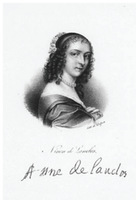
Рис. 2. Дельпеш, Франсуа Серафин (1778–1825). Портрет Нинон де Ланкло из сборника «Французская иконография». Бумага, литография. Инв. № NMG Lito 220/1877. Национальный музей Швеции.

Следующую чашку украшает портрет королевы-консорты Англии Генриетты-Марии Французской ( Henriette Marie de France , 1609–1669), дочери короля Франции Генриха IV и королевы Марии Медичи (рис. 3).