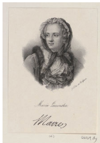
Рис. 10. Дельпеш, Франсуа Серафин (1778–1825). Портрет Марии Лещинской из сборника «Французская иконография». Бумага, литография. Инв. № RCIN 616269. du. Британская королевская коллекция.

Еще один резерв чашки из рассматриваемого комплекта представляет одну из самых влиятельных женщин эпохи Людовика XV – здесь воспроизведен портрет Жанны Бекю, графини Дюбарри ( Jeanne Bécu, comtesse du Barry , 1743–1793) (рис. 11).