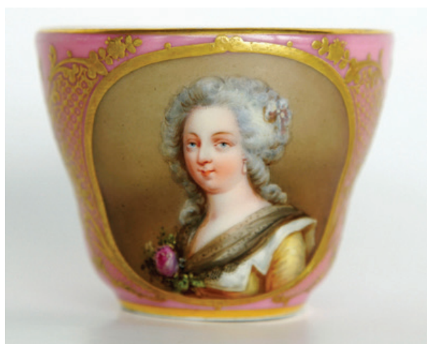
Рис. 13. Чашка с портретом Елизаветы Французской (Мадам Элизабет). Неизвестная фарфоровая мануфактура. Франция. 1840-е гг. По гравюре П. Л. Греведона (1778–1825). Фарфор; крытье, роспись надглазурная полихромная, золочение, цирровка. (Публикуется впервые). Екатеринбургский музей изобразительных искусств

Графический источник, к которому восходит роспись на чашке, относится к другому сборнику литографий, начатому Ф. С. Дельпешем и опубликованному после его смерти в 1833 г. – «Иконография современников с 1789 по 1829 г.» ( Iconographie des contemporains depuis 1789 jusqu'à 1829 ) [9]. Отметим, что согласно атрибуции Британского музея, литография была выполнена французским художником Пьером Луи Анри Греведоном ( Pierre Louis Henri Grévedon , 1776–1860) в 1823 г., а впоследствии опубликована в первом томе издания Дельпеша (рис. 14).