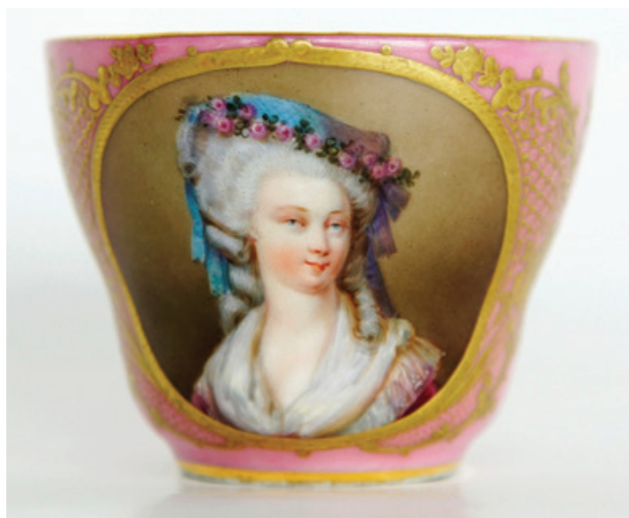
Рис. 15. Чашка с портретом Марии-Терезы-Луизы де Савойя-Кариньян, принцессы де Ламбаль. Неизвестная фарфоровая мануфактура. Франция. 1840-е гг. По гравюре П. Л. Греведона (1778–1825). Фарфор; крытье, роспись надглазурная полихромная, золочение, цирровка. (Публикуется впервые). Екатеринбургский музей изобразительных искусств

двухсот портретов мужчин и женщин от правления Карла VII до конца правления Людовика XVI», включавшая 200 портретов в одном томе.