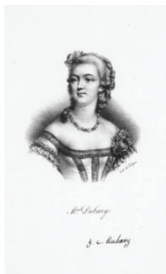
Рис. 12. Дельпеш, Франсуа Серафин (1778–1825). Портрет мадам Дюбарри из сборника «Французская иконография». Бумага, литография. Инв. № NMG Lito 227/1877. Национальный музей Швеции.