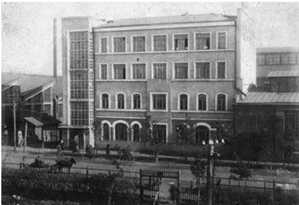
Рис. 5. Омск. Завод «Красный пахарь». Здание заводоуправления. Реконструкция 1929–1930. Инж.-арх. П.П. Голышев, В.С. Бродский, Арцимович, Краузе. Фото из фондов Омского государственного историко-краеведческого музея, середина 1930-х гг.