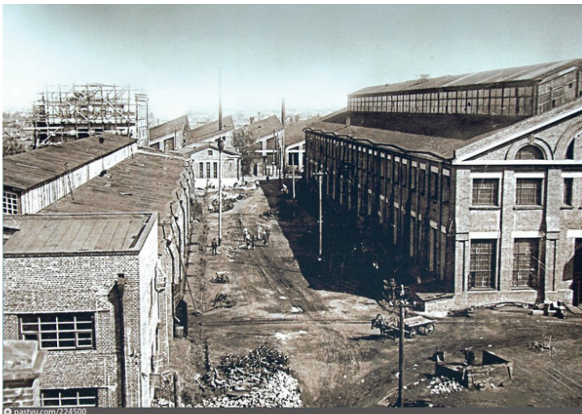
Рис. 6. Омск. Цеха завода «Красный пахарь». 1925–1930. Арх., инж. П.П. Голышев, инж. Бродский, Арцимович, Краузе. Фото из фондов Омского государственного историко-краеведческого музея, 1934