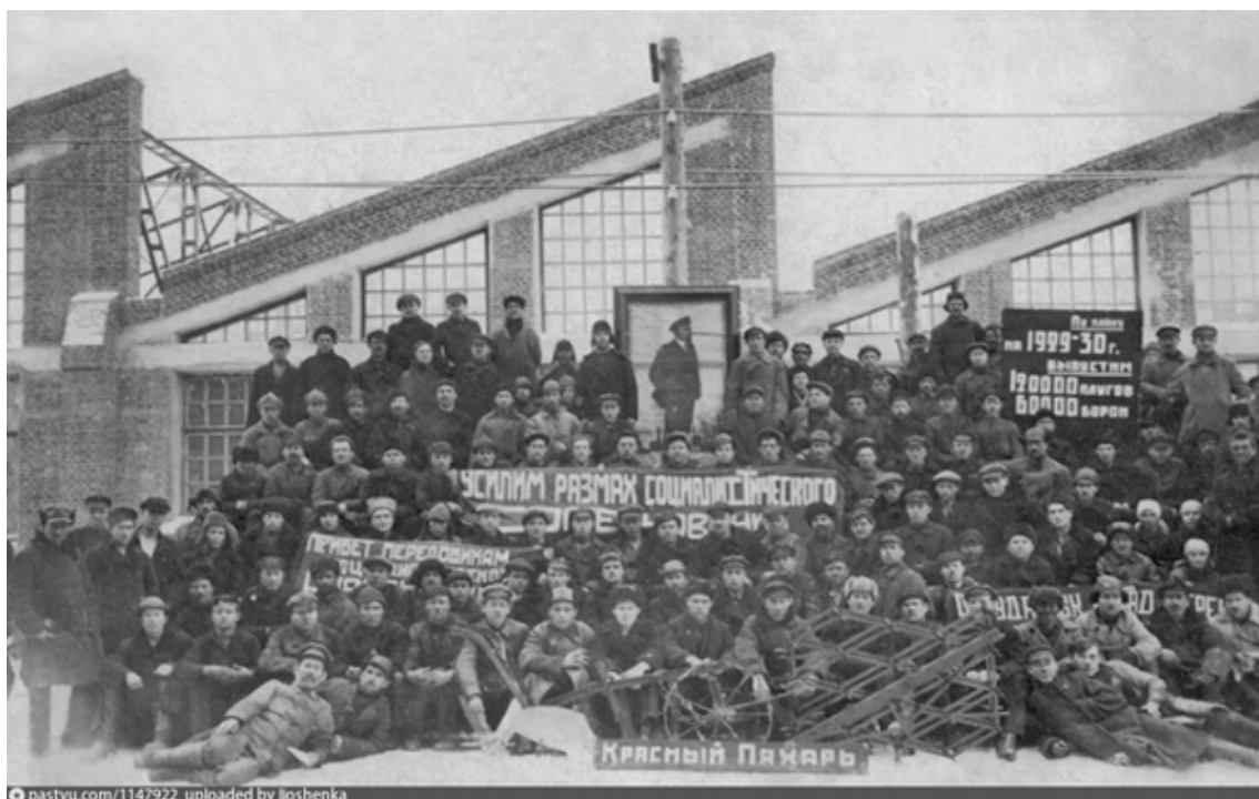
Рис. 7. Омск. Завод «Красный пахарь». Строительство кузнечно-прессового цеха. Арх., инж. П.П. Гольшев, инж. Бродский, Арцимович, Краузе. Фото из фондов Омского государственного историко-краеведческого музея, 1930