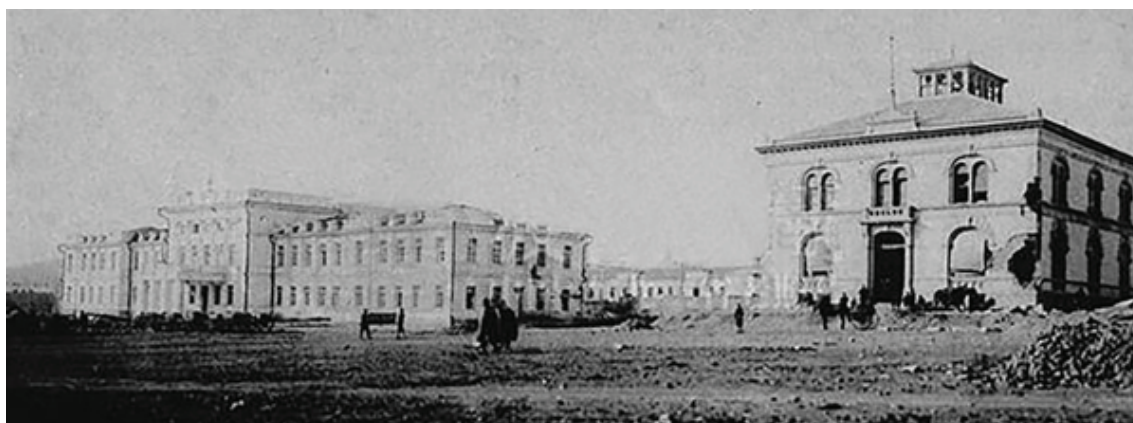
Рис. 2. Второе здание Русско-Китайского банка в Даляне (Порт Артур), фото 1904 г. (справа).