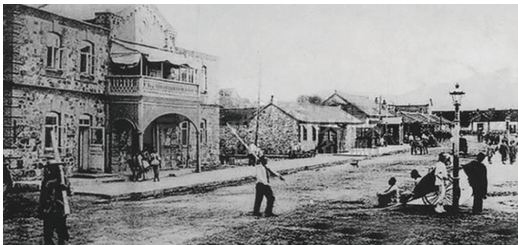
Рис. 1. Первое здание Русско-Китайского банка в Даляне (Порт Артур), 23 июля 1898 г. (слева).