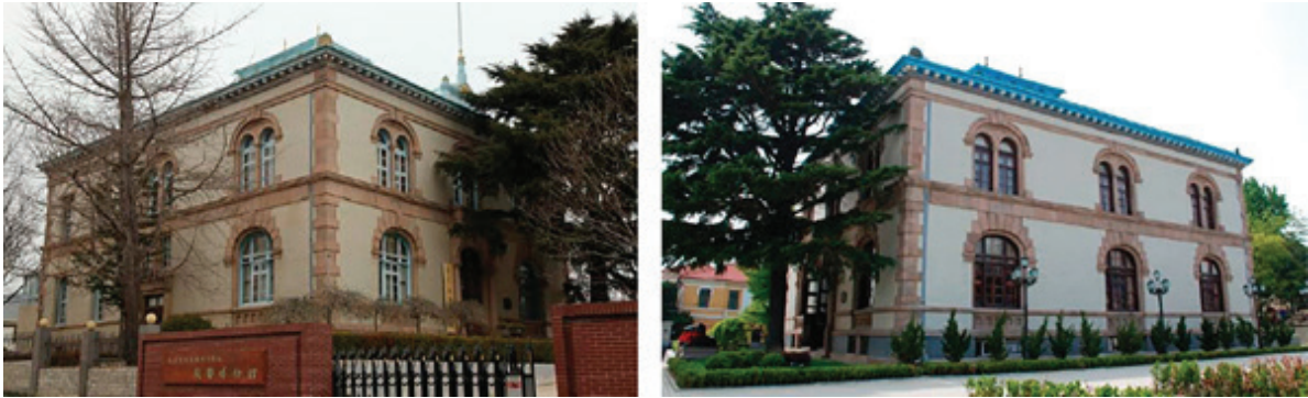
Рис. 3. Второе здание Русско-Китайского банка в Далине (Порт Артур). 1902, ул. Ванлэ, 33. Современное состояние