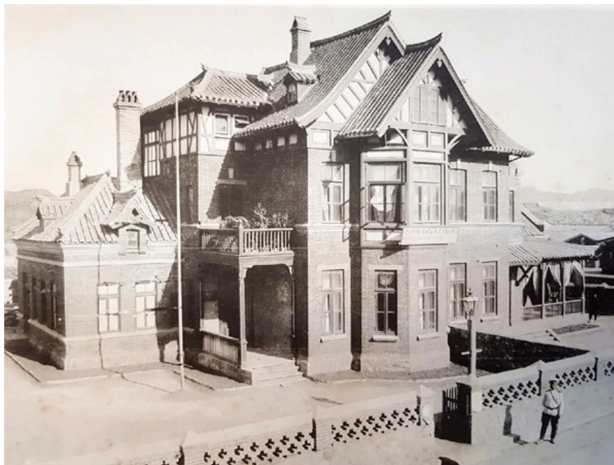
Рис. 4. Дом-особняк, в котором размещалось отделение Русско-Китайского банка. Дальний, 1902 : [план порта и города Дальний] : [альбом фотографий]. – [Б. м. : б. и., 1902]. – 36 л. фот. Л. 14

характерно для архитектуры банковских учреждений того времени, владельцы которых стремились передать атмосферу стабильности и процветания своих организаций (рис. 5–7).