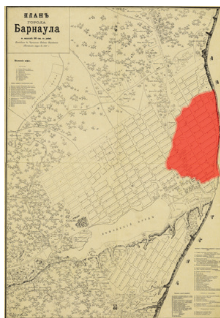
● - территория пожара 4 мая 1917 г.