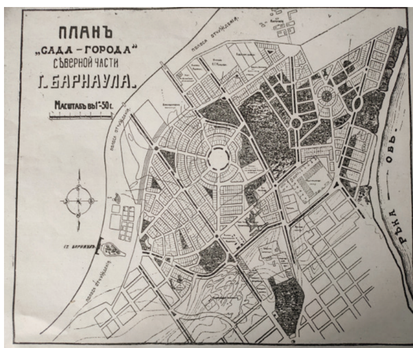
Рис. 3. Проект Города-сада [12]