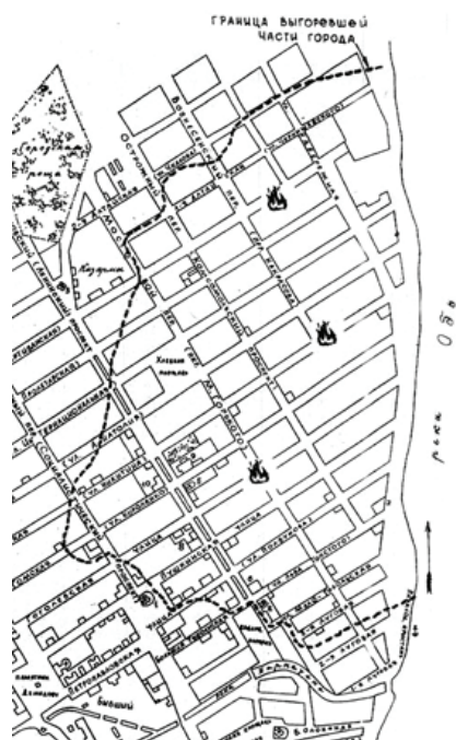
Рис. 5. Границы выгоревшей части Барнаула, 1917.