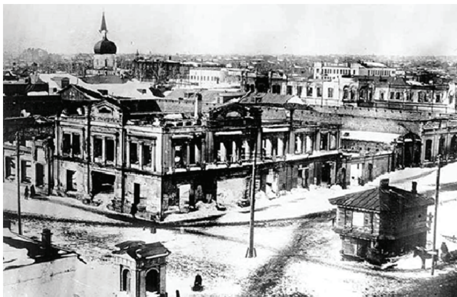
Рис. 4. Барнаул. Московский пр. после пожара 1917 г.

Можно предположить, что главным толчком для воплощения идеи города-сада в Барнауле явился пожар 2 мая 1917 г. (рис. 4), который усугубил затянувшийся существующий жилищный кризис в Барнауле. При общей нехватке земельных участков для жилищного строительства возникла проблема размещения погорельцев и их обеспечения жизненно необходимыми вещами, что явилось дополнительной нагрузкой для городского бюджета.