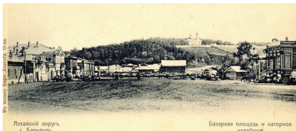
Рис. 2. Барнаул. Базарная площадь и нагорная часть. Открытка начала XX в.

Таким образом, город приобрел определенную планировочную структуру. Пунктиром отмечена территория городских дач, а параллельными линиями, проходящими от р. Оби по Малой Алтайской в западном направлении, показаны границы города на 1895 г. Распланированные кварталы за линией (ул. Корековская (сейчас Партизанская), Большая Алтайская (Чернышевского), Малая Алтайская (Чкалова), 3-я Алтайская (Кирова)) наглядно подтверждают логичное развитие Барнаула в северном направлении. Организованная Городская роща на пересечении 3-й Алтайской и Московского пр. (пр. Ленина) свидетельствует о перспективе развития свободной территории и возможности развивать новые планировочные структуры города.