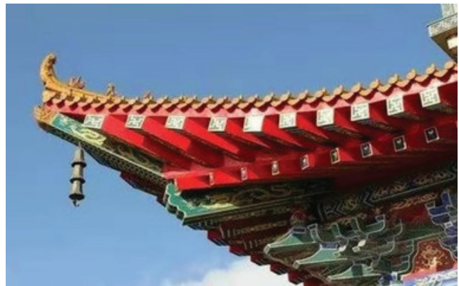
Рис. 4. Чжан Кэцзюнь, «Деревья и дома». Пекинское машиностроительное изд-во, 2020

зовались для стабилизации шляпок гвоздей уложенной глазурованной черепицы, создавая ярких и живых сказочных зверей, которые постепенно стали широко распространенными.