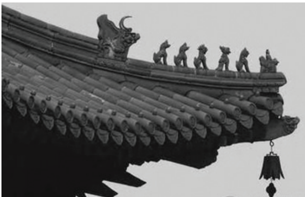
Рис.3. Чжоу Шуцинъ «Запретный город Пекина». Пекин, Китайское строительное индустриальное изд-во, 2015

Орнамент конька из бессмертных зверей считается очень характерным национальным мотивом в древнекитайской архитектурной философии, благодаря высокой частоте его появления в дворцовой архитектуре династий Мин и Цин и строгому режиму его использования. Сидящие звери, расположенные в строгой последовательности, в основном заимствованы из древнего китайского фольклора. Каждый из них имеет свое название и символическое изображение, а также происхождение и значение, и они выполняют свои роли, обеспечивая безопасность и стабильность здания на психологическом и духовном уровне. На самом деле эти звери – не просто символы стабильного счастья и добрых пожеланий, это очень важные архитектурные элементы, которые играют реальную роль в креплении крыши. Это шляпки железных гвоздей, которые удерживают крышу на месте, и по мере развития технологии глазуровки они исполь-