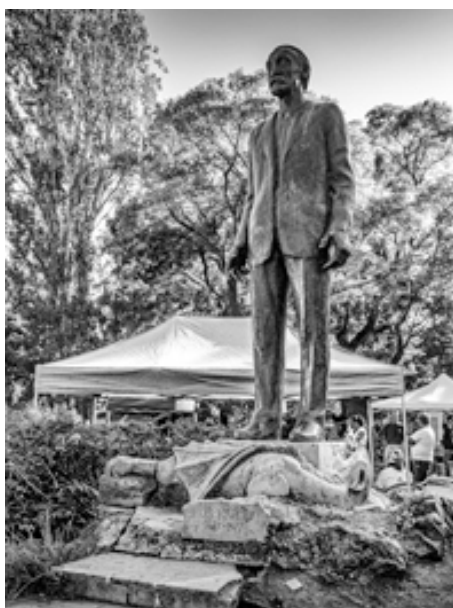
Рис. 3. Памятник Кароли Косу, попирающему ногой дракончика, символизирующего врагов социального прогресса.

Несмотря на то, что типовые планы домов для поселка спроектировал Фляйшль, на центральной площади Векерлетелепа стоит памятник другому архитектору – Кароли Косу (Karoly Kos, 1883–1977), который в 1912 г. выиграл специально объявленный тендер на проект главного общественного пространства колонии (рис. 3). Кароли Кос до 1913 г. руководивший строительством постлка, был вдохновенным и убежденным проповедником трансильванской культуры, которую он и круг его единомышленников считали источником подлинного народного духа, незамутненным габсбургским влиянием. Для обеспечения разнообразия застройки Кос предложил, чтобы один архитектор мог построить на площади не более двух зданий. К сожалению, он сам первый последовал этому правилу, будь Кос менее благороден и принципиален, центр Векерлетелепа, мог бы стать цельным шедевром мадьярского стиля (рис. 4–6). Постепенно площадь получила сплошную периметральную застройку с двумя эффектными арками: западные ворота Коса (рис. 10) и восточные ворота Зрумецки (рис. 7–9, 11), расположенными напротив друг друга и фиксирующими главную композиционную ось. Ворота, спроектированные Дезе Зрумецки (Zrumeczky Dezso, 1883–1917), наряду с Парламентом, Рыбацким бастионом и зданиями, постро-