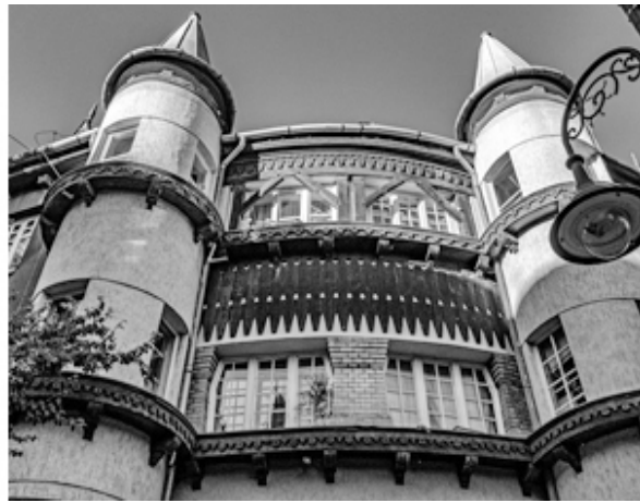
Рис. 5, 6. Здания на площади Кароли Коса, построенные по проектам Кароли Коса. Фото Г. Чанад, 2022