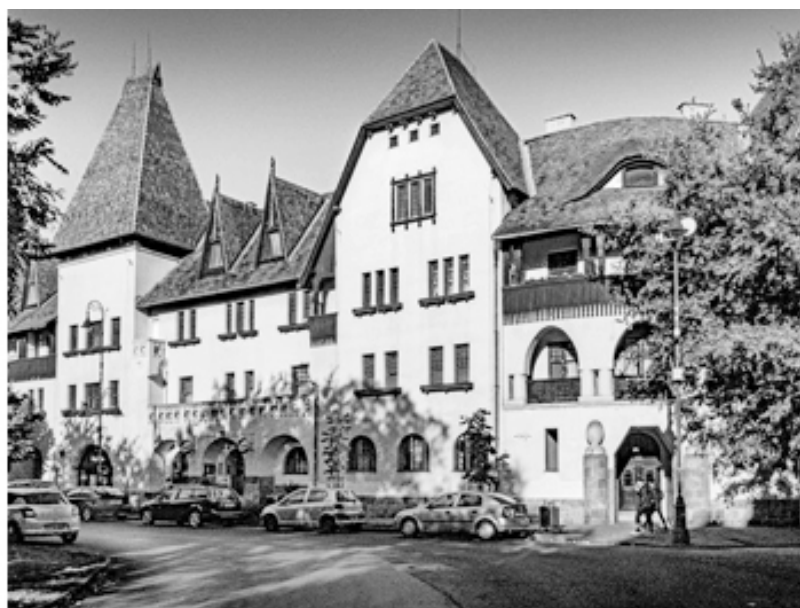
Рис. 4. Здания на площади Кароли Коса, построенные по проектам Кароли Коса.