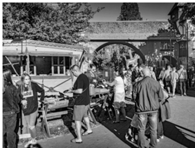
Рис. 11,12. Площадь Кароли Коса – неизменно оживленное общественное пространство Векерлетелепа.