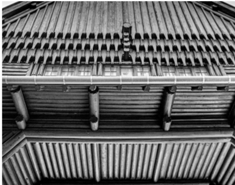
Рис. 7, 8 Восточные ворота, спроектированные Дезе Зрумецки в традициях народной деревянной архитектуры Трансильвании. Фото Г. Чанади, 2022