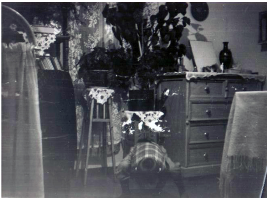
Рис. 1. Жилая комната 1958 г.

На переднем плане трубчатая металлическая кровать с панцирной сеткой. Изножье забрано сборчатой тюлевой занавеской, призванной обеспечить некоторую камерность, изоляцию спальной зоны. Далее, вдоль стены, последовательно размещена этажерка с книгами, украшенная кружевными салфетками. Перед оконным проемом располагается композиция из комнатных растений с неизменным фикусом, непременно алоэ для лечебных целей, геранью и папоротником. Растения размещают на тумбочке токарной или столярной работы, заботливо украшенной такими же салфетками, как на этажерке. Замыкает эту линию комод со скромно украшенным накладными профилями фасадом. Горизонтальная поверхность комода обязательно накрыта кружевной накидкой (покрывальцем). Это своеобразный «будуар» хозяйки. Зеркало, китайская лаковая ваза, милые безделушки и шкатулочки. Вообще, это время кустарных шкатулочек: деревянных, из папье-маше, обклеенных ракушками, стеклянных, в которых хранятся памятные или нужные в хозяйстве вещи – от документов до пуговиц. Следующая стена нам не видна, но там, локализуется другая функция – диван с круглыми валиками и высокой