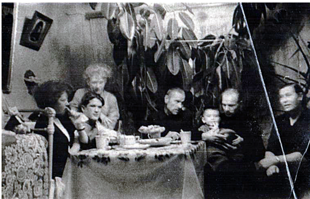
Рис. 2. Жилая комната 1959 г.

спинкой-полочкой, на которой выстраиваются семь или девять гипсовых или вырезанных из камня слоников. Детская кроватка размещается перед торцом родительской кровати в простенке, одна из сторон которого – задняя стена печи. Это самый теплый угол комнаты. Ну и, конечно, посередине этого, довольно зажиточного интерьера – стол, накрытый повседневной белой скатертью с бахромой. На праздники, приезды родни, воскресенье, словом любого неформального внесемейного общения полагалась другая, праздничная – двойная скатерть из цветной или с цветочным узором основы и, защищающей ее, мелко сетчатой с кружевной окаемкой накидки.