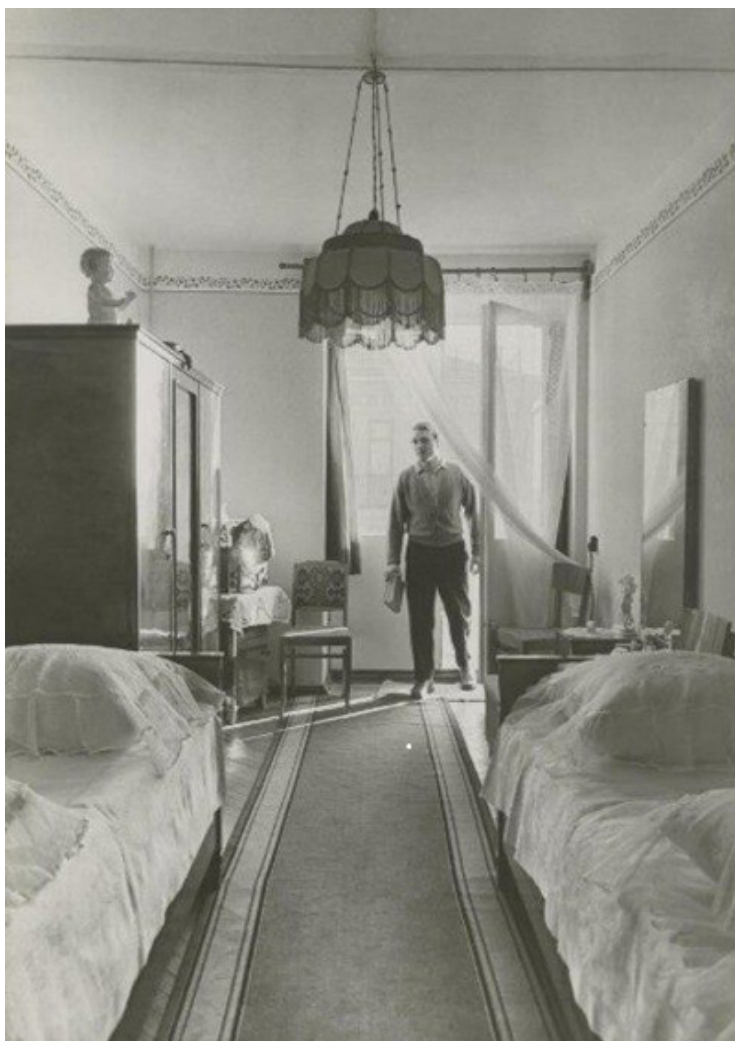
Рис. 5. В новой квартире. 1960-е. Москва.

Так на рис. 5 представлен великолепный с точки зрения стереотипности и промежуточности образного формирования, интерьер спальни. Исключительно неудобные размеры и пропорции помещения типовых спален в виде прямоугольника «вагонного» или стремящегося к нему пространства, задавали массу проблем в зонировании интерьера. В силу узости помещения основным и, пожалуй, единственным был «транзитный» вариант с последовательным размещением функциональных зон. Возможны только вариации: спальная зона у окна; спальная зона в середине; спальная зона при входной группе (см. рис. 5).