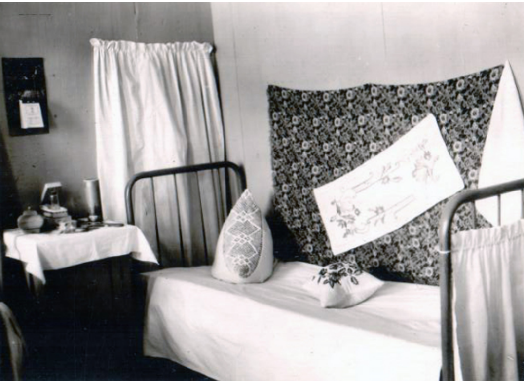
Рис. 4. Спальная зона. 1954.

При наличии достаточной площади жилища, выразившейся в дополнительной комнате, в «демократичном» интерьере начинает возрождаться супружеская спальня. Функция сна «покидает» жилую универсальную комнату, приобретая в отдельном помещении приоритетный характер. Конечно, в силу отсутствия или малого количества предлагаемой на рынок специализированной мебели, интерьер супружеской спальни формируется за счет старых, уже существующих в потреблении образцов предметного мира спальни. В силу этого интерьер, мягко говоря, скуден и не выразителен. Металлические кровати с панцирной сеткой, платяные шкафы с двумя отделениями – большим для хранения одежды и малым для хранения в стопках постельного белья. Нередко дверца большого отделения является зеркальной по всему фронту или наполовину. Тумбочки с одной дверцей и открытой полкой, украшенные токарными элементами, еще не носят специфику прикроватной, оставаясь оборудованием других функциональных зон комнаты. Необычайную популярность приобретают восточные (узбекские, туркменские, таджикские) ковры. Ими драпируют стену над кроватью. Такой интерьер семьи с низким достатком можно наблюдать на рис. 3.