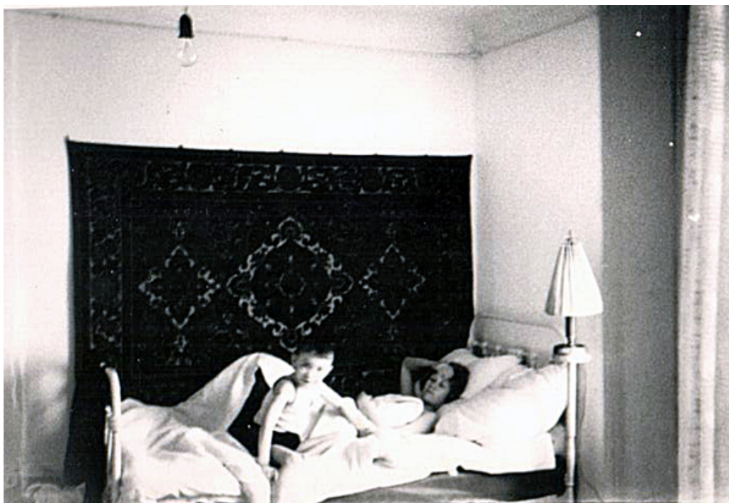
Рис. 3. Супружеская спальня. 1961.

На рис. 2 виден интерьер жилой комнаты, запечатленный именно в такой момент (1959). Не вдаваясь в подробности описания деталей, обратим внимание на «функциональную зону сна», представленную металлической кроватью, покрытой узорчатым покрывалом с горкой подушек под прозрачной накидкой, краешек которой виднеется слева. Это убранство кровати – обязательно и незыблемо, укоренено в поколениях; процедура убранства тщательно выполняется каждое утро. После того как кровать «убрана», на ней недопустимо сидеть ни в повседневной, ни в праздничной ситуации.