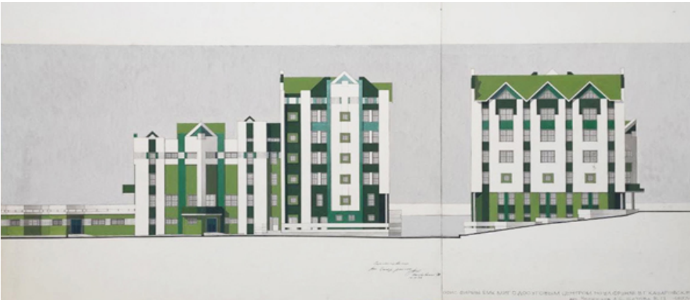
Рис. 4. Офис с досуговым центром. Хабаровск, ул. Фрунзе. Проект. 1996–1997. Арх. А.С. Ческидов, В. П. Шитова