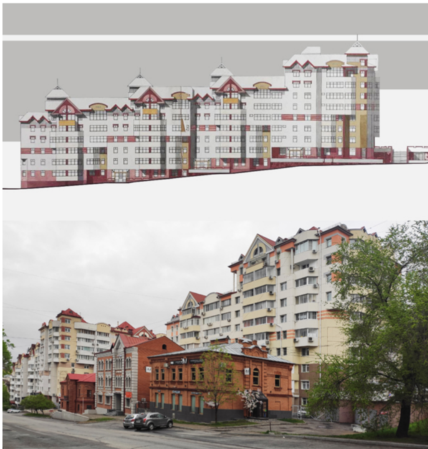
Рис. 9. Жилой дом. Хабаровск, ул. Комсомольская. Проект и фото, 1997–1998. Арх. А.С. Ческидов, В.П. Шитова