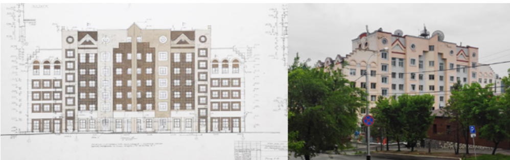
Рис. 5. Инженерный корпус «ХабЭнерго». Хабаровск, ул. Фрунзе. Проект и фото. 1997–1998. Арх. А.С. Ческидов, В.П. Шитова, гл. инж. проекта В.А. Горбулев