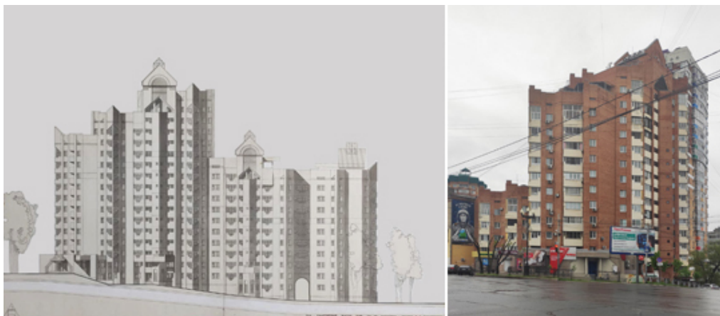
Рис. 10. Жилой дом. Хабаровск, угол ул. Ленина–Запарина. Проект и фото, 1995–1996. Арх. А.С. Ческидов

стилистически, анализ генпланов их архитектурных решений показал, что здания должны были располагаться поблизости друг от друга в границах ул. Шеронова в Хабаровске. Возможно, задумкой архитектора было создание единого архитектурного ансамбля.