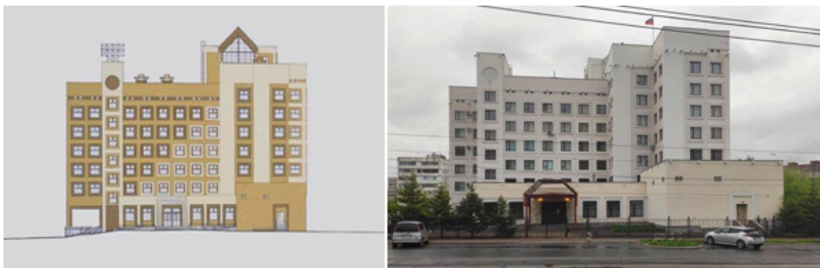
Рис. 7. Административное здание краевого Центра занятости населения. Хабаровск. Проект и фото. 1993–1996. Арх. А.С. Ческидов

Схожие приемы можно проследить в ряде других архитектурных работ зодчего, к ним относятся: административное здание краевого Центра занятости населения в г. Хабаровске, административно-деловое здание фирмы «Азия» (рис. 7–8).