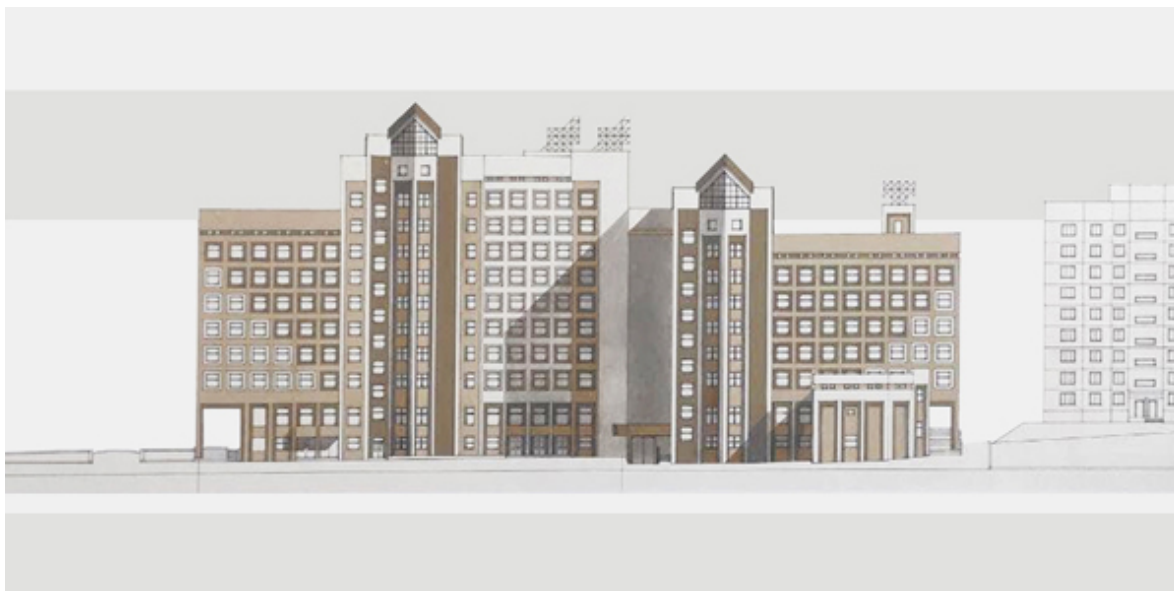
Рис. 8. Административно-деловое здание фирмы «Азия». Хабаровск, ул. Шеронова. Проект, 1993. Арх. А. С. Ческидов

Построенное по проекту А. С. Ческидова здание краевого Центра занятости населения (рис. 6) содержит в себе упомянутые стилевые особенности, присущие творческому подчерку архитектора: автор создает вертикальную композицию на центральной оси здания, венчая ее остроконечной конструкцией, тем самым «вытягивая» здание вверх. Центральную ось поддерживает дополнительная вертикаль, создавая асимметричную композицию фасада. На вспомогательной вертикали располагается небольшой округлый акцент, что композиционно и визуально уравновешивает основную и вспомогательную оси сооружения.