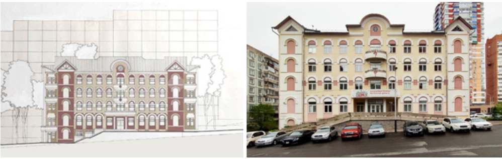
Рис. 3. Шахматный клуб и офис фирмы «Мнолит-88» (проект и фото). 1993–1996. Арх. А.С. Ческидов. На рис. 3–10 фото К.В. Захаровой