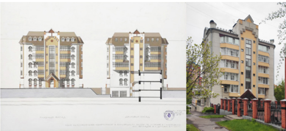
Рис. 6. Офис со служебными квартирами и бильярдным залом. Хабаровск, ул. Фрунзе. Проект и фото. 1997–1998. Арх. А.С. Ческидов, В.П. Шитова