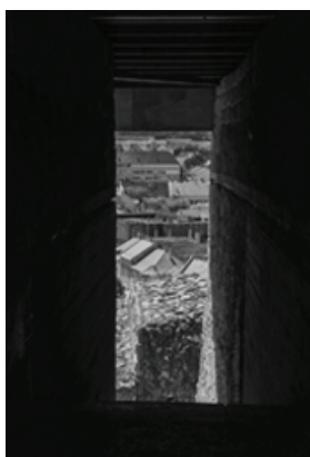
Рис. 3. Вид из бойницы замка в Эгере.

Эстергомская крепость (рис. 2), контролирующая переправу через Дунай, была основана римскими легионерами и являлась ключевым опорным пунктом Великой Моравии и княжества Нитра. Для венгров Эстергомский замок это, прежде всего, место рождения в 976 г. главной фигуры национального пантеона – короля Иштвана (святого Стефана). Панорама Эстергома украшает самую крупную венгерскую купюру (10 000 форинтов). Крепость была разрушена во время османской оккупации, ее сегодняшний облик – результат реконструкции практически «с нуля».