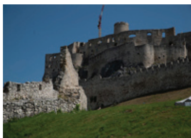
б) башни анжуйской династии