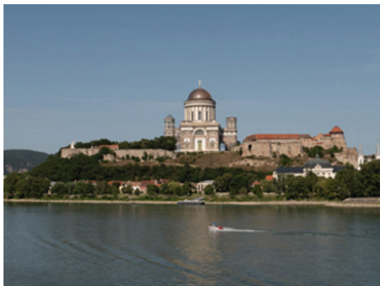
Рис. 2. Вид со словацкого берега Дуная на панораму г. Эстергома с замком.