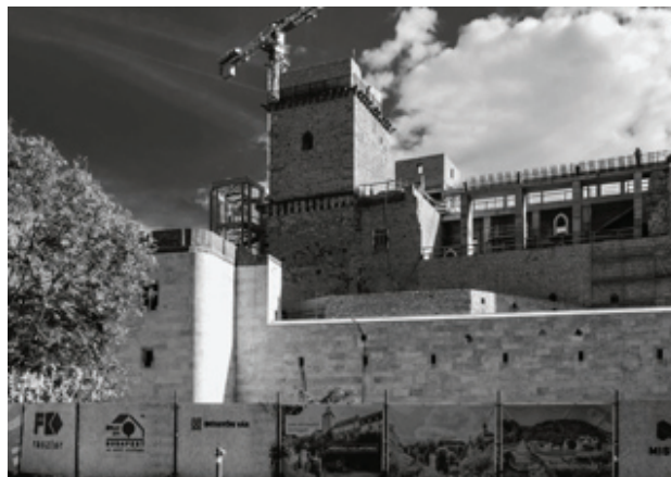
Рис. 4. Мишкольц. Венгрия. Реконструкция замка.