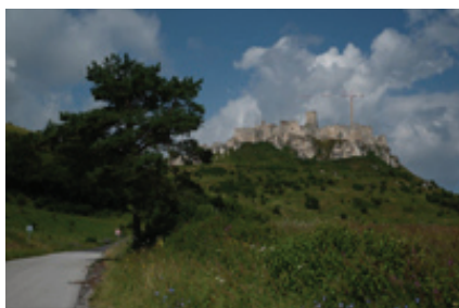
а) общий вид

Замок Сепеш (венгр. Szepesi Vár) (рис. 1), расположенный сегодня на территории Словакии, – прекрасный образец венгерского фортификационного зодчества, один из крупнейших замков Центральной Европы (самая старая часть датируется XI–XII вв.), в 1304 г. замок перешел к венгерским королям от Анжуйской династии (1212–1299) и перестраивался/расширялся до конца XIV в.; башни замка имеют характерные для анжуйских крепостей очертания. В 1780 г. замок полностью выгорел (из-за пожара, устроенного пьяными солдатами, варившими в подвале бренди) и обрушился. Помимо прочего погибли ренессансные интерьеры. В 1993 г. замок был включен в список всемирно-исторического наследия ЮНЕСКО и отреставрирован.