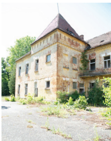
Рис. 5. Сомбатхей. Венгрия. Руинированная казарма 11-го гусарского полка. Арх. Д. Партос, 1888

Военные городки и казармы , пришедшие на смену замкам и крепостям – относительно позднее явление, связанное с созданием регулярных армий эпохи Просвещения. Так как военные принадлежали к высшему сословию («кшатрии»), а легендарные венгерские гусары являлись красой и цветом нации, объемно-планировочное решение кавалерийских казарм повторяло приемы европейских дворцовых ансамблей. Развернутые по горизонтали, протяженные корпуса с большими окнами, высокими шатровыми кровлями и четко зафиксированными осями симметрии декорировались в безордерном классицизме или схематизированном барокко. Последняя попытка оперировать уходящей эстетикой историзма связана с именем великого венгерского архитектора Алайоса Хаусманна (Alajos Hauszmann, 1847–1926), русским аналогом которого можно назвать А.И. Штакеншнейдера. Он спроектировал для 11-го гусарского полка, расквартированного в г. Сомбатхее классицистский дворец, ожидаемо оказавшимся слишком дорогим. Проект переработал Дьюле Партос (1845–1916), однокурсник Хаусманна и Одеона Лехнера по Берлинскому