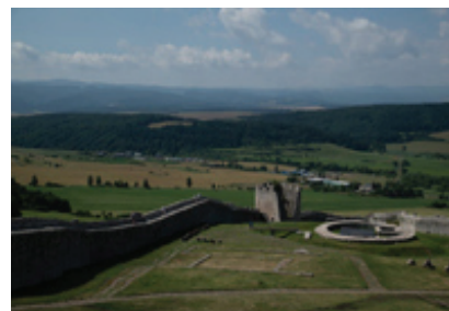
в) реконструкция внутреннего двора