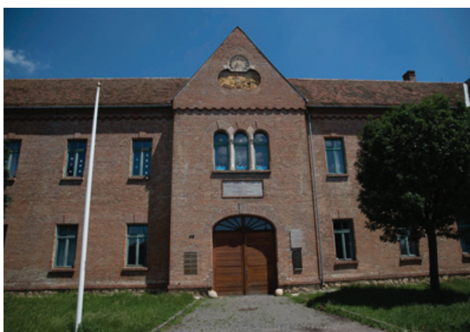
Рис. 6. Сомбатхей. Венгрия. Казарма 11-го гусарского полка, 1888