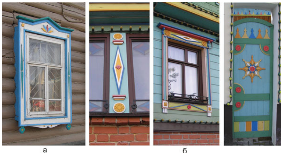
Рис. 3. Цветовая разработка деталей: а – наличник окна здания, ул. Каюма Насыри, 10;

К типу 3 относится двухэтажное деревянное здание на улице Каюма Насыри, 10. Бревенчатые стены дома не имеют обшивки; на их фоне выделяются наличники окон с накладным татарским декором в виде ромбов и полурозеток «сияний»; углы дома и торцы поперечных бревен на его фасаде обшиты досками также с накладным декором. Исходно бревенчатые стены дома не были окрашены, что можно увидеть и на архивной фотографии (рис. 1г), на которой данное здание видно с торца, внизу справа. В частично реализованном проектом предложении (в проекте предполагалась обшивка фасада досками) использована другая, по сравнению с предыдущим примером, система цветовых национальных идентификаторов (рис. 4). Это вариант окраски стен дома в «цвета дерева» с бело-голубым декором деталей. Оставить бревенчатые стены