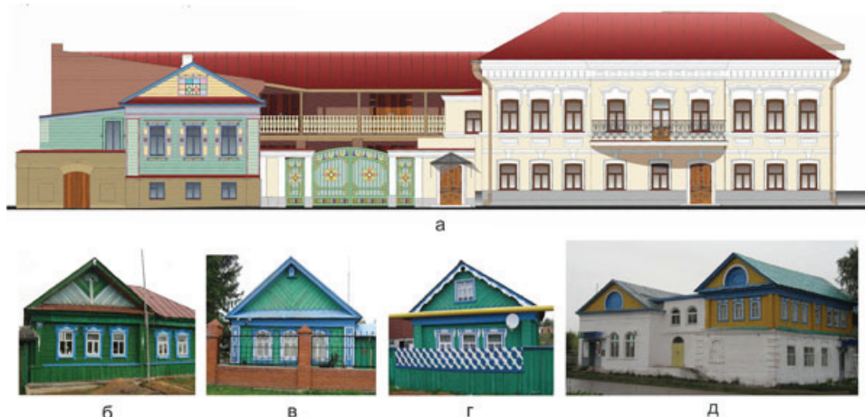
Рис. 2. Разработка цветового решения фасада комплекса «Татарская усадьба» с использованием национальных цветовых идентификаторов:

а – проект цветового решения, фасад, ул. Шигабутдина Марджани, 8. Арх. Р.Р. Аитов;