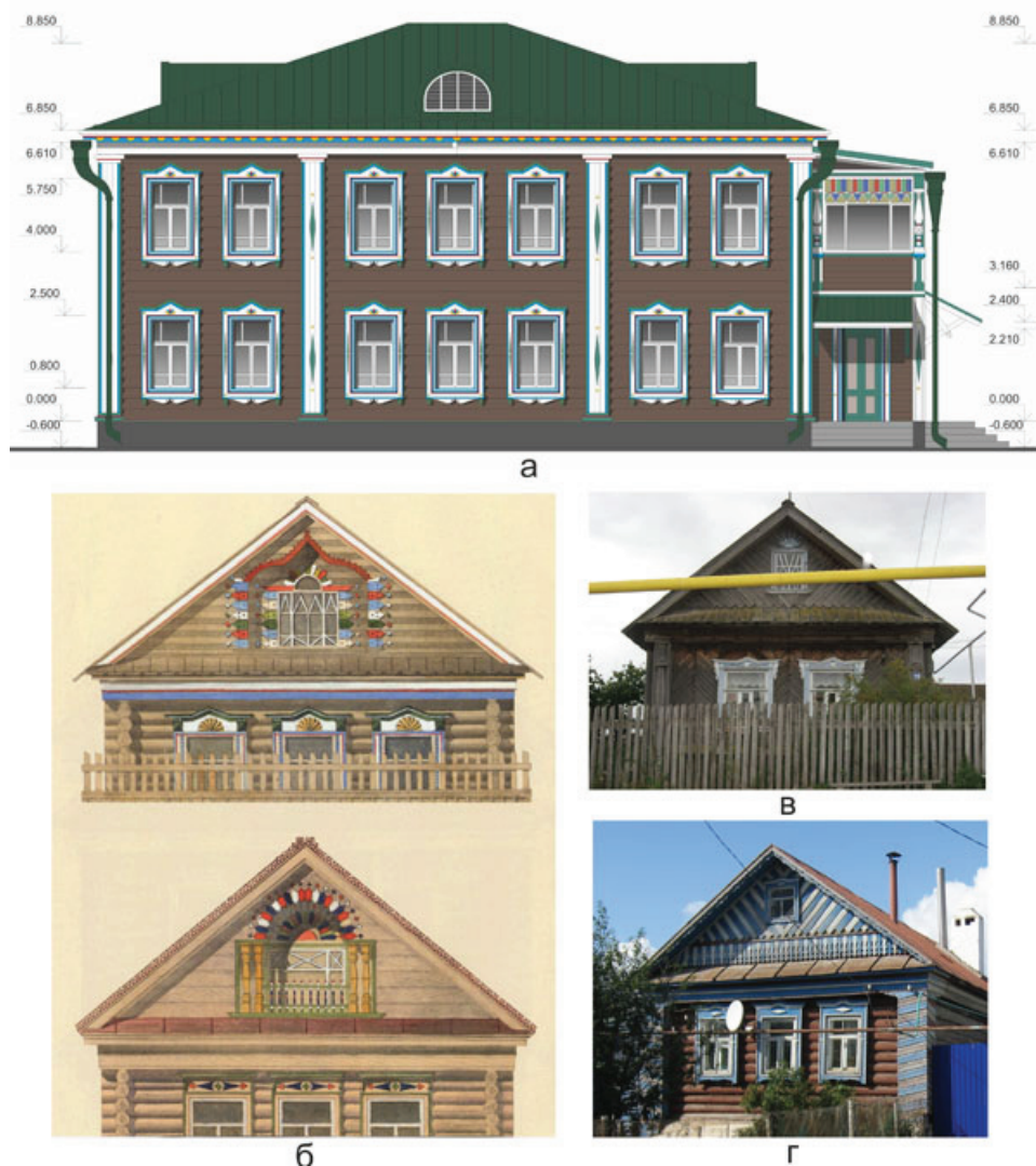
Рис. 4. Разработка цветовой решения фасада здания, ул. Каюма Насыри, 10:

а – проект цветовой решения. Арх. Р.Р. Аитов;