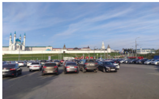
Рис. 4. Вид на кремль и площадь 1-го Мая с нижней террасы города.