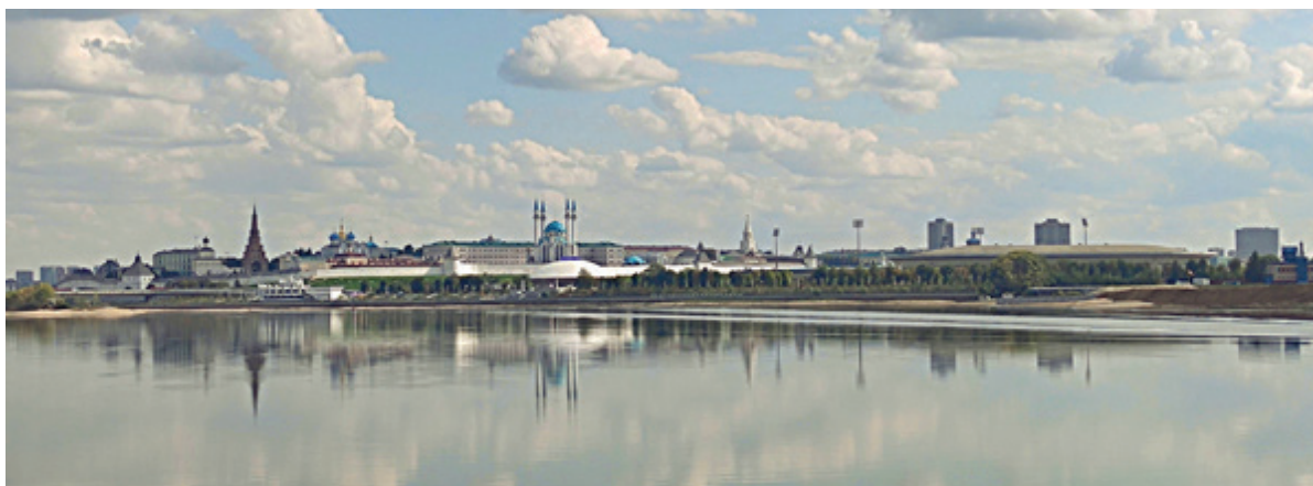
Рис. 6. Современная панорама г. Казани со стороны Адмиралтейской слободы.