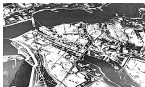
Рис. 2. Проект 1-й мастерской института «Татгражданпроект», удостоенный поощрительной премии

Основной стержень общественного центра Казани – р. Казанка, притягивающая к себе все основные звенья: территории, ограниченные на левом берегу железнодорожным вокзалом, центральным стадионом и цирком, Кремлем, Булаком, ул. Пушкина, площадью Свободы, и на правом берегу территории от набережной до пр. Ямашева, раскинувшиеся от ул. Декабристов до четвертой транспортной дамбы [12].