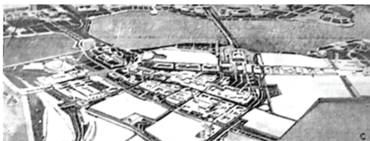
Рис. 1. Проект института «Ленгипрогор», удостоенный первой премии