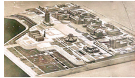
Рис. 10. Проект административного ядра общественного центра города. Макет. Институт «Казгражданпроект». Гл. арх. В.И. Борисов. Середина 1970-х гг.

Проект центра Казани вобрал в себя новые принципы композиционной организации ансамблей площадей, возникшие в нашей стране в 1970-х гг., которые наиболее ярко отражены в проекте главной площади нового центра. Основа композиции площади – открытое пространство, не имеющее отчетливых границ и сильно выраженных осей симметрии. Пространственная организация площади подчинена определенной логике ритмических построений, визуальных взаимосвязей, уравновешенности системы объемов и пространств (рис. 10).