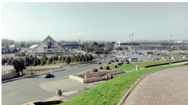
Рис. 3. Вид от Кремля с площади 1-го Мая на нижнюю террасу города в сторону р. Волги.