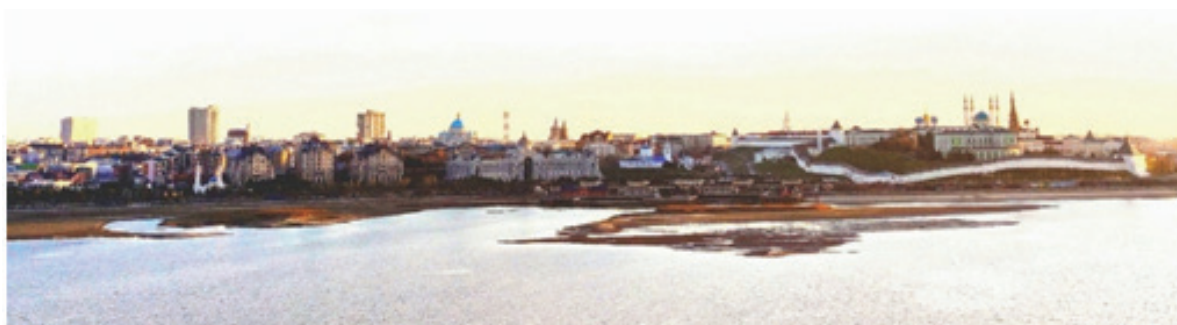
Рис. 7. Современная панорама г. Казани со стороны правого берега р. Казанки.