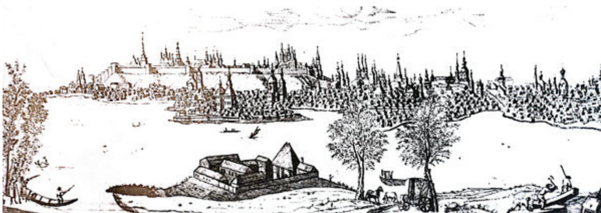
Рис. 5. Панорама г. Казани со стороны Адмиралтейской слободы 1767 г. Гравюра неизв. художника, 1767 г., ЦГВИА СССР, Ф. ВУА, Д. 21986, Л. 7