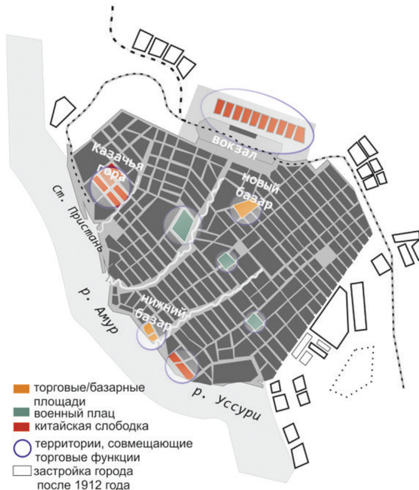
Рис. 1. Схема расположения торговых объектов на территории Хабаровска 1877–1921 гг. Сост. Ю.В. Ордынская

Естественно, что первично торговля осуществлялась на причале и только в 1880 г. в целях улучшения городского устройства была создана специальная комиссия, обратившая внимание на специфику формируемого торгового пространства, благодаря чему были определены и место, и «базарные старосты», отвечавшие за порядок в процессе реализации нехитрых товаров, большинство из которых составляли продукты речного промысла, а также простейший бытовой импорт из Китая. В результате уже в 1890-х гг. на торгах появились деревянные лавки, впоследствии замененные на двухэтажные каменные ряды на 16 мест [20].