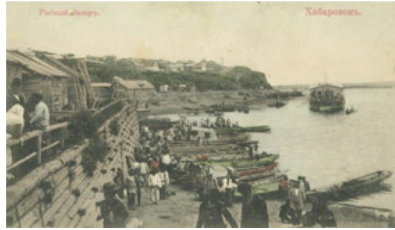
Рис. 3. Нижний базар. Хабаровск. Конец XIX в.