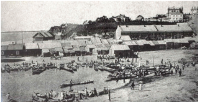
Рис. 2. Нижний базар. Хабаровск. 1903.