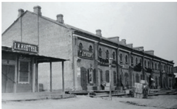
Рис. 4. Торговые ряды Нижнего базара. Первая треть XX в.