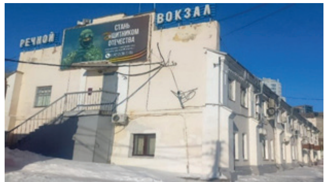
Рис. 5. Торговые ряды Нижнего базара. Современное состояние.

Второй этап – купеческий ряд (1899–1912): установление постоянного контроля со стороны части городского населения, сословно представленного (городского купечества) и профессионально занимающегося торговлей, над процессом организации открытых торговых площадей, результатом которого можно признать первичное появление рядов как разновидности организованной застройки.