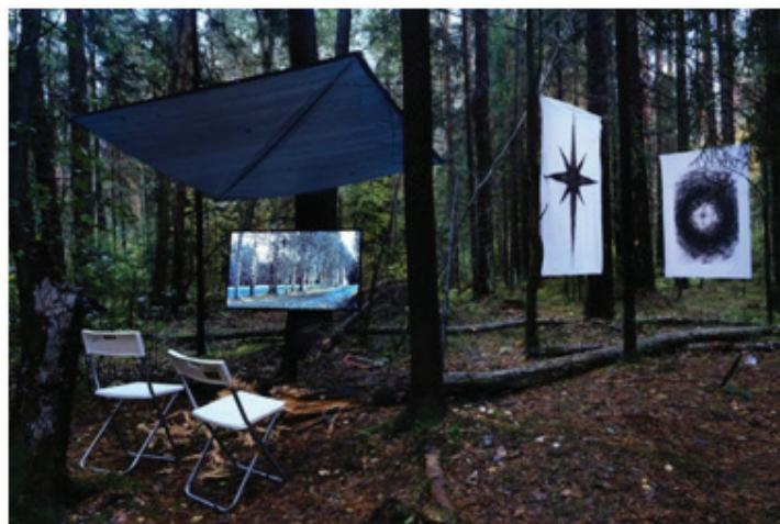
Рис. 2. Выставка «Лес» творческого объединения «10.203». 2023.