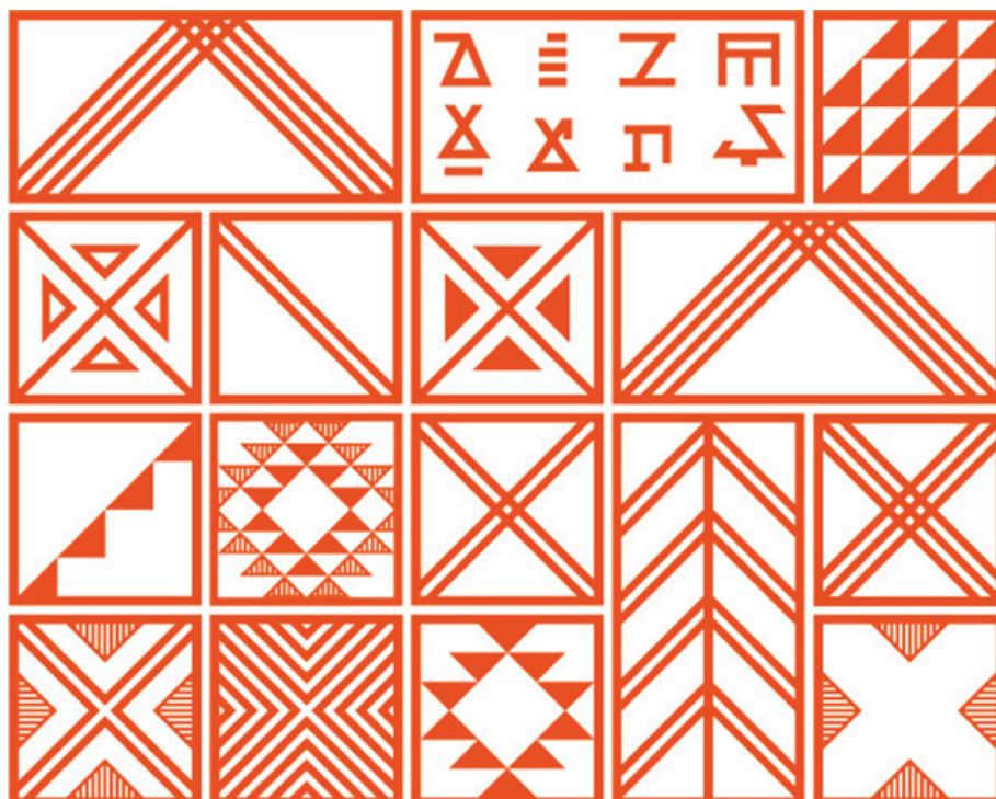
Рис. 4. Модуль паттерна культурного кода коми. Авторы А.В. Лянцевич, Д.В. Першина. Институт культуры и искусства СГУ им. Питирима Сорокина. Сыктывкар, Республика Коми, 2017