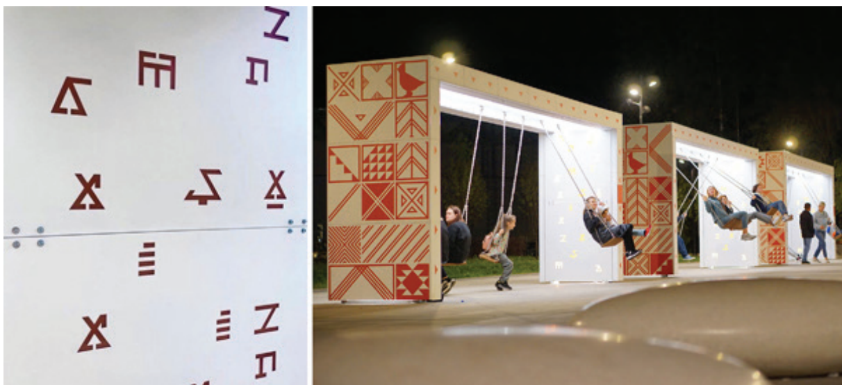
Рис. 9. Пример включения коми культурного кода в средовые объекты городского пространства «Площадка под часами». Авторы проекта В.Я. Рунг, А.В. Лянцевич, Д.В. Першина. Сыктывкар, Республика Коми, 2021