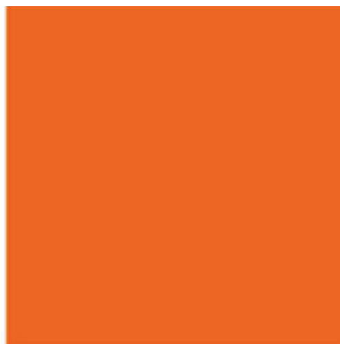
RAL 2004 Оранжевый