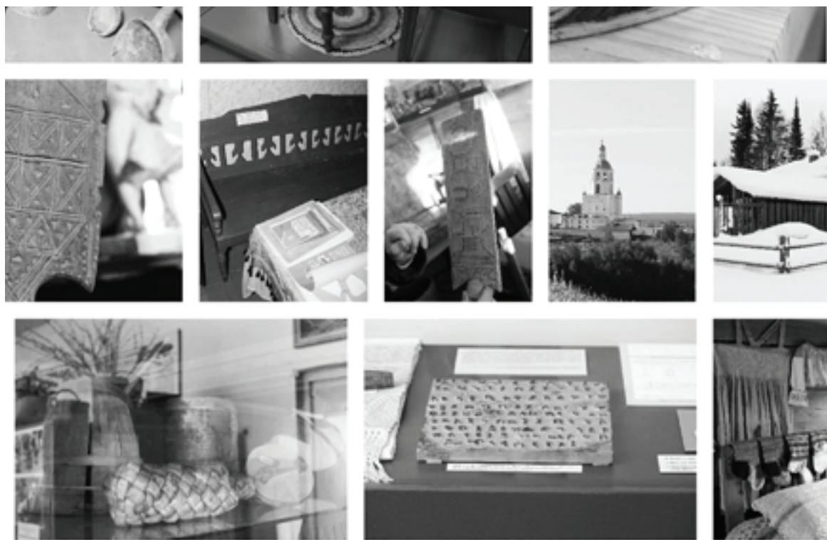
Рис. 2. Фотографии экспонатов в краеведческих и этнографических музеях Республики Коми. 2017

бова утверждает, что пасы служили основой для формирования коми орнамента, а также зырянские знаки собственности легли в основу древнепермской азбуки – анбур, составленной Стефаном Пермским в 1372 г.