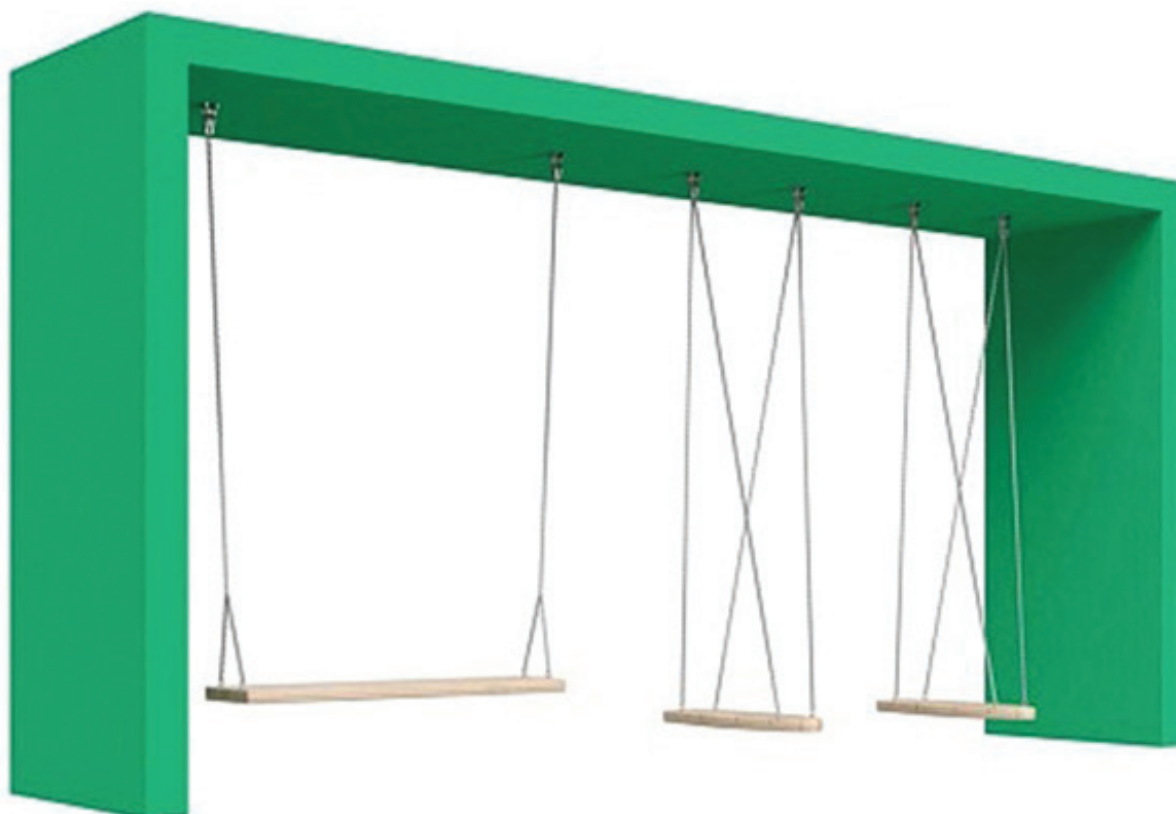
Рис. 6. Общий вид качелей Серия CLOUDS компании AIRA

морозам. Дерево обрабатывается лазурью с высокой стойкостью к истиранию. Все металлические части изделия окрашиваются полимерной порошковой краской по каталогу RAL Classic. Габариты 7 x 1,5 x 3,5 м. Качели выдерживают от 4 до 6 человек.