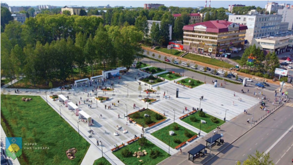
Рис. 8. Городское пространство «Площадка под часами». Сыктывкар, Республика Коми, 2021