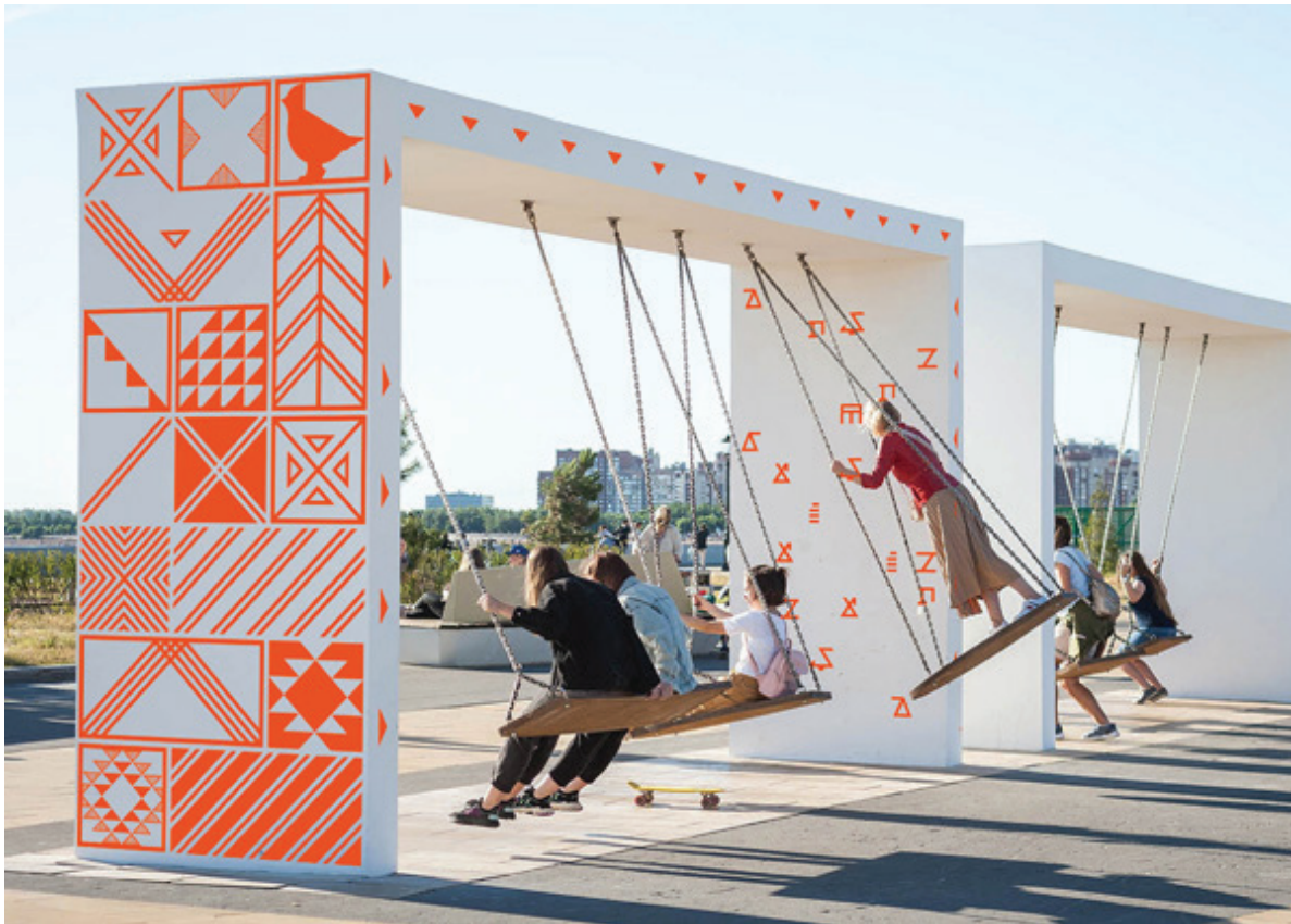
Рис. 7. Паттерн культурного кода культуры коми и мокап на качелях. Авторы В.Я. Рунг, А.В. Лянцевич, Д.В. Першина. Сыктывкар, Республика Коми, 2021

Презентация проекта. Презентация проекта проходила перед городскими и учебными сообществами. С целью знакомства с художественным решением широкой общественности проект был опубликован на сайтах Администрации МО ГО «Сыктывкар», Информационного государственного агентства Республики Коми «Комиинформ» и в социальных сетях.