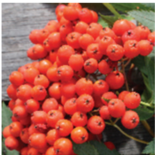
Рябина красная обыкновенная