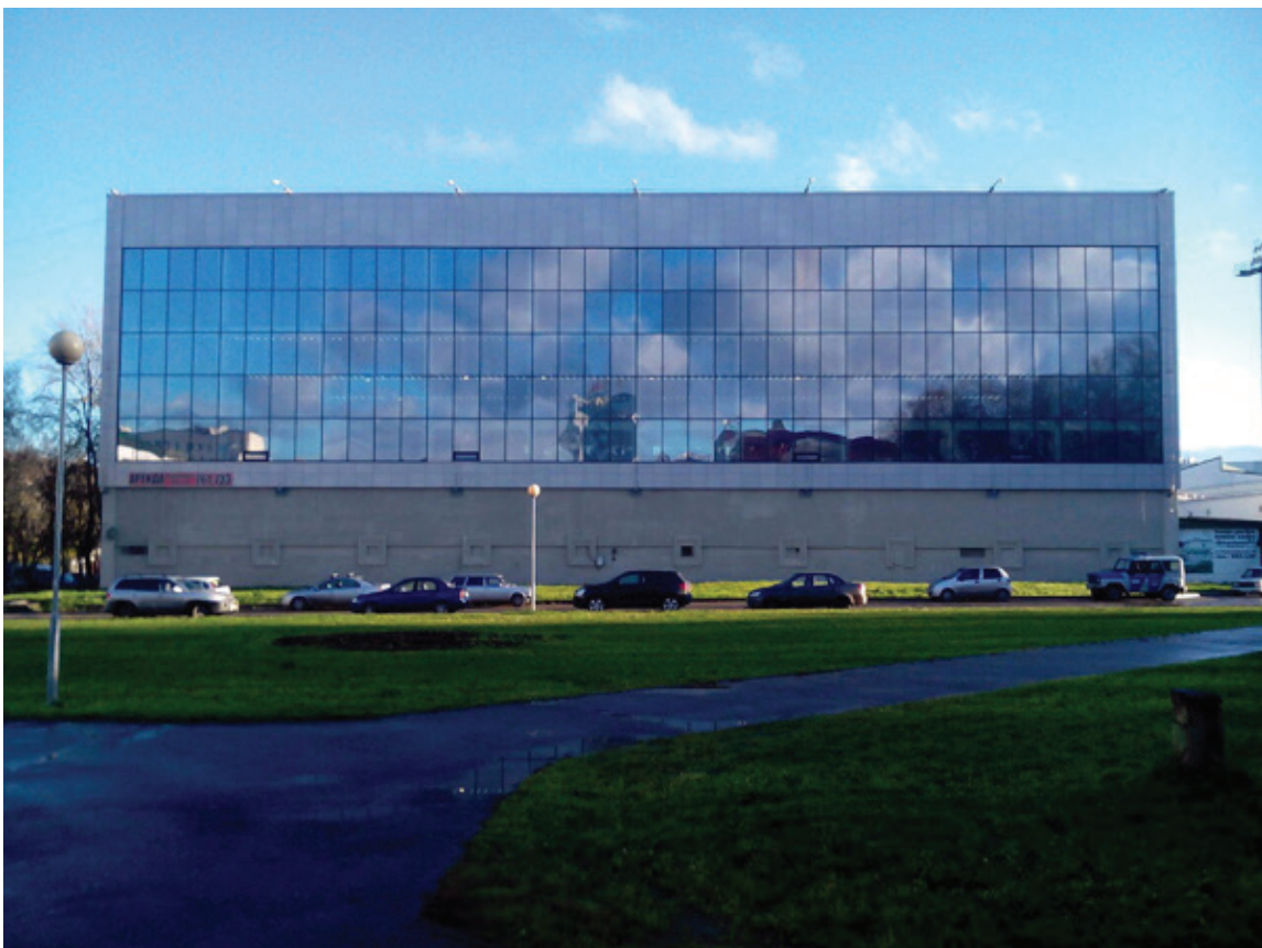
Рис. 1. «Площадка под часами» до преобразования. Сыктывкар, Республика Коми, 2017

Объектом проектирования является уличное пространство и в основу концепции вошло радикальное преобразование территории, создание точки притяжения для молодого поколения и отображение в малых архитектурных формах визуального кода культуры Коми региона, что позволит выразить локальную идентичность всего региона в самом центральном общественном пространстве города.