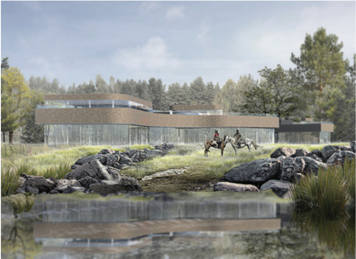
Рис. 2. Пример интеграции комплекса в среду за счет колористического решения и светопрозрачных конструкций. Автор П. Можная

4. С опорой на знаки в культуре народов Алтая форма плана здания создается по мотивам тубаларских растительных узоров, которые в силу разнообразия и плавности способны придать динамику и подстроиться под большинство требований к планировочной организации. Некоторые элементы формообразования комплекса задаются подражанием деталям одежды тубаларов. Например, формы традиционного голоного убора служат основой для решения надстроек верхних этажей. Изгибы в плане отдельных зон объекта и круглые светопрозрачные конструкции кровли служат отсылкой к значению круга в геометрических орнаментах тубаларов как символа законченности, совершенства, непрерывности. При подборе колористических решений отдаются предпочтения светлым тонам, избегаются тёмные, в частности черный с серым. Возможен учет свойственной для алтайцев полихромии [6].