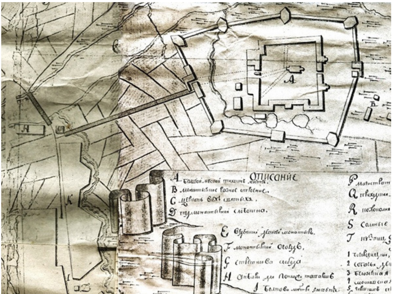
Рис.1. План Тихвинского посада Литвинова (фрагмент),1766 г.

Кроме монастырских, начали появляться и «градские» богадельни, но и они, как правило, формировались при городских церковных приходах [18].