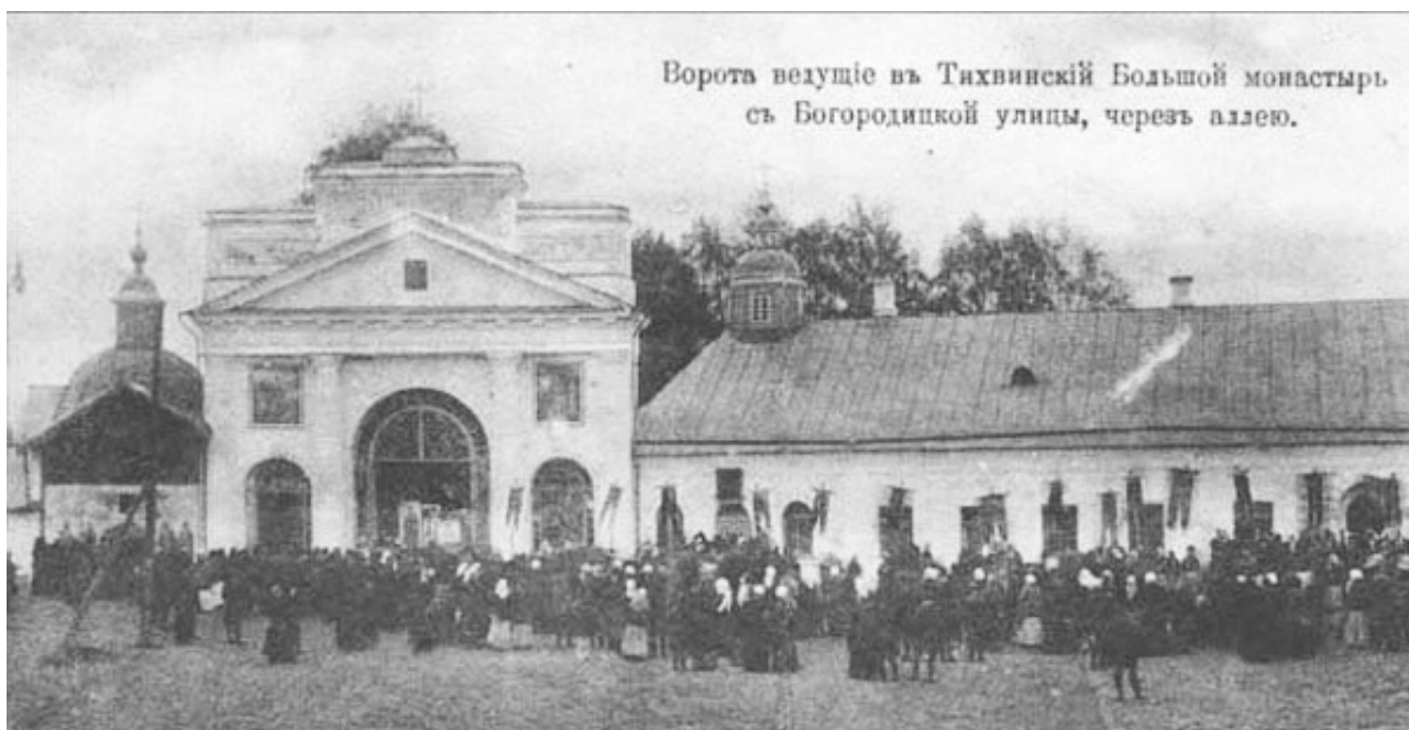
Рис. 4. Ворота, ведущие в Тихвинский большой монастырь, и часть фасада богадельни.

Предусмотрен парадный подъезд с большим залом у входа, парадные лестницы, конторские помещения и помещение для швейцаров и охраны. Указываются общие размеры главного здания, архитектурный стиль здания Академия оставляет на усмотрение конкурсантов – «Фасадъ здания по лицу долженъ быть не длиннее 75 сажень, стиль архитектуры на произволь» [14, с. 24].