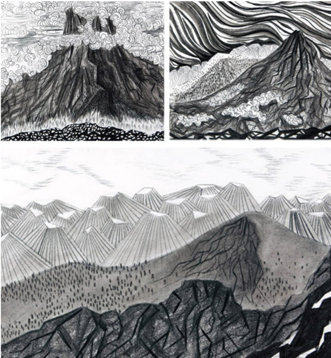
Рис. 7. Серия «В облаках». Бескорская Д., студ. I курса кафедры графического дизайна