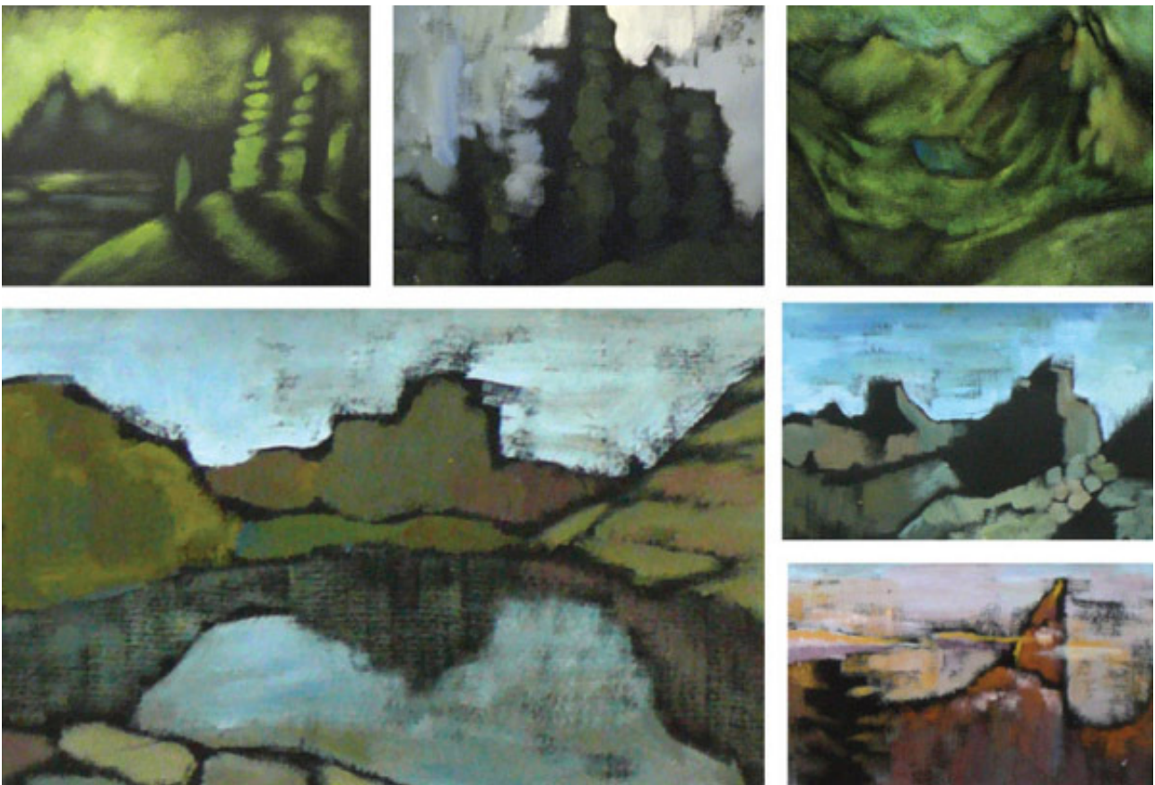
Рис. 4. Эскизные поиски к серии «Горные духи». Горелова И., студ. I курса кафедры графического дизайна