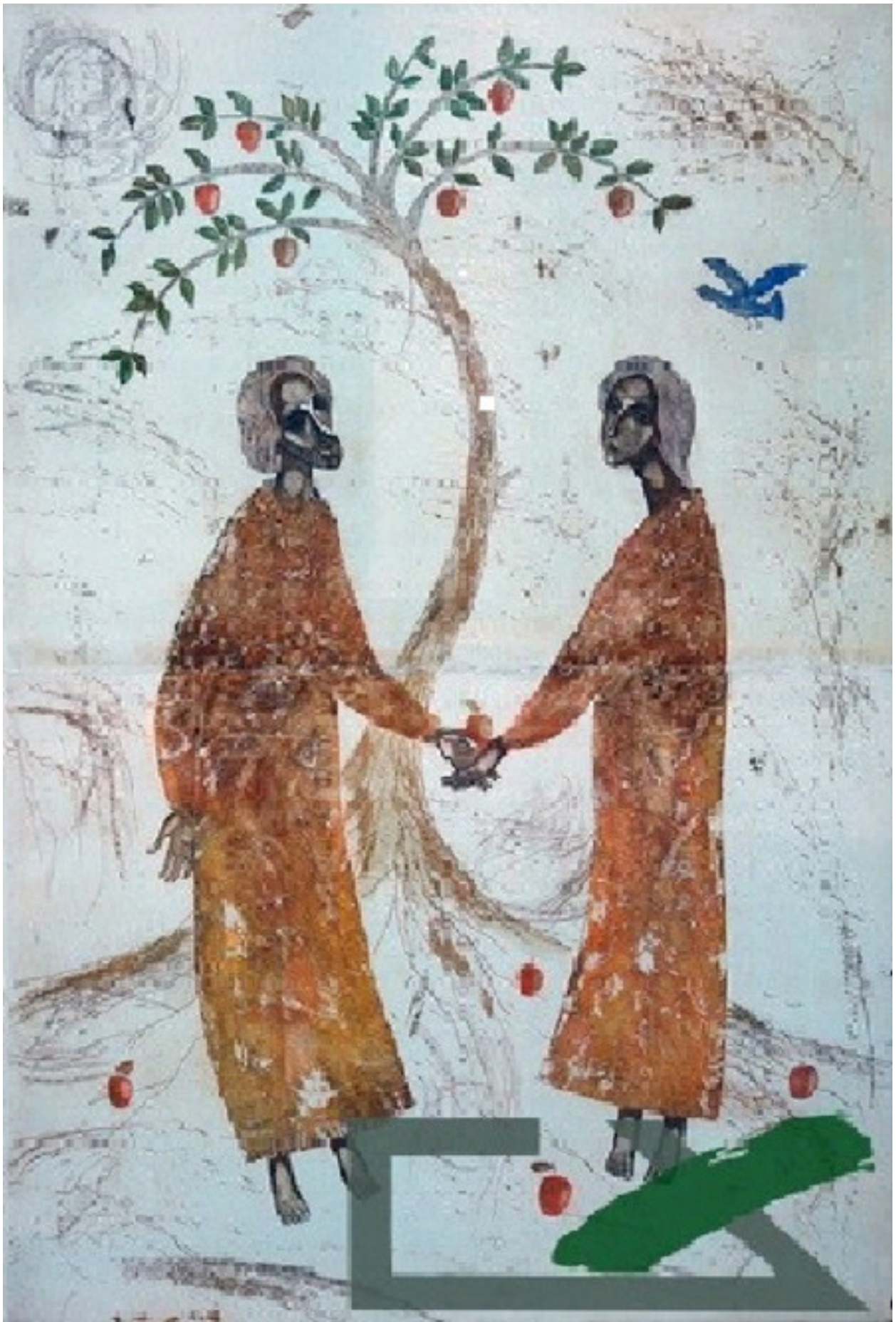
Рис. 1. А. Н. Машанов «Яблоневый спас», 2005.