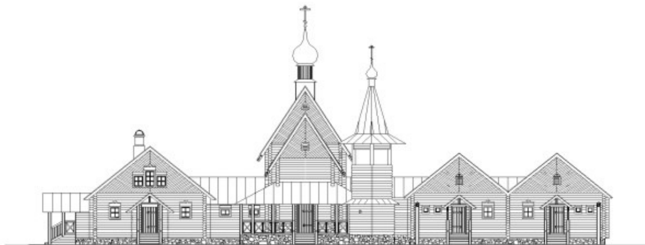
Рис. 1. Фасад скита

исторической части, которая и представляет основной интерес для туристов и паломников.